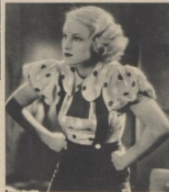
Titina Mandlová ve scéně z filmu „Život je pes“.