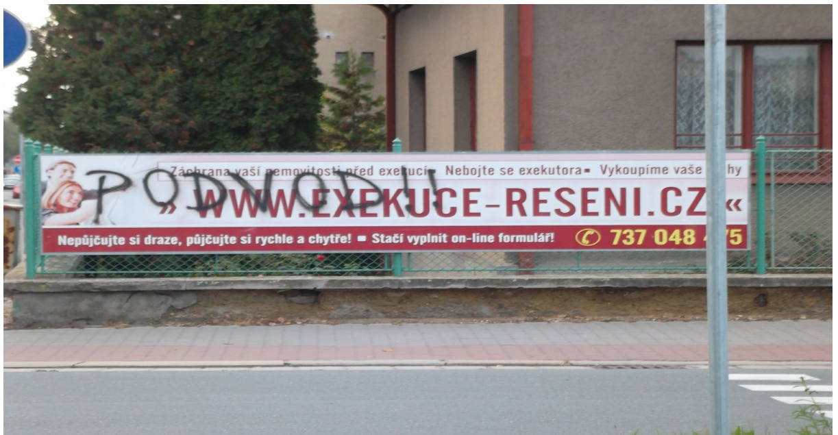
Obrázek 1 Reakce dlužníka? - ul. S.K. Neumanna v Pardubicích

Exekuce je zákonný postup , při kterém se věřitel snaží vymoci pohledávku od dlužníka, který nesplnil své závazky. Podkladem je vždy exekuční titul , kterým může být vykonatelný rozsudek nebo platební rozkaz, rozhodčí nález a výkaz nedoplatků sociálního a zdravotního pojištění. V ČR funguje tzv. dvojkolejnost výkonu rozhodnutí neboli exekuce. Výkon rozhodnutí (VR) může provádět buď sám soud prostřednictvím svých vykonavatelů , nebo pověřený soudní exekutor . Okrajově se můžeme dále setkat se správní exekucí, tj. povinnosti uložené ve správním řízení se vymáhají u exekučního správního orgánu (většinou u obecního úřadu s rozšířenou působností) a dále s daňovou exekucí, kdy nedoplatky na daních a pokutách v daňovém řízení můžou vymáhat dle daňového řádu samostatně finanční úřady.