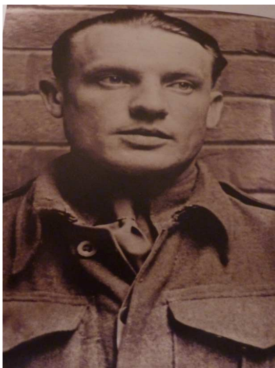
Rt. Karel Čurda, zrádce parašutistů. 444