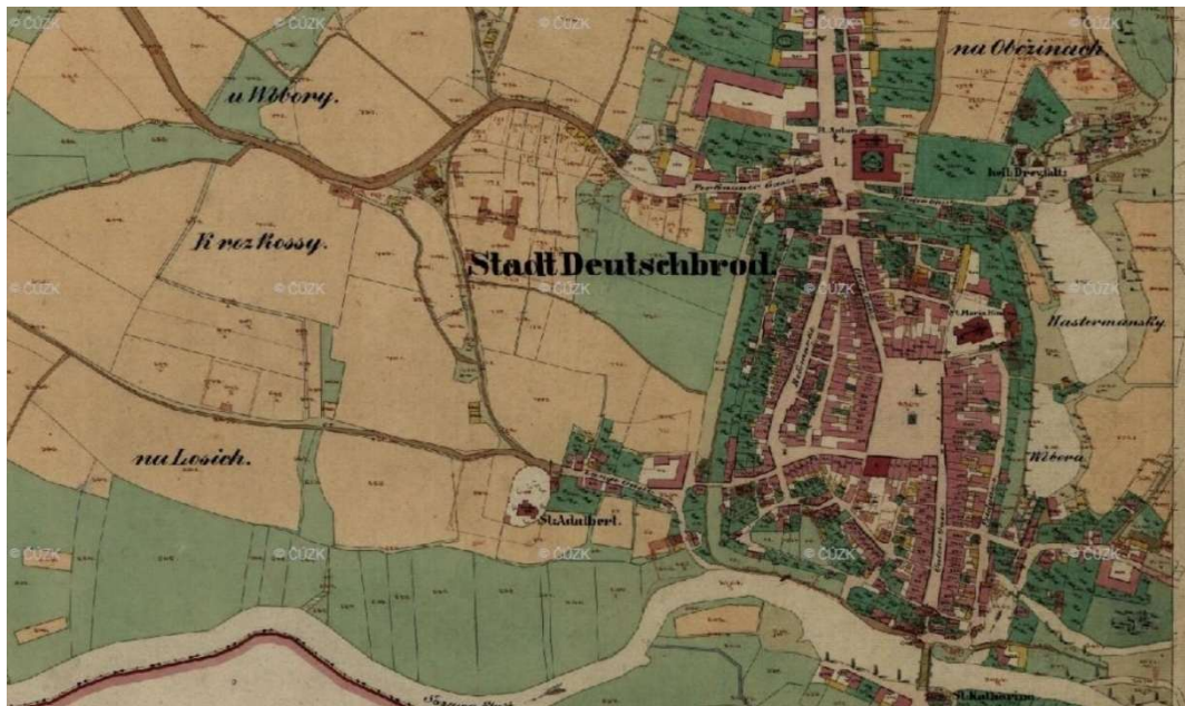
Obrázek č. 2: Originální mapy stabilního katastru pro Havlíčkův Brod a Humpolec 375