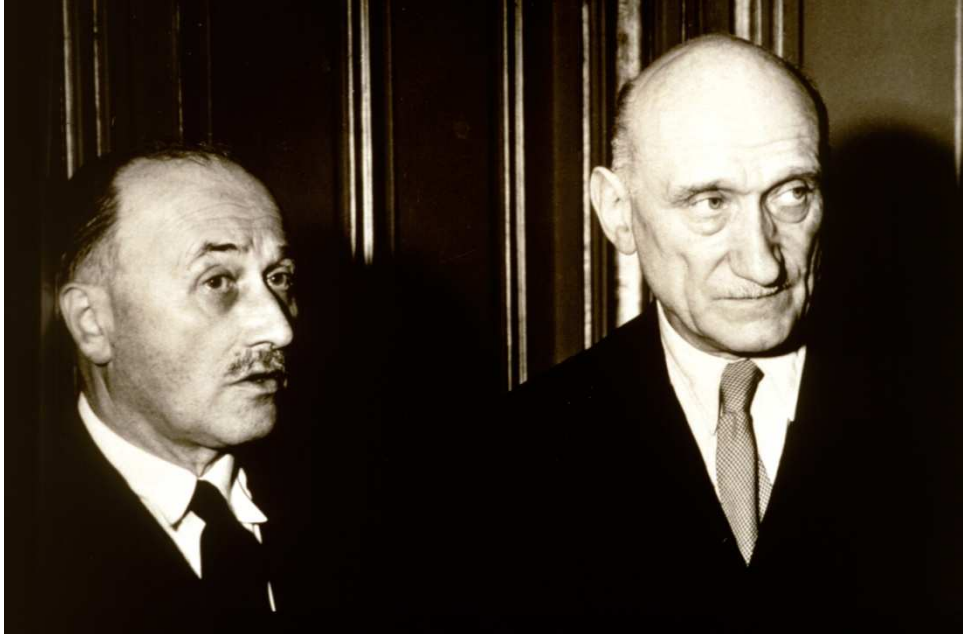
Příloha č. 1: Jean Monnet a Robert Schumann

http://media-2.web.britannica.com/eb-media/83/97483-004-C6B3E1A4.jpg