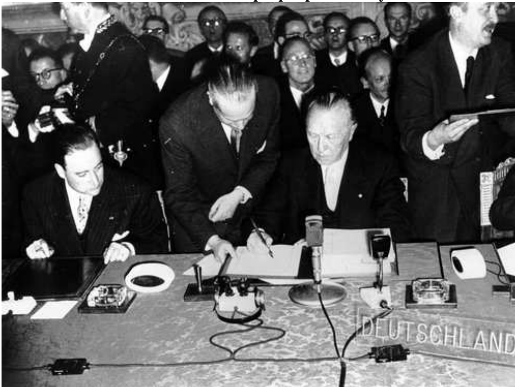
Příloha č. 2: Konrád Adenauer při podpisu římských smluv 1957

http://www.euroskop.cz/gallery/42/12677-konrad-adenauer-podepisuje-rimske-smlouvy.jpg