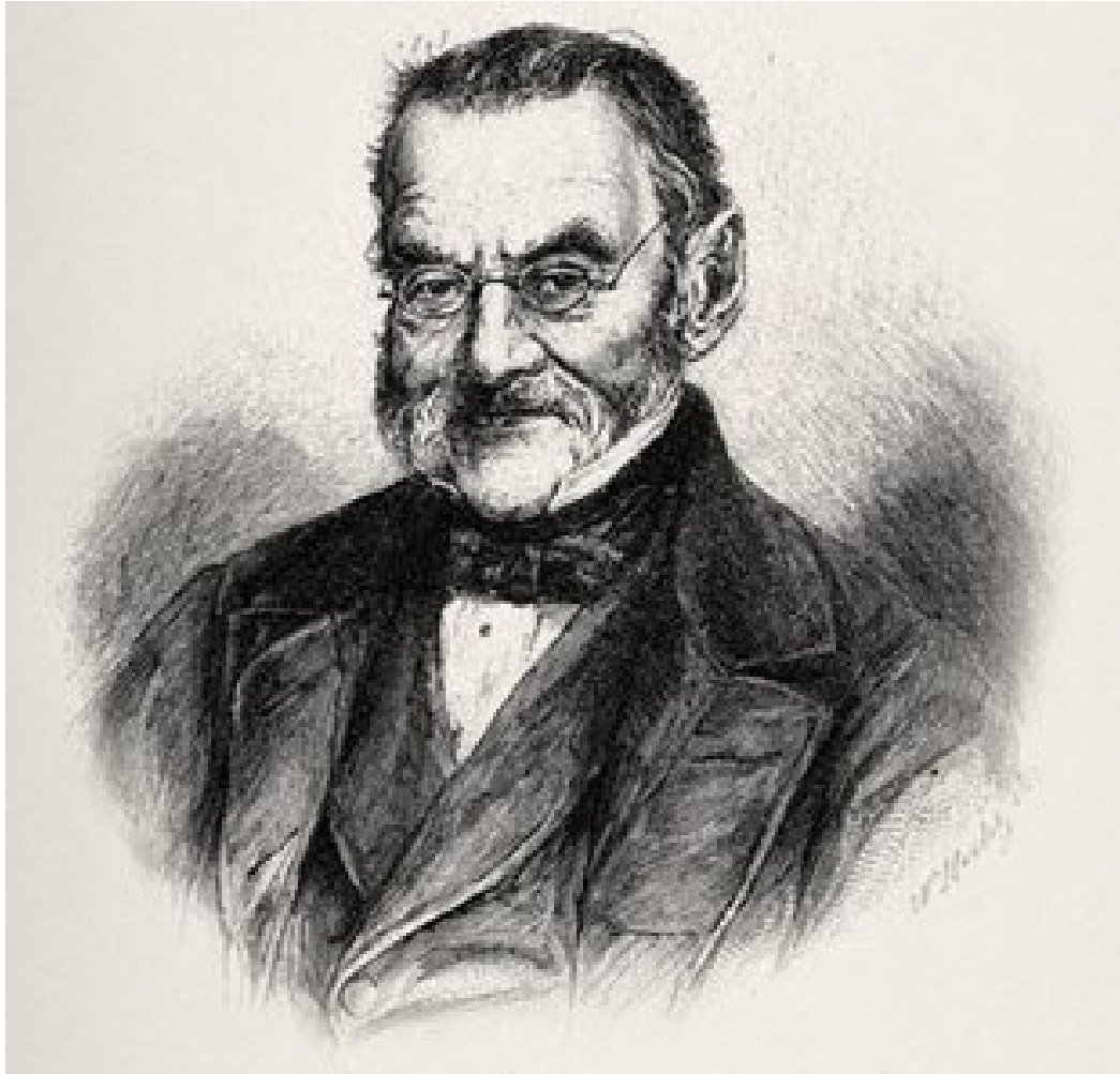
Anlage 2: Charles Sealsfield