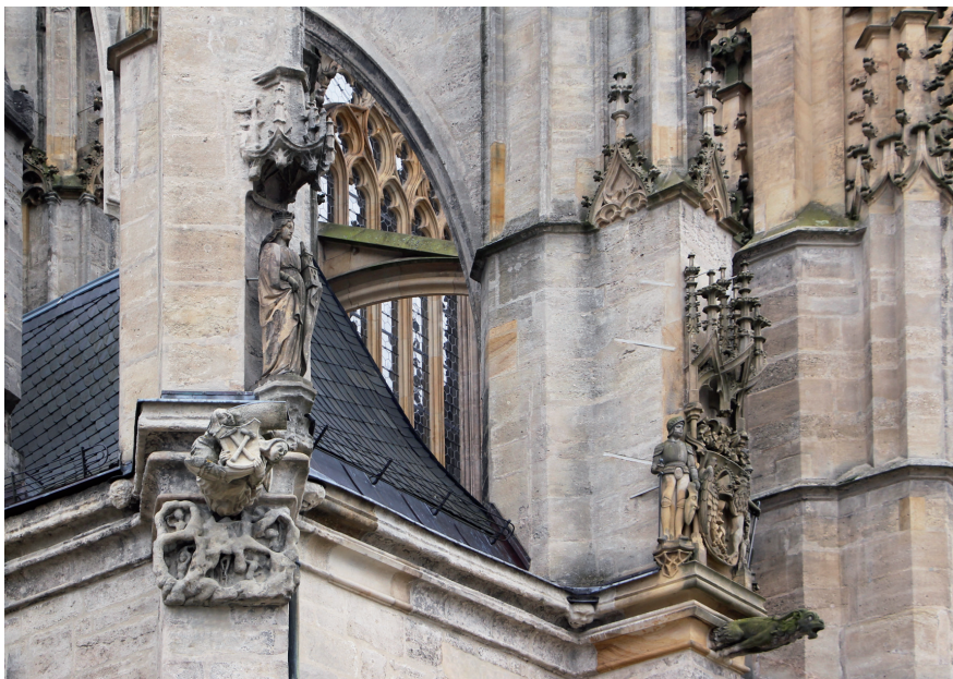
Obr. 2. Výzdoba nad severním vstupem do chrámu sv. Barbory.

běhu 80. let 15. věku (obr. 2). Žádné jiné městské korporaci totiž nebyl obdobný prostor dán k dispozici. 15 Stežší bychom našli výmluvnější doklad respektovaného postavení pořádku.