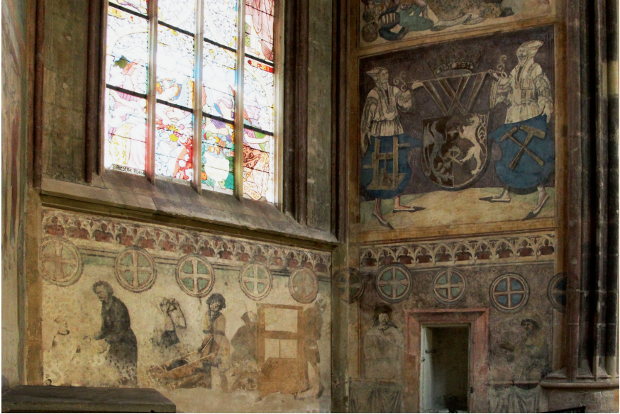
Obr. 5. Chrám sv. Barbory – Hašplířská kaple. Vlevo dole pracovní scéna, vpravo nahoře kutnohorský městský erb nesený hašplířem a havířem.