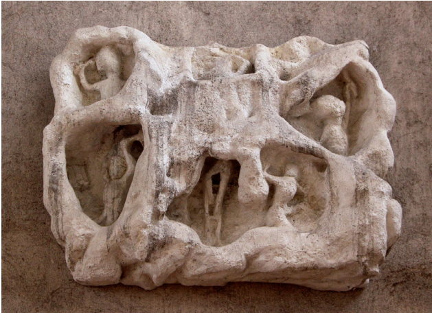
Obr. 6. Reliéf znázorňující práci havířů pod zemí. Součást výzdoby severního vstupu do chrámu sv. Barbory. Sádrová kopie vystavená na chrámové empoře.