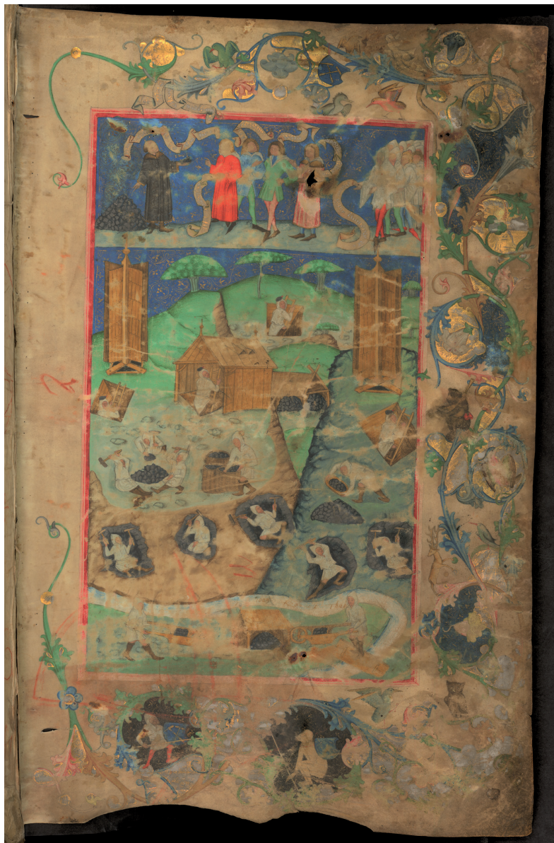
Obr. 7. Titulní list kancionálu z roku 1471. Dnes v NK, sign. XXIII A 2, fol. 1r.