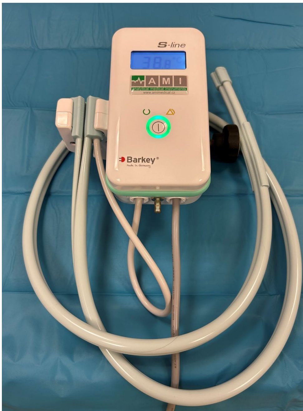
Obrázek 8 Ohřivač infuzí AMI