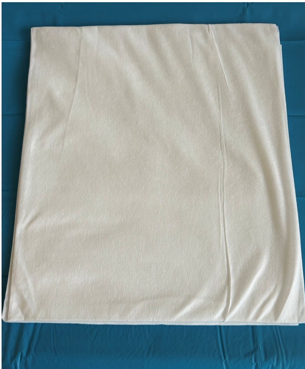
Obrázek 2 Savánek