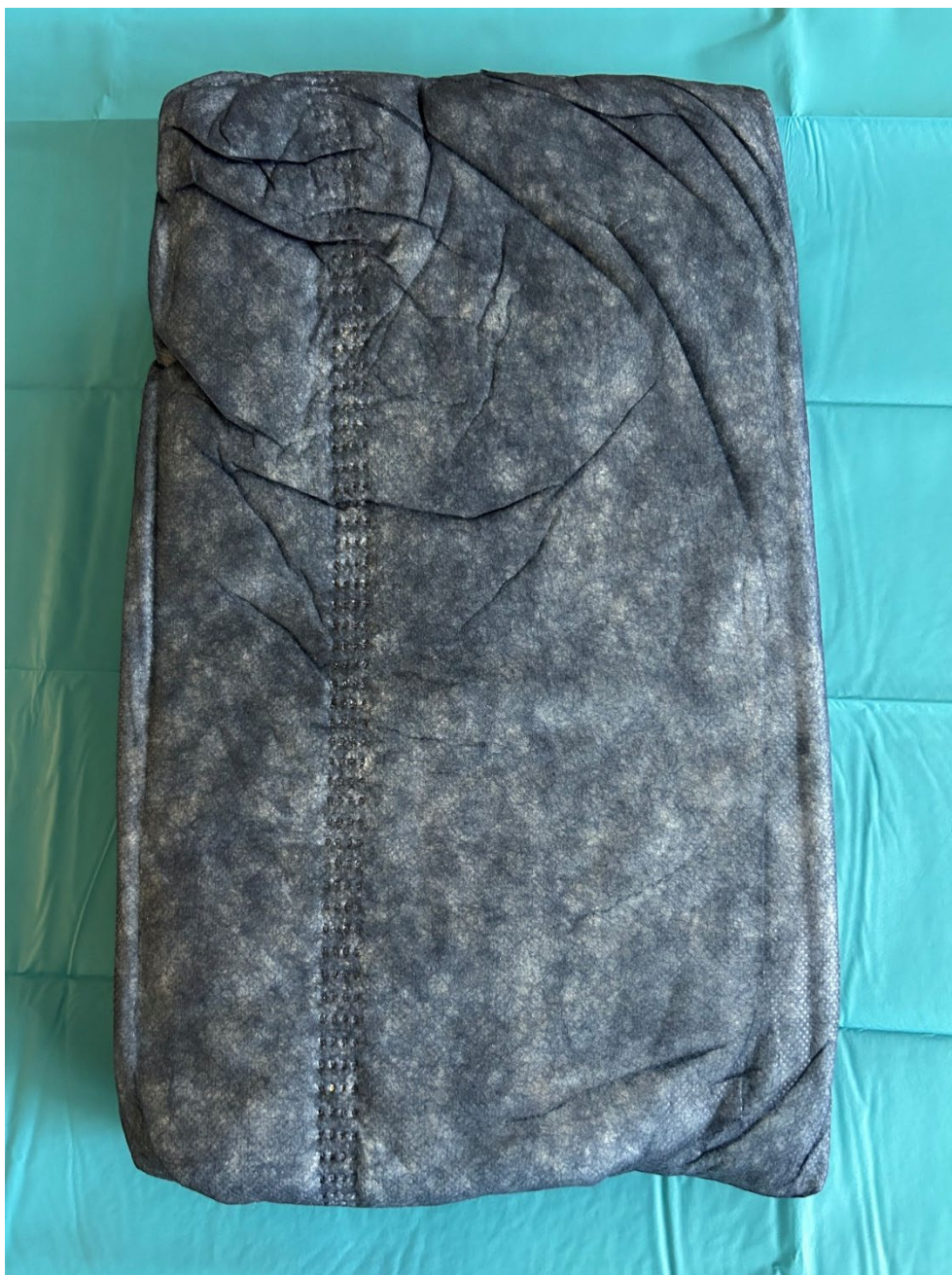
Obrázek 3 Jednorázová přikrývka