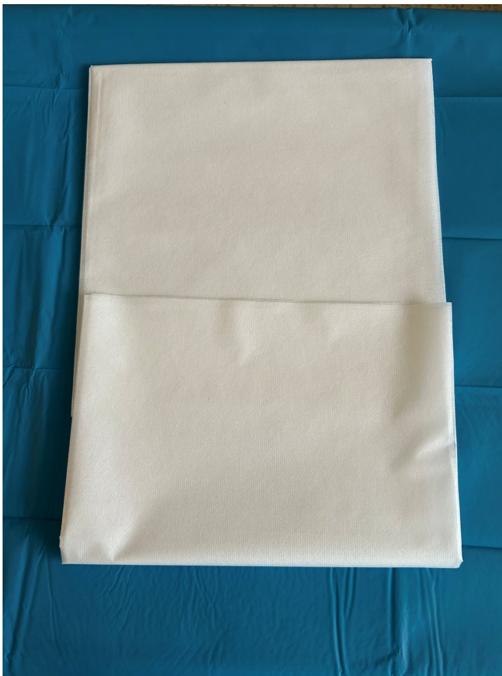
Obrázek 1 Jednorázová folie