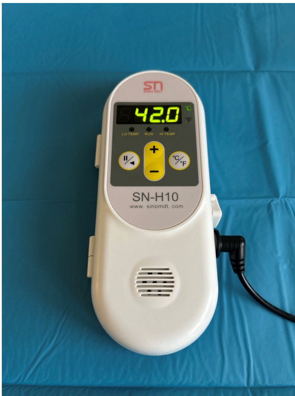
Obrázek 7 Ohříváč infuzí SN-H10