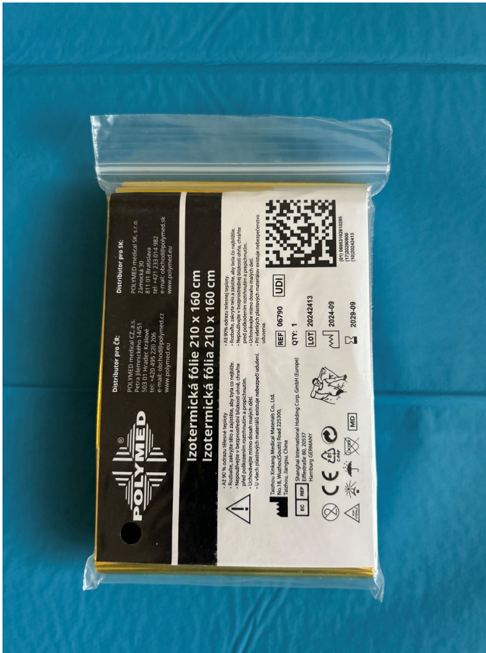
Obrázek 4 Izotermická fólie