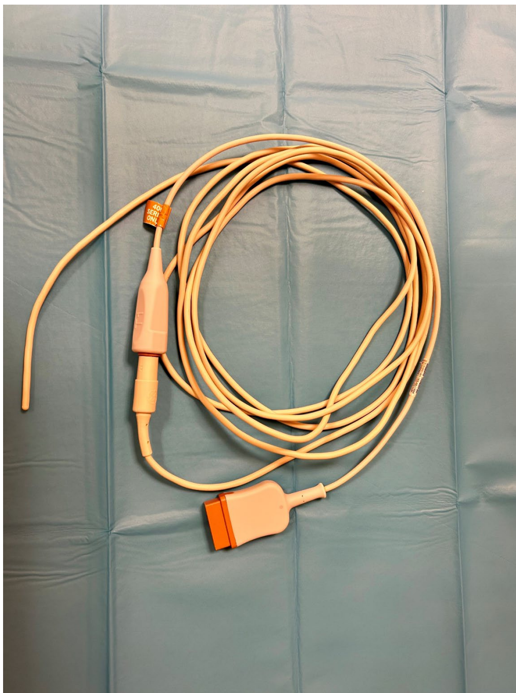
Obrázek 6 Teplotní čidlo