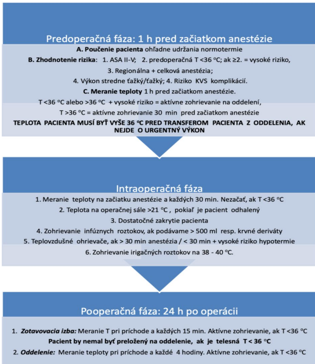
Obrázek 9 Metodický pokyn k prevenci perioperační hypotermii

Pacientom s operačným výkonom v anestézii je potrebné merať telesnú teplotu s intervalom najmenej 30 minút a zapísať hodnoty teploty do záznamu o anestézii. Odporúča sa využiť technológie efektívne na aktívne zohrievanie pacientov počas anestézie. Pri veľkých výkonoch a predpokladaných veľkých stratách objemu je potrebné aj aktívne zohrievanie infúzných a transfúzných prípravkov.