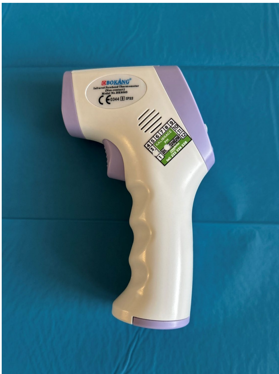
Obrázek 5 Teploměr Bokang 8005