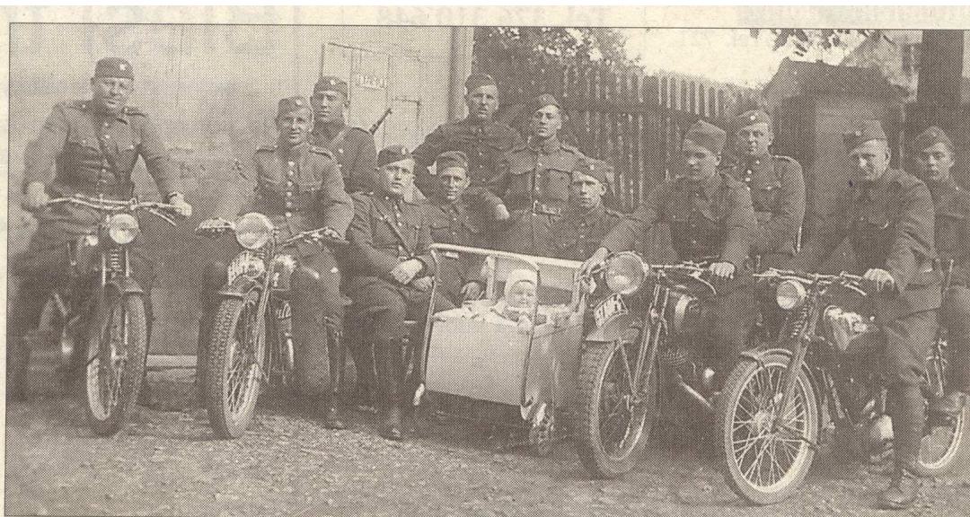
Tento snímek se zrodil v době mnohem méně pohodové. Fotograf stiskl spoušť ve dvoře brnířovské Gruberovy hospody v roce 1938, v době mobilizace.