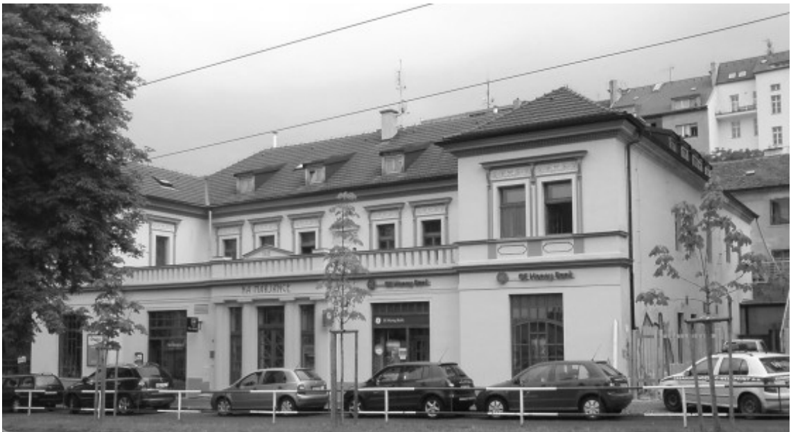
Stav po kompletní rekonstrukci, dokončené v roce 2008.