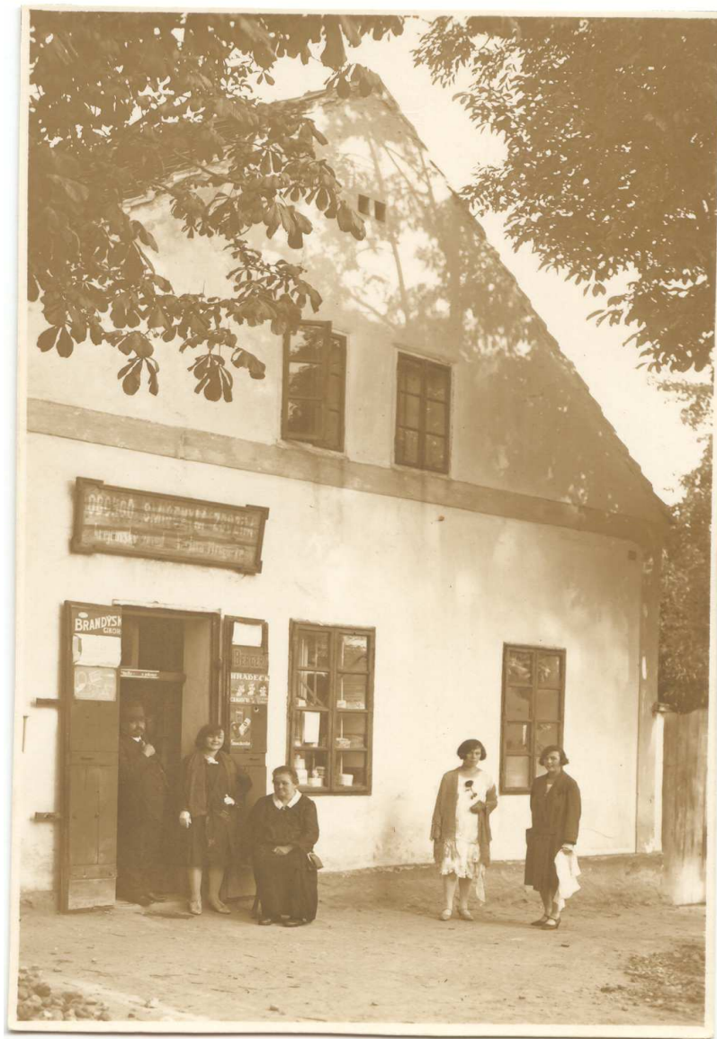
Krámek Grubrova hostince, 20. léta 20. století.