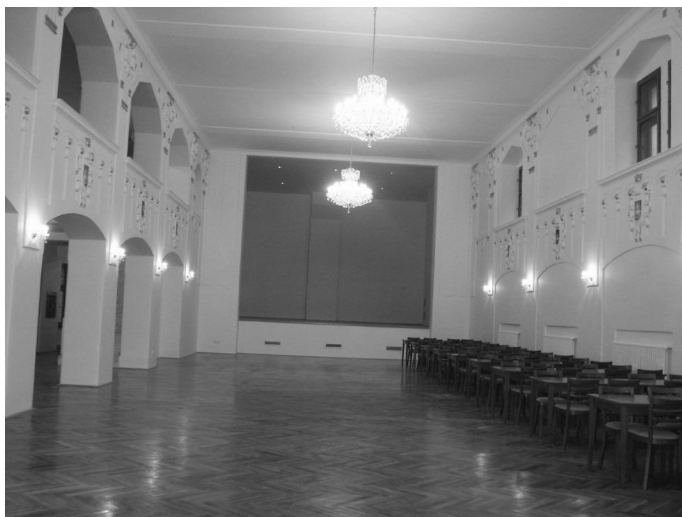
Taneční sál, stav po rekonstrukci, řada nepůvodních prvků, lustry odlišné od situace před devastací objektu, dle původních materiálů neobnoven prostor kolem jeviště.