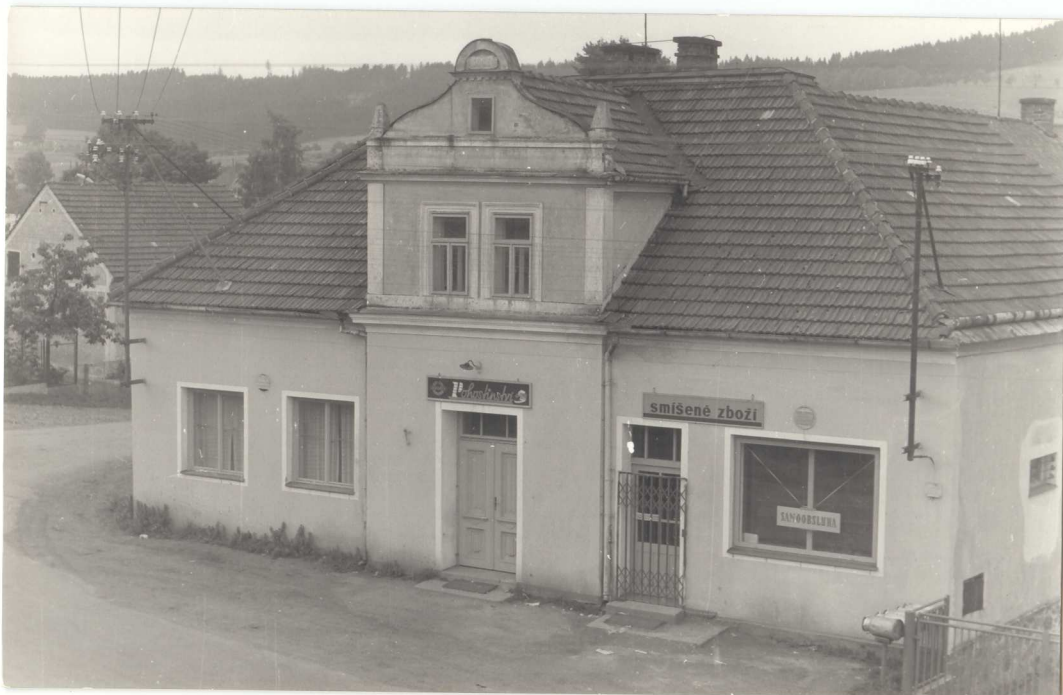
Obchod se smíšeným zbožím provozovaný Jednotou.