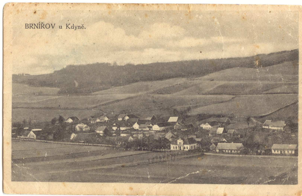
Celkový pohled na Brnířov, v popředí Grubrův hostinec.