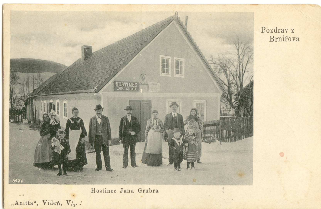
Grubrův hostinec, pravděpodobně 90. léta 19. století.