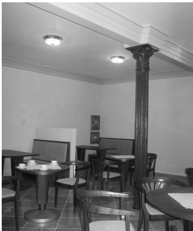
Prostor bývalého předsálí, dnes kavárna. Sloup původní, dřevěné kazetové obložení stěn nebylo při rekonstrukci obnoveno.