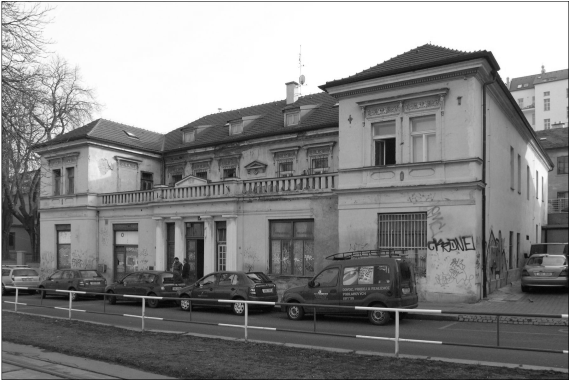
Stav po první části rekonstrukce, kdy vyměněny krovy a střešní krytina.