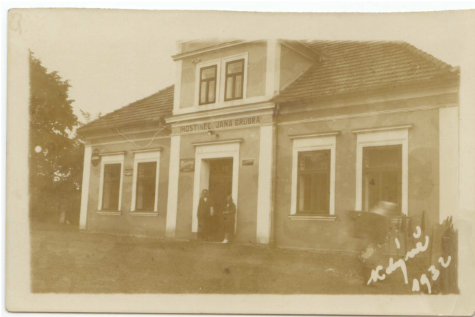
Hostinec po dokončení přístavby, 30. léta 20. století.