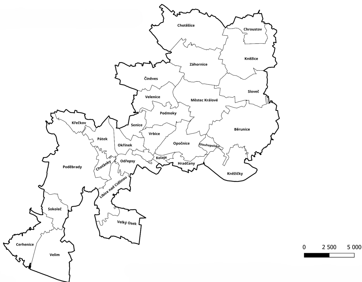
Obrázek 2: Mapa Místní akční skupiny Mezilesí 2024

Samotné území a členské obce MAS Mezilesí je znázorněno na následujícím obrázku 2, který vyobrazuje mapu MAS Mezilesí.