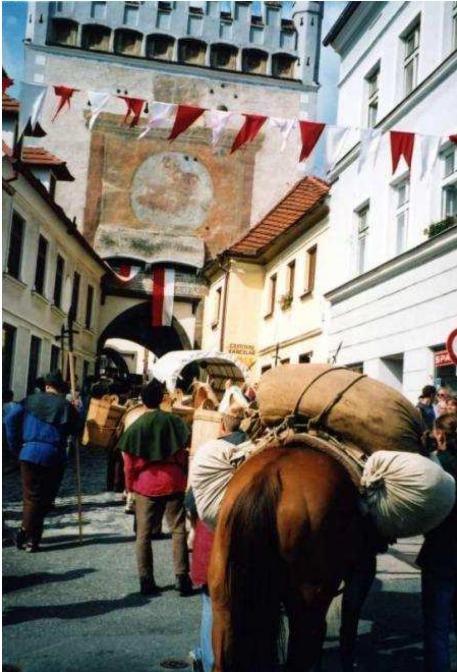
Anlage 2: Säumerzug am Unteren Tor in Prachatice