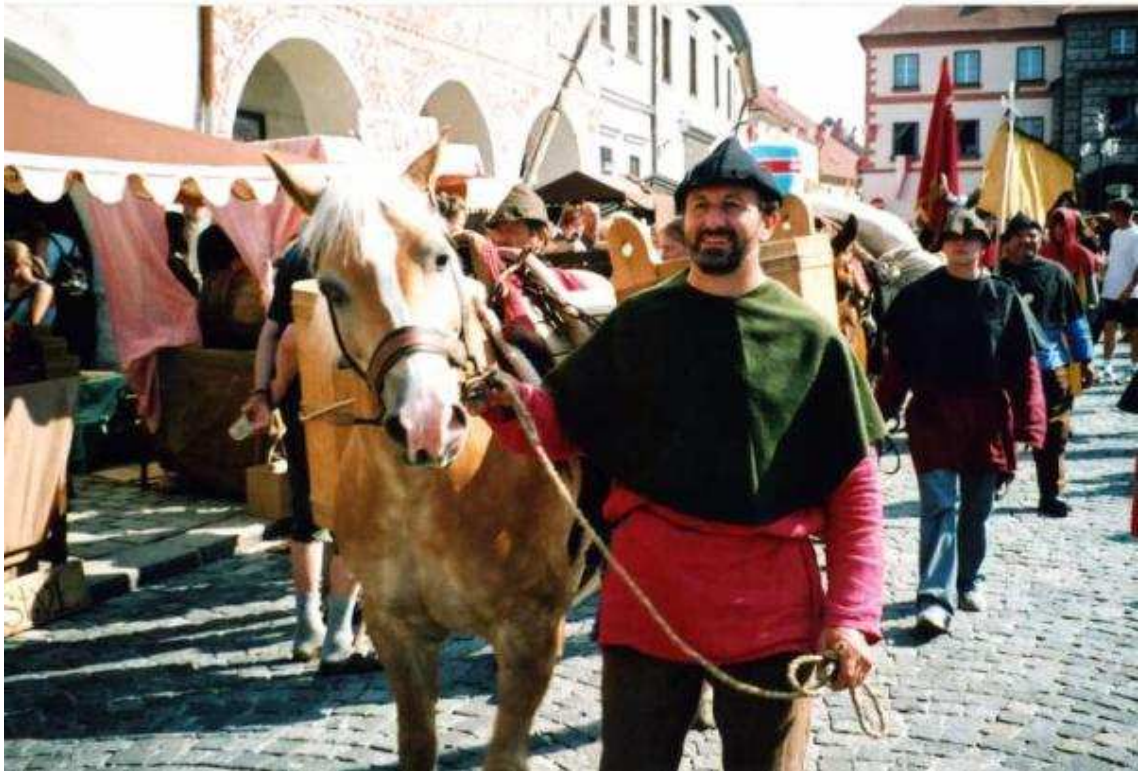
Anlage 1: Stadtfestival des Goldenen Steiges, Prachatice