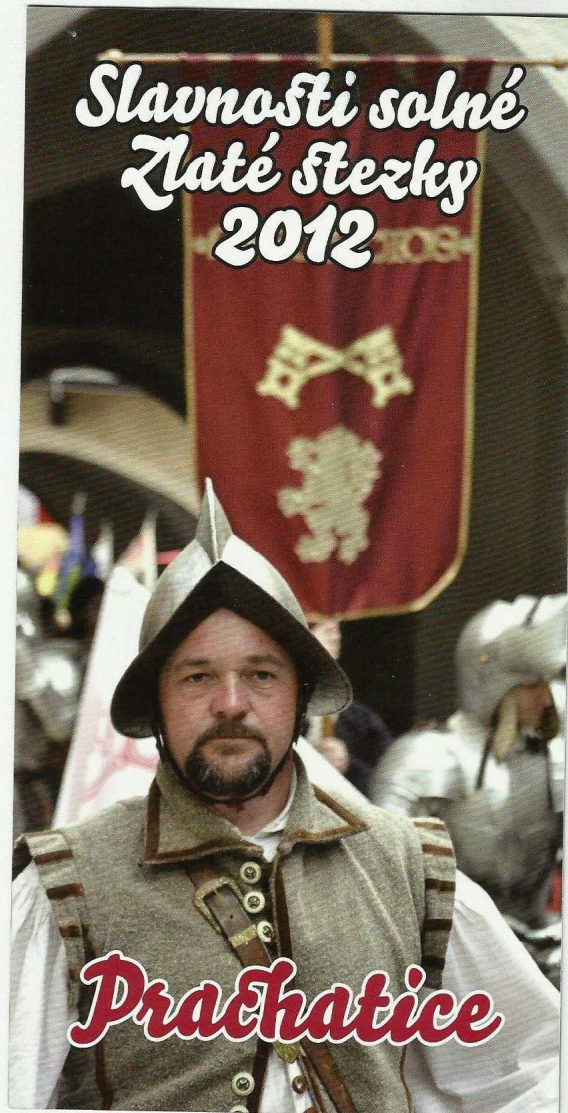
Anlage 7: Prospekt „Slavnosti solné Zlaté stezky 2012“