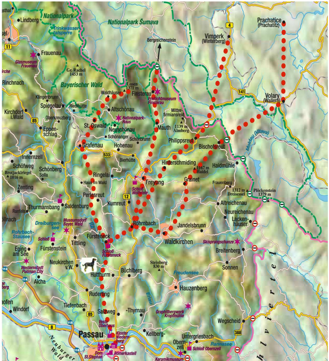
Anlage 5: Der Goldene Steig und seine Nebenwege