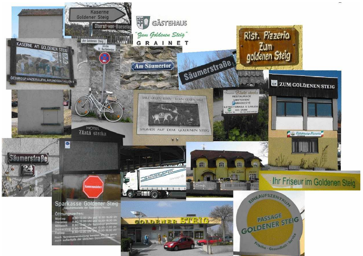
Anlage 8: „Goldener Steig“ in den Namen