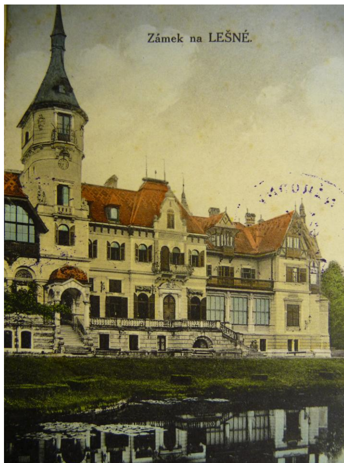
15. Dobová pohlednice zámku Lešná (pohled od jezírka).