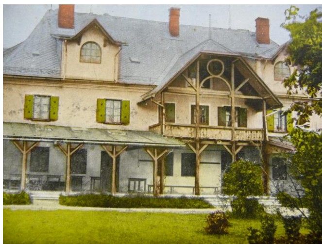
23. Lázeňský dům.