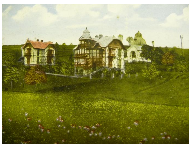
24. Lázeňské domy a kaplička.