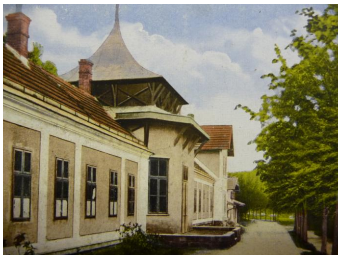
22. Kolonáda lázní Kostelec.