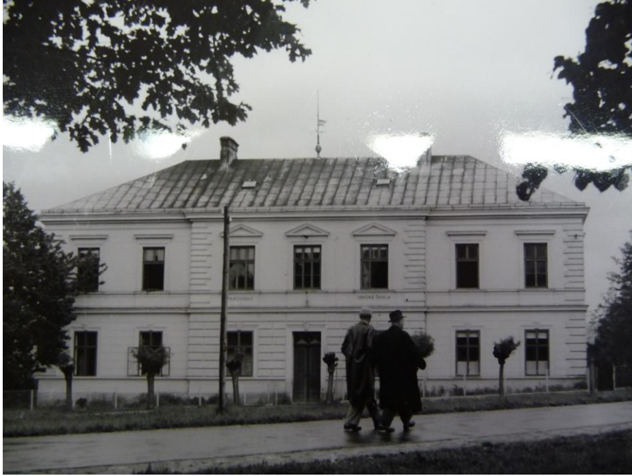
20. a 21. Škola ve Štípe.