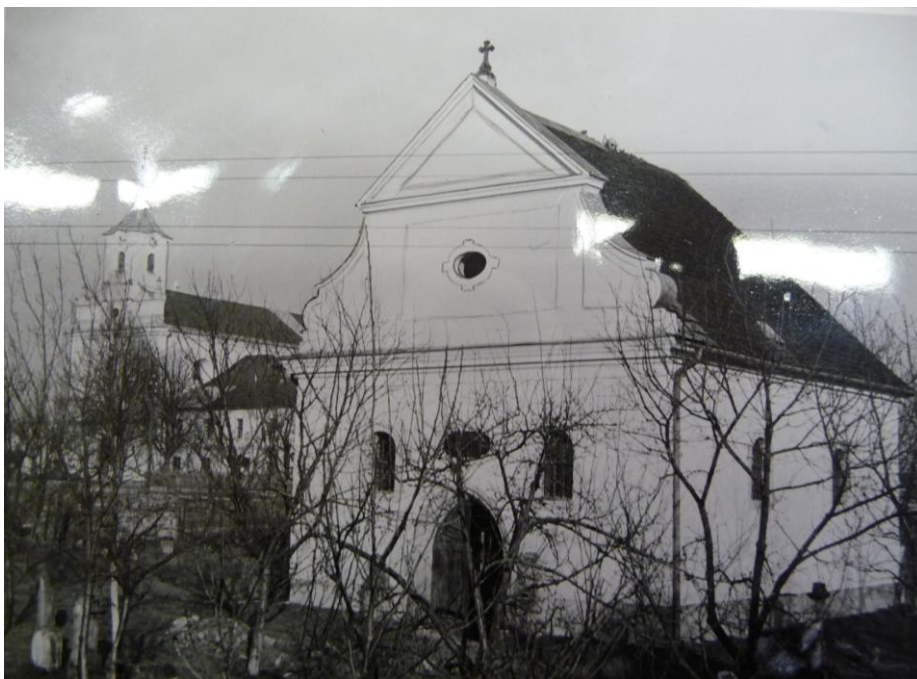
25. Starý kostel ve Štípe.