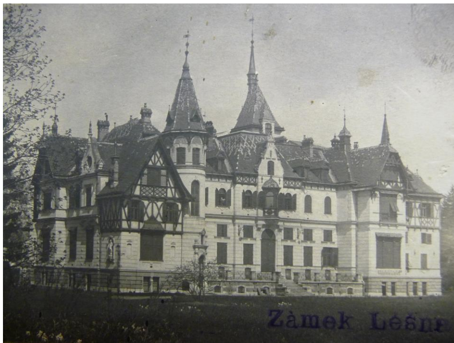
14. Dobová fotografie zámku Lešná.