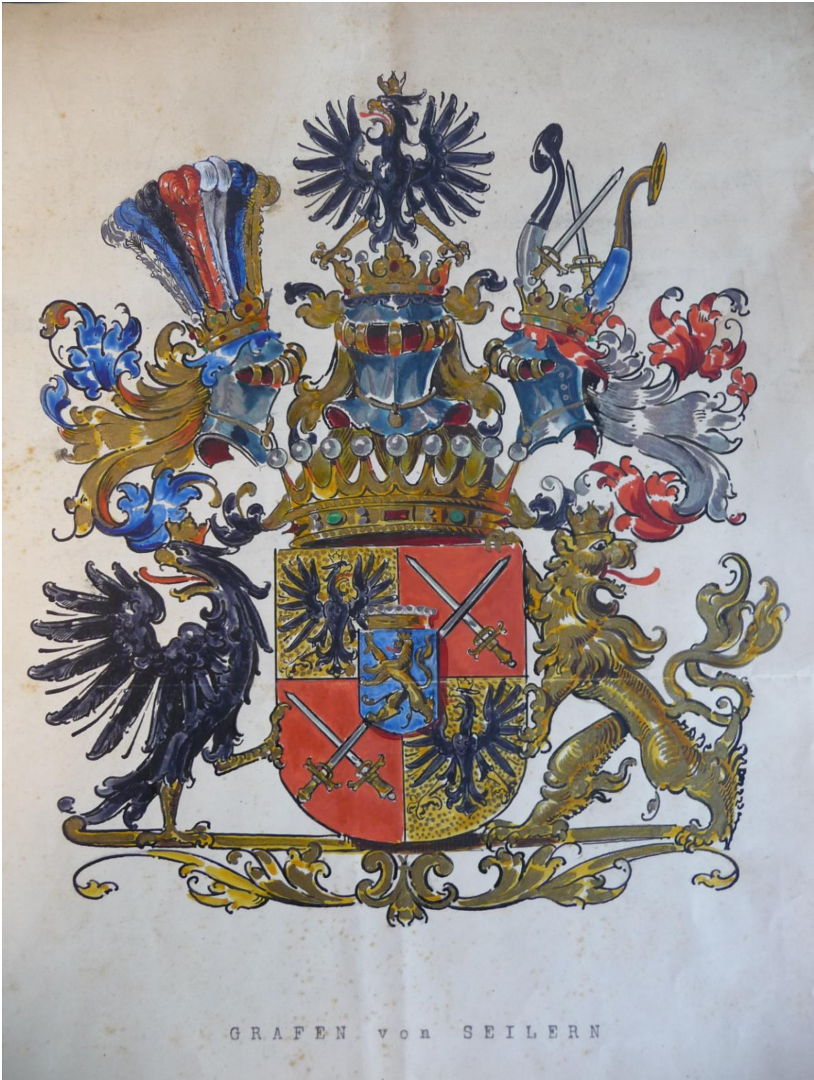
2. Rodinný erb hrabat Seilern - Aspangů