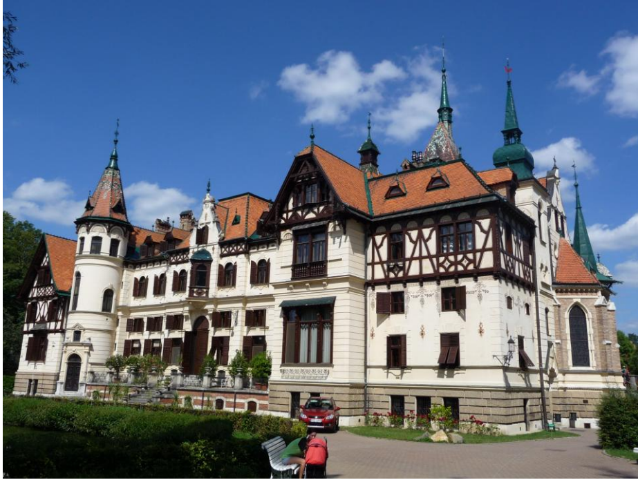
16. a 17. Fotografie zámku Lešná 2009.