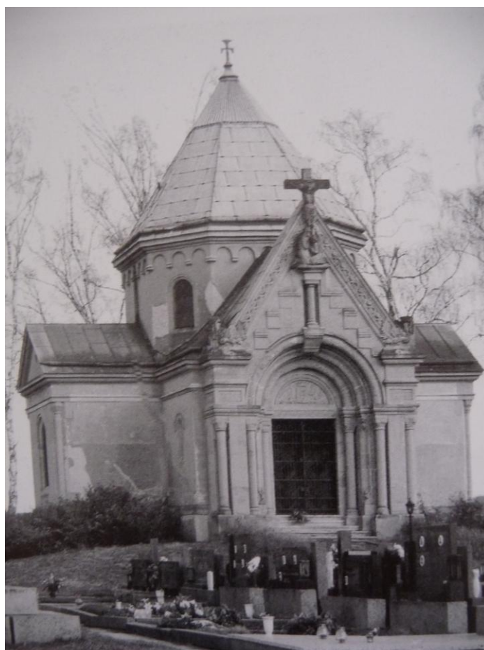
26. Rodinná hrobka hrabat Seilern – Aspangů na hřbitově ve Štípe.