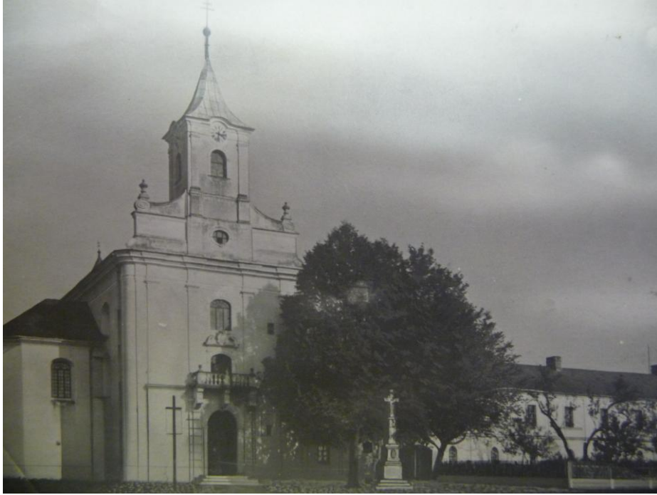
18. a 19. Kostel ve Štípě.