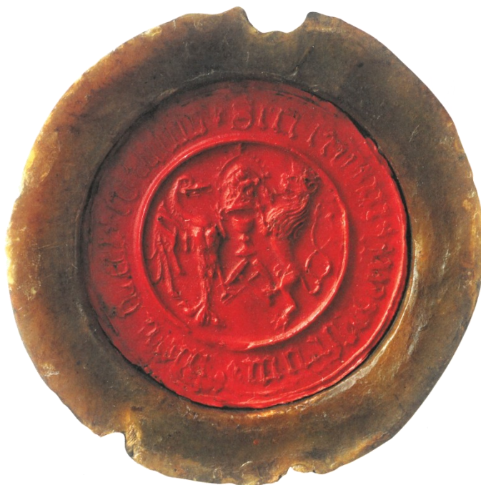
Obrázek 3 – Utravvistická pečeť obsahující pod císařskou korunou kalich, pod nímž figurují havířská kladívka. Pečeť byla přivěšena k listině z roku 1542 dochované v čáslavském městském archivu. Vyobrazení převzato z práce K. HORNÍČKOVÁ – M. ŠRONĚK (edd.), Umění , s. 200.

po dvojím vypálení Kutné Hory v roce 1424. 462 I v nich je totiž akcentována úzká vazba k panovníkovi. 463 Vznik veršů bych sice – na úkor datování do roku 1430 – spojoval spíše až s definitivním přijetím císaře Zikmunda na český trůn, tak jako tak ovšem odhalují identifikační kontinuitu mezi někdejšími a novými (pohusitskými) městskými elitami.