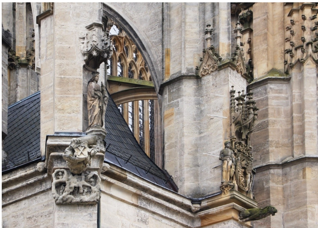
Obrázek 4 – Výzdoba severního vstupu do chrámu sv. Barbory.

výzdoby v podobě městského erbu, jež třímá v rukách dvojice havířů v perkytlích. Nad znakem pak v původním řešení patrně figuroval Kristus žehnající hostii a kalich doprovázený symboly evangelistů. 509