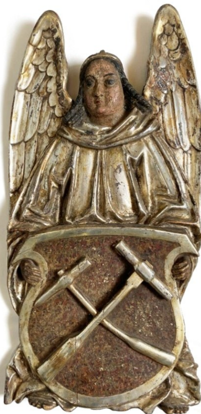
Obrázek 8 – Kaňkovský znak z roku 1545 ze sbírek Českého muzea stříbra v Kutné Hoře (př. č. 432/79).

listu z dílny Valentina Noha. 726 Týž vzhled (ale bez tinktur) má i znak figurující na vstupu do chrámu sv. Barbory, kde se však kladívka nacházejí na štítu jiného tvaru. Znak asociace byl tudíž minimalistický, přičemž odkazoval ke klíčovým pracovním nástrojům havířů, což bylo v prostředí podobných korporací obvyklé.