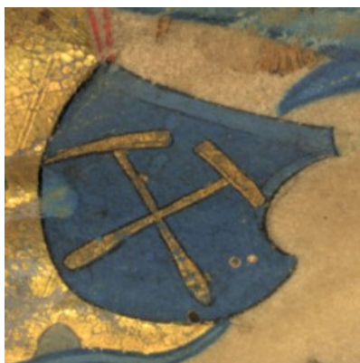
Obrázek 9 – Haviřský erb. Vyobrazení z titulního listu Kutnohorského kancionálu.