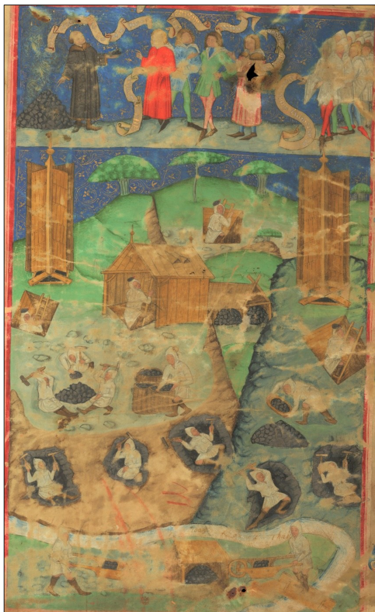
Obrázek 13 – Výřez z titulního listu z dílny Valentina Noha (NK ČR, sign. XXIII A 2, fol. 1r).

Richtera, podle něhož celá kompozice zapadá do starší tradice zobrazení donátorů. 739 Práce tu odkazuje ke zdroji financování daru, současně si pro ni však zadavatelé pokouší vyprosit boží přízeň. 740 S tím souvisí otázka, k jakému účelu vlastně (nepochybně nákladná) kniha sloužila. Z hlediska reprezentace pořádku nemohl mít rukopis, chovaný patrně ve svatobarborské kapli, patriční komunikací dosah. Jeho poslání se tedy zřejmě obracelo dovnitř společenství a jeho smyslem bylo primárně utužení skupinové identity. 741