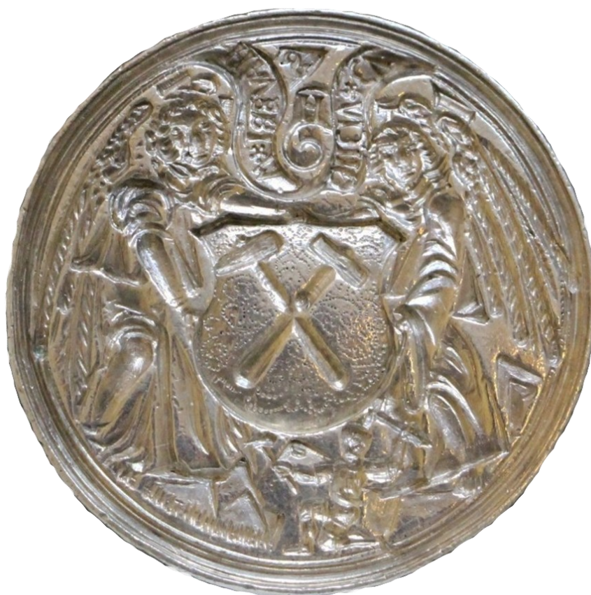
Obrázek 7 – Stříbrné pečetidlo vyryté roku 1514.