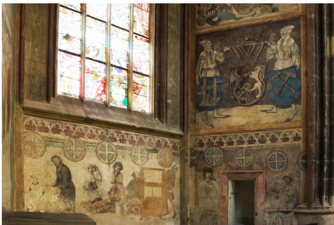
Obrázek 5 – Výmalba hašplířské kaple s ústředním pracovním výjevem, dvojicí „úředníků“ a městským znakem.

perkyltích identifikovanými – aby nedošlo k omylu – erby, jež třímají v druhé ruce. Jsou jimi znak havířské a hašplířské korporace. 520 Vzhledem k tomu, že se jedná o jediné zobrazení, na němž figuruje jako štítonoš městského erbu hašplíř, je zjevné, že se asociace zaštitila autoritou havířů, díky níž se mohla v této čestné roli prezentovat. Obě uskupení tak na prestižním místě manifestovala svůj význam v rámci kutnohorské society. Hašplířům bylo umožněno podílet se na komunikační strategii, již dlouhodobě rozvíjeli havíři, jimž zase zpodobnění znaku dávalo možnost proniknout se svou reprezentací bezplatně do chrámového chóru.