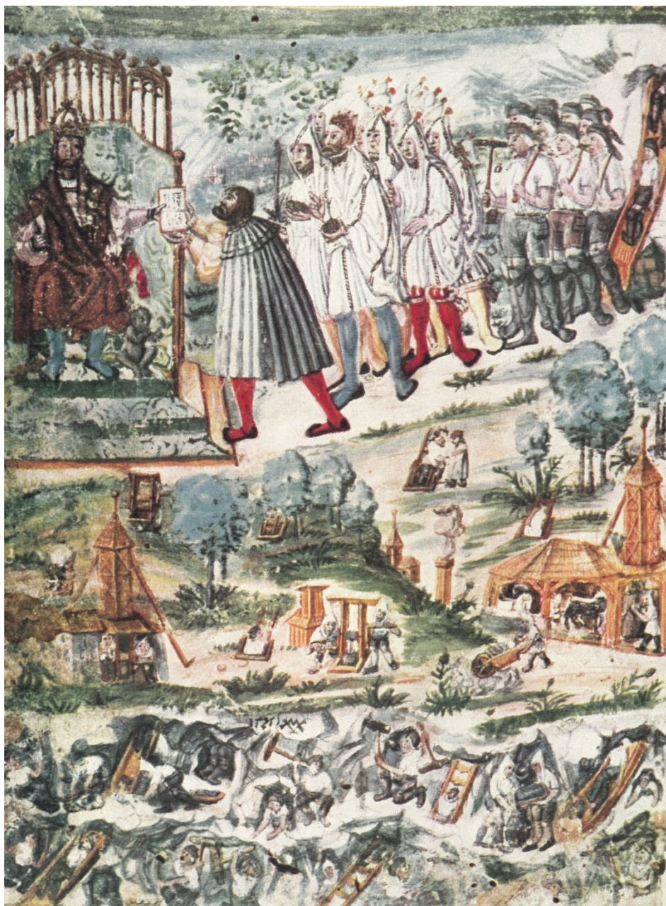
Obrázek 16 – Vyobrazení z rukopisu horních práv uloženého dnes v Knihovně Národního muzea pod sign. I F 34 (fol. 1r).

Poslední doklad oné znakové role havířů pochází z rukopisu horních práv, který vznikl kolem roku 1525 a později se našel ve vlastnictví Dačických z Heslova. 747 Manuskript totiž