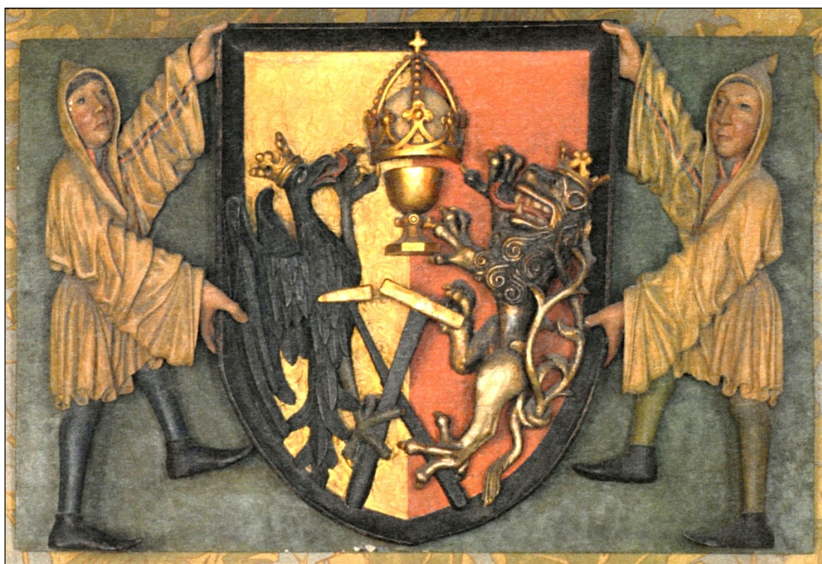
Obrázek 11 – Kolorovaný městský erb dochovaný ve Vlašském dvoře a datovaný do období okolo roku 1490. Převzato ze stejné práce jako v předchozím případě (s. 32).

Z hlediska časové souslednosti přitom výskyt havířů v symbolicky významné pozici nositelů znaku, spolu s poskytnutím prostoru pro reprezentaci pořádku nad severním vstupem do svatobarborského chrámu, připadá na dobu nedlouho po uzavření oboustranně přijatelného kompromisu mezi korporací a městskou radou, potažmo celou obcí. Tato okolnost prozrazuje, že mocenské postavení havířů uvnitř kutnohorské society tehdy bylo stejně akceptováno, jako navenek akcentováno. Jinak řečeno, pospolitost uznala roli havířů v kontextu jejího vnitřního fungování a současně se o ni městští intelektuálové pokusili opřít vlastní mocenský nárok na zemské úrovni. Aluze na pracovní morálku, z níž vyrůstá blahobyt Kutné Hory – předpoklad prosperity celé země – měla rozšířit všeobecně přijaté klišé o zemském klenotu .