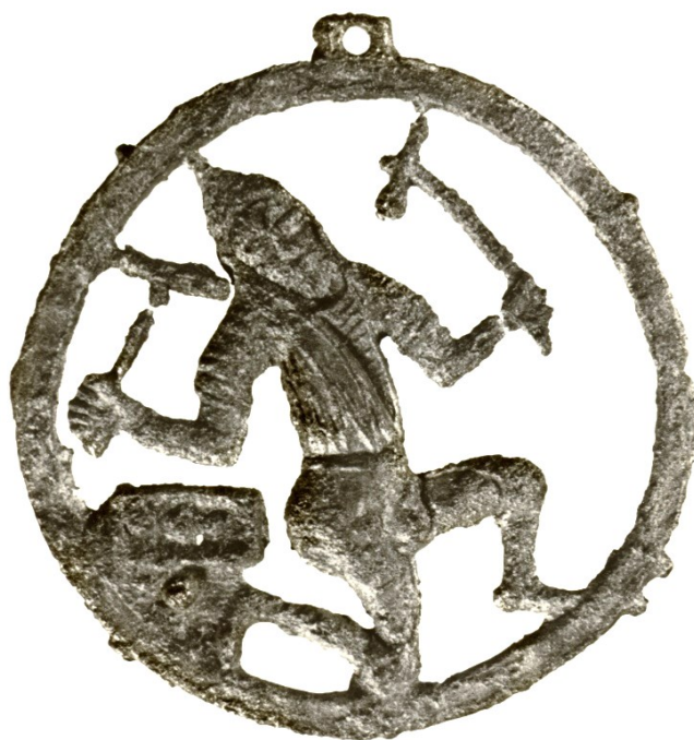
Obrázek 12 – Odznak s pracujícím havířem ze sbírek Českého muzea stříbra v Kutné Hoře (př. č. 24/81).

místa. Odznak byl nesporně vyroben přímo v Kutné Hoře, přičemž slitina, z níž je zhotoven, sestává z přibližně 20% olova a 80% cínu. Stáří památky odhadovala Dagmar Stará na první polovinu 16. století. 732 Tomáš Velímský pak navrhol volnější datování do 14.–16. věku. 733 V kontextu předcházejících řádek bych si ze dvou důvodů dovolil podpořit první z uvedených soudů. Vytvoření odznaku před posledním dvacetiletím 15. století totiž podle mého vylučuje výše popsané pozvolné prosazení havířů do role městského emblému. Druhým argumentem datování památky do přelomu 15. a 16. století pak je ikonografie motivu, která po mém soudu respektuje zobrazení pracujících havířů v kutnohorských modlitebních knihách. Pozice rukou třímajících kladívka se podobá několika postavám titulního listu Valentina Noha. Přikleknutí havíře z odznaku zase evokuje postavení dvou figur Kutnohorské iluminace. Nápadná je také podoba havíře s postavou kutající postavy zobrazené na pečeti pořádku vyryté roku 1514.