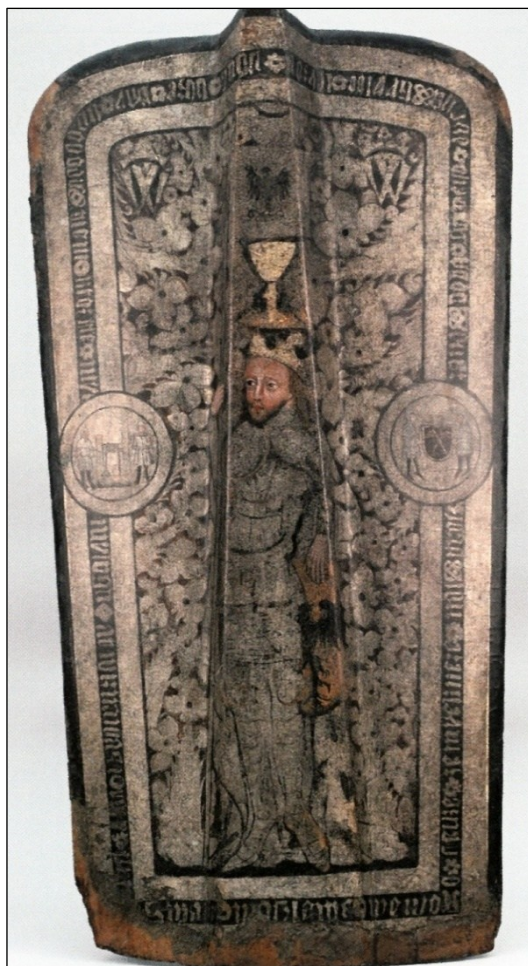
Obrázek 15 – Pavéza s vyobrazením sv. Václava je dnes součástí sbírek Národního muzea. Vyobrazení převzato z práce Evženie Šnajdrové (citováno v pozn. č. 745).

Účel a použití a tím i charakter a početnost publika, které mohlo recipovat výzdobu na reprezentační pavéze, je nejasný. Malovaný štít, v jehož poli se nachází sv. Václav, nad nímž figuruje zlatý kalich, doprovázený po stranách postavami dvou hašplířů pracujících u rumpálu a dvojicí havířů nesoucích znak asociace, však skutečně objednal jednotný havířský cech, 744 což bohužel příliš neupřesňuje dataci jeho vzniku, o němž panují rozdílné představy. 745 Je sice pravděpodobné, že k pořízení pavézy došlo před rokem 1489, kdy se hašplíři osamostatnili, to však stávající poznatky nerozšiřuje. Zobrazení sv. Václava zato představuje další kamínek do pestré mozaiky projevů úcty, jimž se zemský patron uvnitř kutnohorské společnosti konce 15. století zjevně těšil. 746