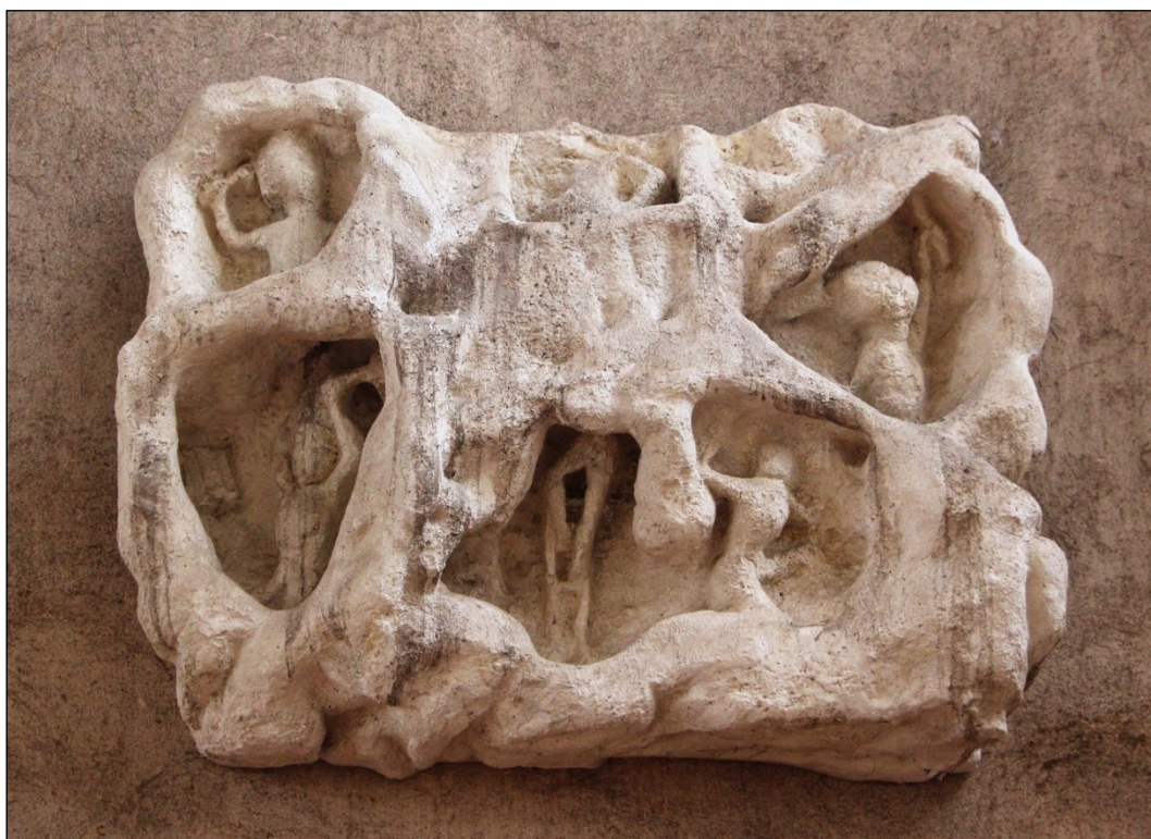
Obrázek 14 – Kopie reliéfu havířů kutajících v podzemí vystavená v chrámu sv. Barbory.

Exkluzivní prostor, jenž byl asociaci pro její reprezentaci poskytnut, přitom s ohledem na kontext celku výzdoby severního vstupu prozrazuje, že s jejím umístěním musela souhlasit celá obec jakožto stavitel chrámu. Jedná se tak spíše o sdílené poselství, v jehož rámci připadá zobrazení práce významné místo. 743 K pracovnímu étosu se tu tudíž vztahuje celá komunita, jež tak současně odhaluje zdroj svého bohatství i úctu, jíž se práce těší, a pro niž je po světicích vyprošována ochrana.