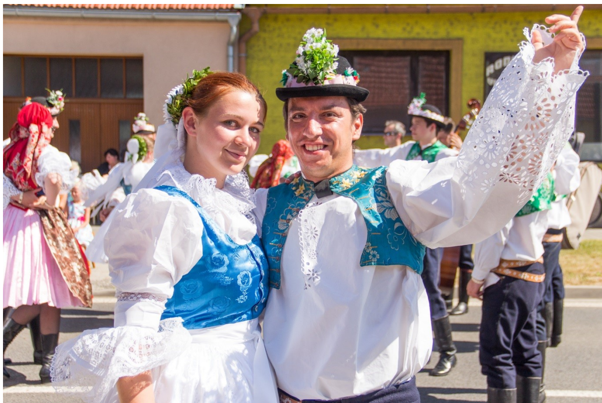
1. Slavnostní strážnický kroj