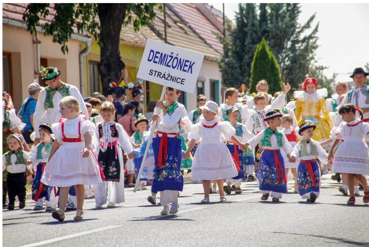
2. Dětský soubor Demižónek