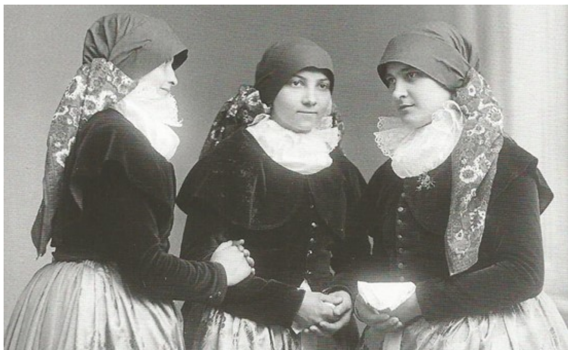
4. Děvčata v kamizole