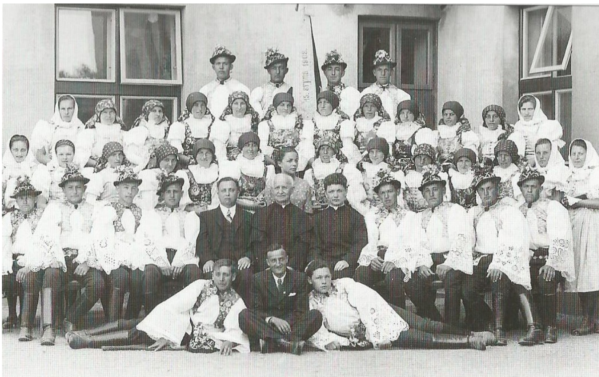
3. Omladina 1936