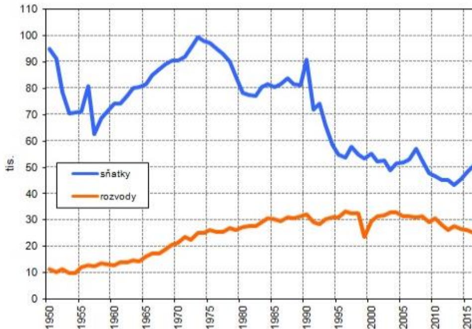
Graf č. 1: Sňatky a rozvody v letech 1950-2016

Zdroj: Sňatky a rozvody 1950-2016. Český statistický úřad. [online]. Dostupné z: https://www.czso.cz/csu/czso/snatky-a-rozvody-1950-2016 [26.6.2017]