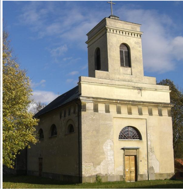
7.15. Třebovice - Kostel sv. Jiří