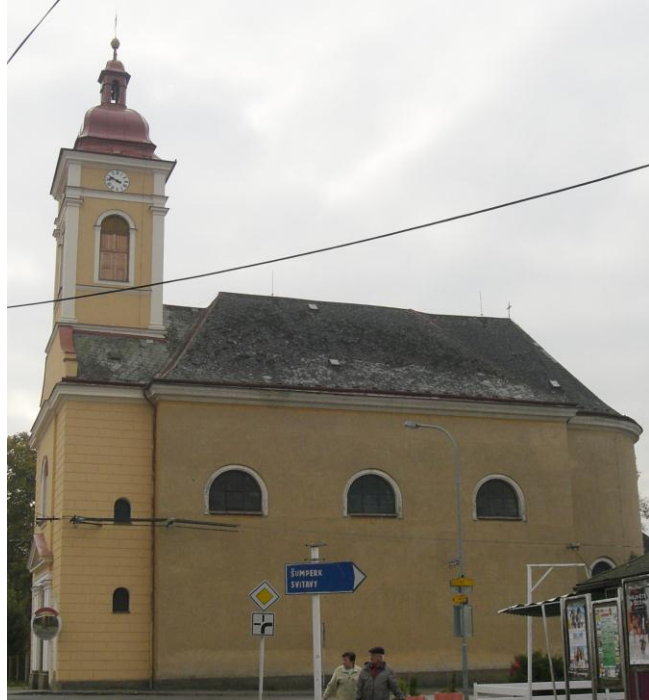
7.8. Lanškroun - Kostel sv. Máří Magdalény