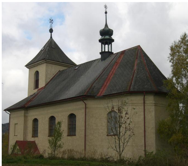
7.11. Horní Dobrouč - Kostel sv. Jana Křtitele