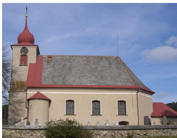
7.6. Valteřice - Kostel Povýšení sv. Kříže