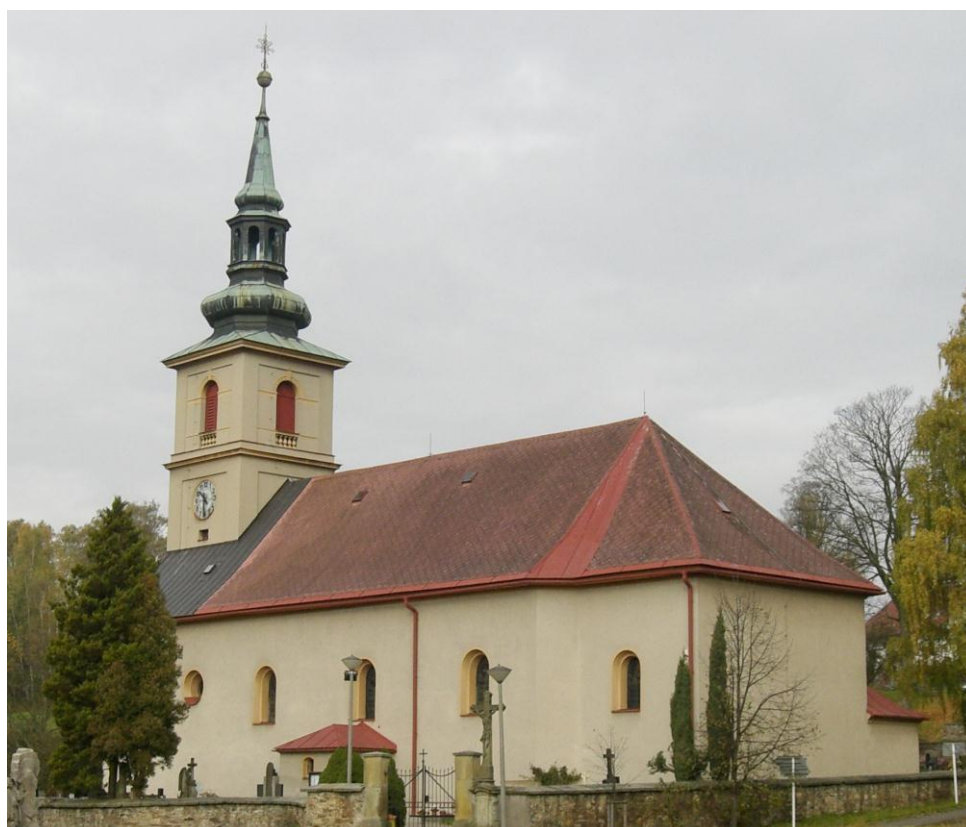
7.4. Bystřec - Kostel sv. Jakuba Většího