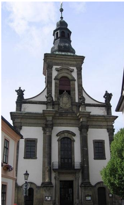
7.1. Ústí nad Orlicí - Děkaný kostel Nanebevzetí Panny Marie