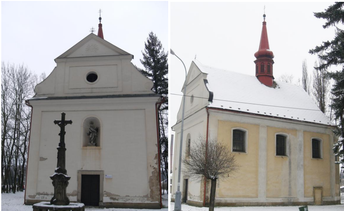
7.17. Ústí nad Orlicí - Hlávátý - Kaple sv. Anny