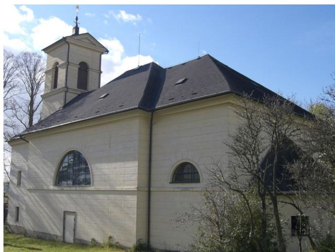
7.12. Knapovec - Kostel sv. Petra a Pavla