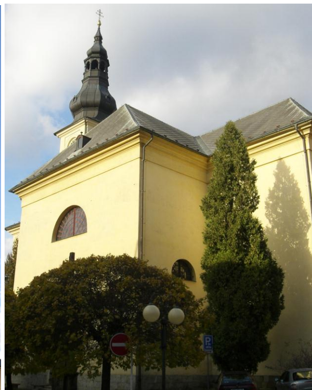
7.14. Česká Třebová - Děkanský kostel sv. Jakuba Většího