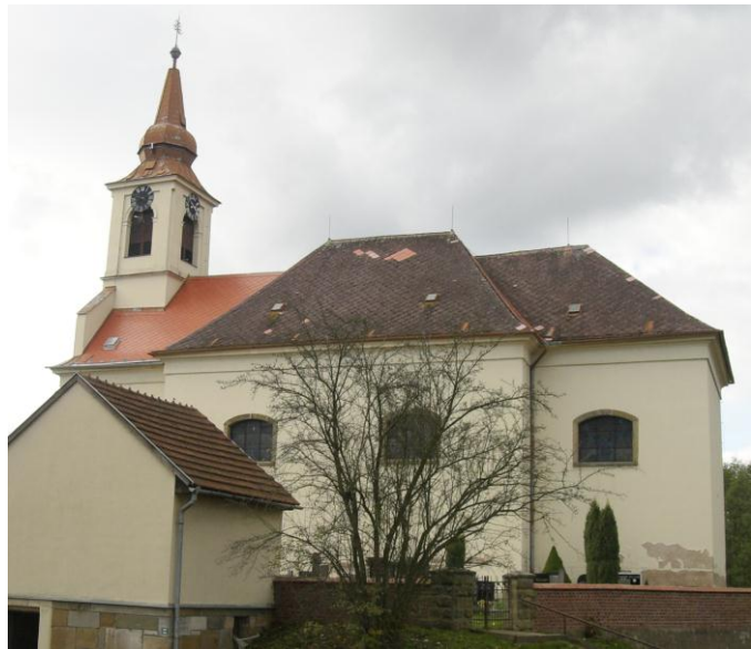
7.9. Rudoltice - Kostel sv. Petra a Pavla