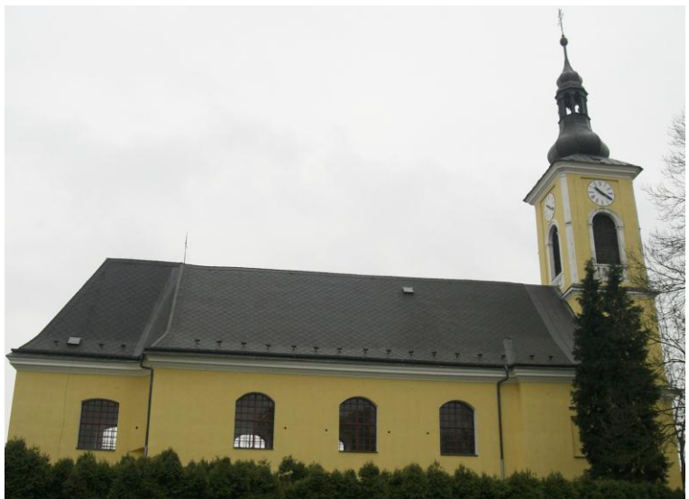
7.10. Ostrov - Kostel sv. Mikuláše