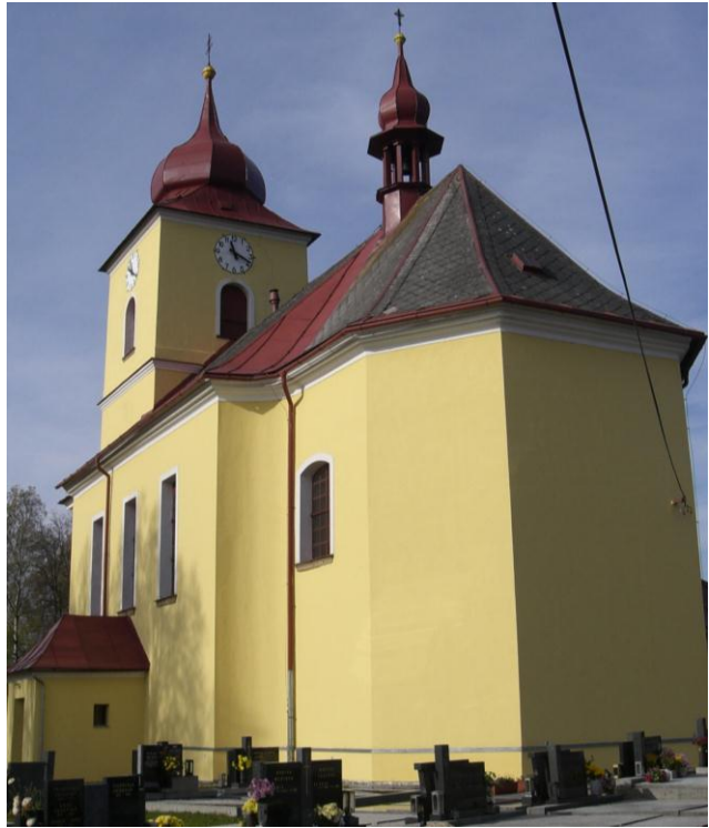
7.7. Výprachtice - Kostel Proměnění Páně