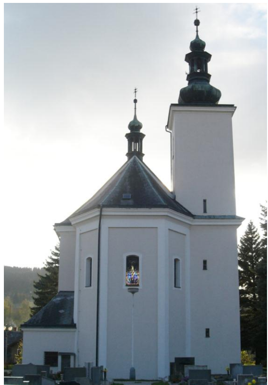
7.16. Řetová - Kostel sv. Máří Magdalény