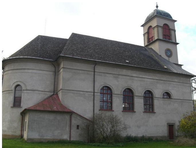
7.3. Dolní Dobrouč - Kostel sv. Mikuláše