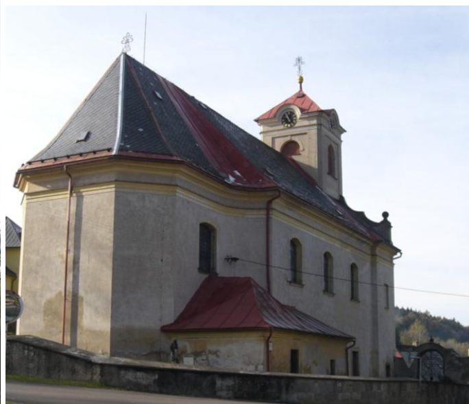
7.5. Čenkovice - Kostel sv.Vavřince