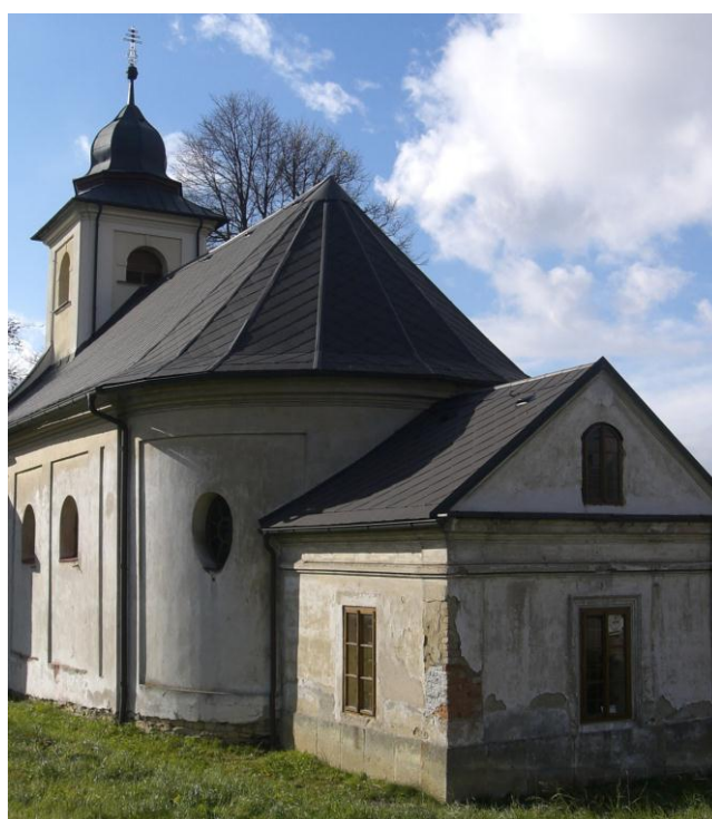
7.13. Skuhrov - Kostel sv. Jana Nepomuckého