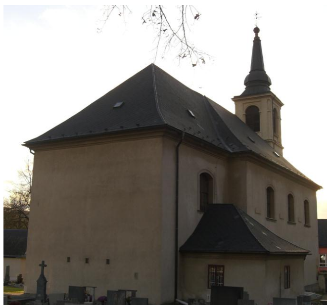
7.2. Dolní Libchavy - Kostel sv. Mikuláše