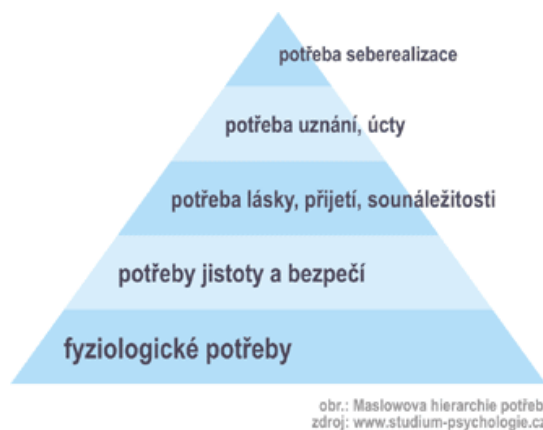
Obrázek 1 - Maslowova hierarchie potřeb 111

„Mezi nejznámější a nejcitovanější teorie motivace jistě patří Maslowova hierarchie potřeb . Jejím autorem je americký psycholog Abraham Maslow (*1908 - †1970), který definoval 5 základních lidských potřeb tvořících podle důležitosti pomyslnou pyramidu. Její spodní část představují potřeby základní, s nejvyšší prioritou. Teprve po jejich naplnění usiluje člověk o uspokojení dalších potřeb výše v hierarchii pyramidy.“ 109 Na Maslowově pyramidě 110 je vidět určitá hierarchie. Při zhlédnutí tohoto obrázku jsem zjistila, že dvě matky mohou mít motivaci ke studiu rozdílně vysoko. Jedna může studovat kvůli potřebě jistoty a bezpečí, aby si zajistila stabilní pracovní pozici a tím získala stálý finanční příjem, tudíž nějakou jistotu. Kdežto druhá může studovat kvůli potřebě uznání, anebo dokonce kvůli potřebě seberealizace, která se nachází až na samotném vrcholu pyramidy. V mém výzkumu se pokusím motivaci jednotlivých informantek zařadit na příslušné místo v hierarchii této pyramidy.