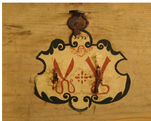
OBR 33 B – 2.2.