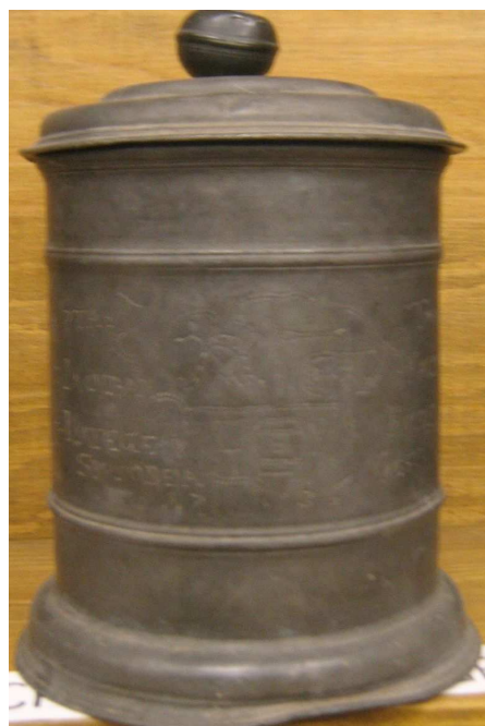
OBR 44 A