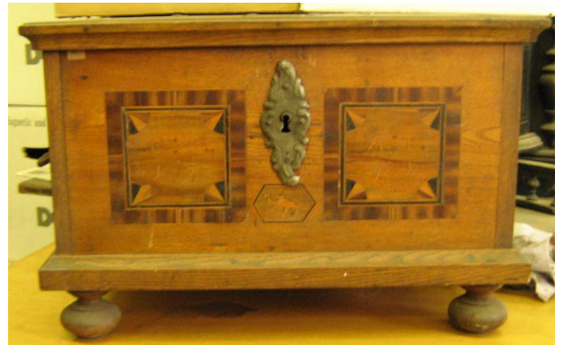
OBR 36 B -2.5.