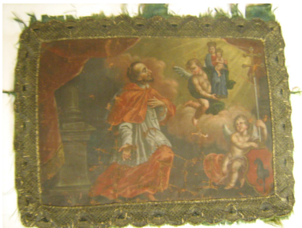
OBR 37 A - ARNOŠT Z PARDUBIC