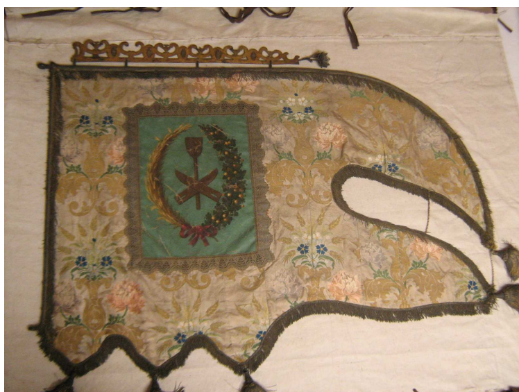
OBR 41 A - ZNAK SLADOVNÍKŮ