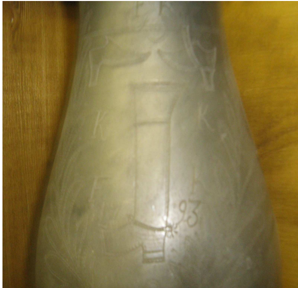
OBR 45 A