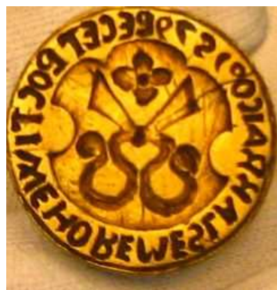
OBR 6- 1.3.2.