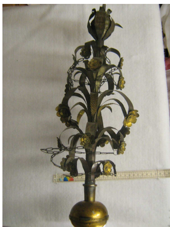
OBR 41 C - HLAVICE ŽERDI