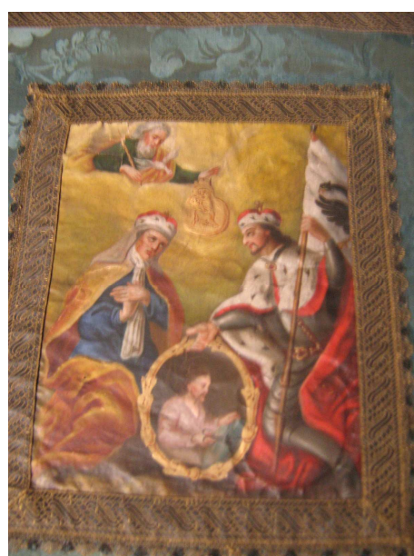
OBR 38 B - SV. LUDMILA A SV. VÁCLAV