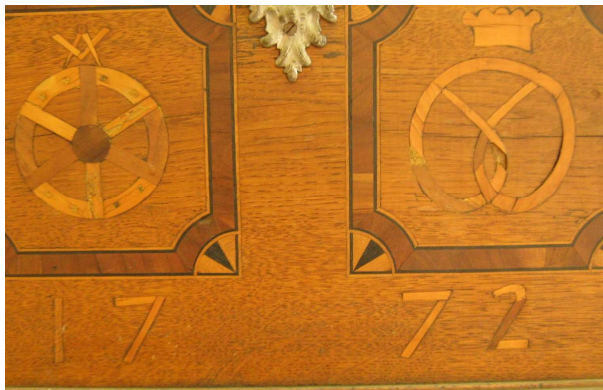
OBR 35 B -2.5.