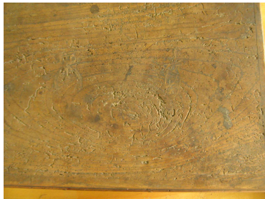
OBR 34 B – 2.3. - víko