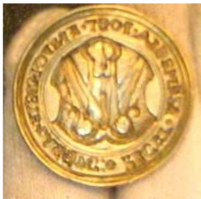
OBR 1 -1.1.1.