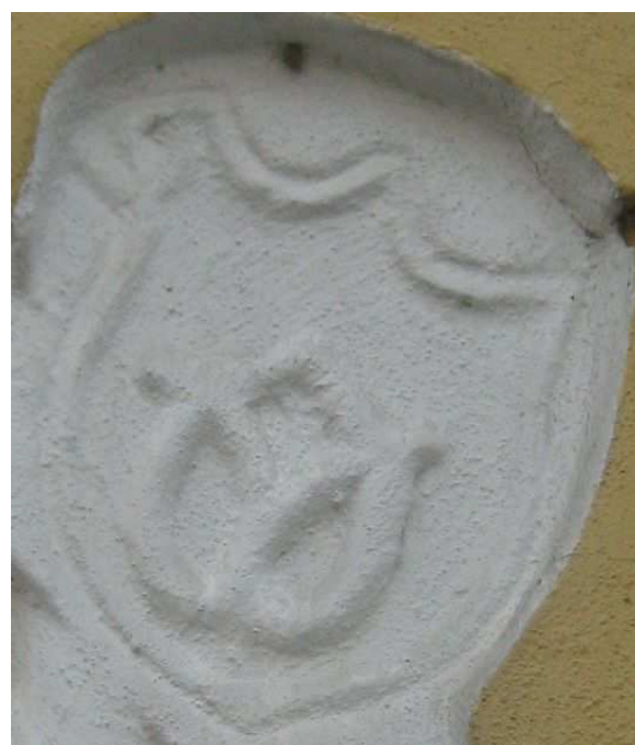
OBR 50 C