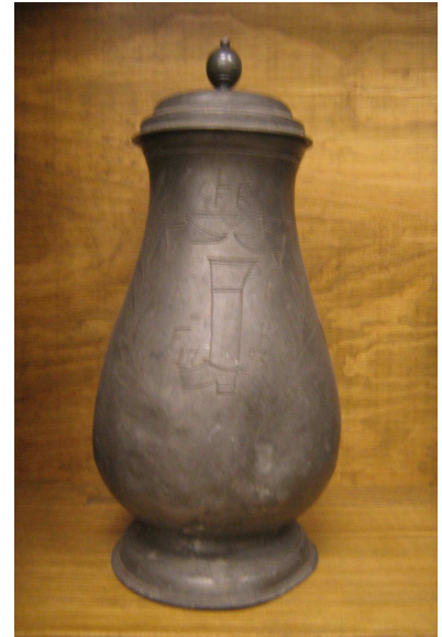
OBR 45 B