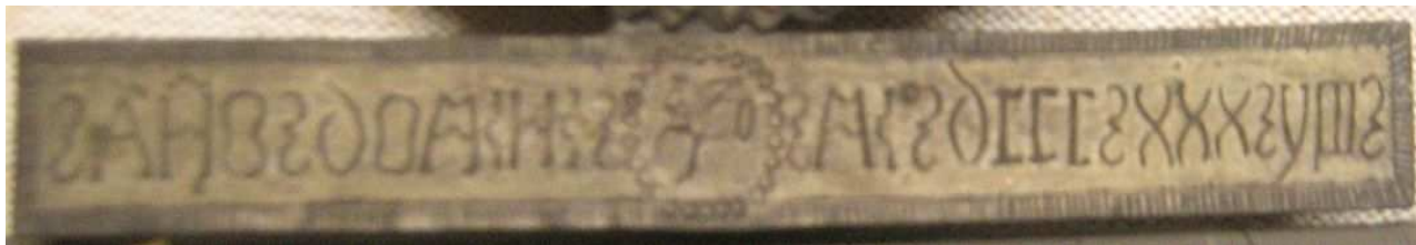
OBR 40 D