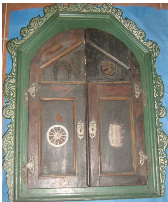
OBR 46 B- 5.1