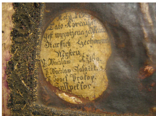
OBR 42 C - DETAIL NÁPISU