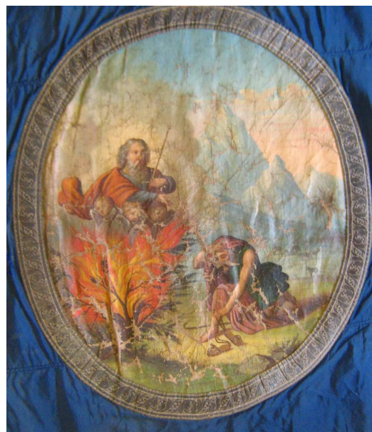
OBR 39 B - MOJŽÍŠ A HOŘÍCÍ KEŘ