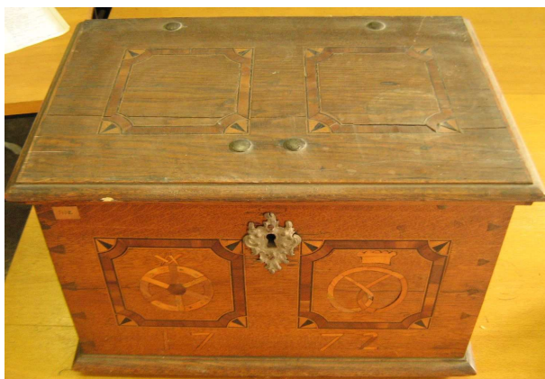
OBR 35 A – 2.4.