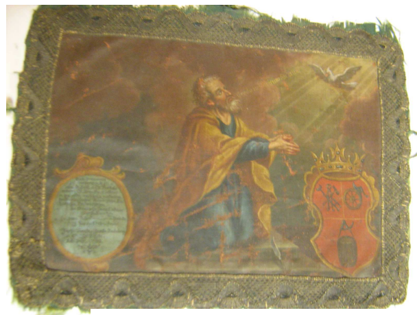
OBR 37 B - SVATÝ BARTOLOMĚJ -