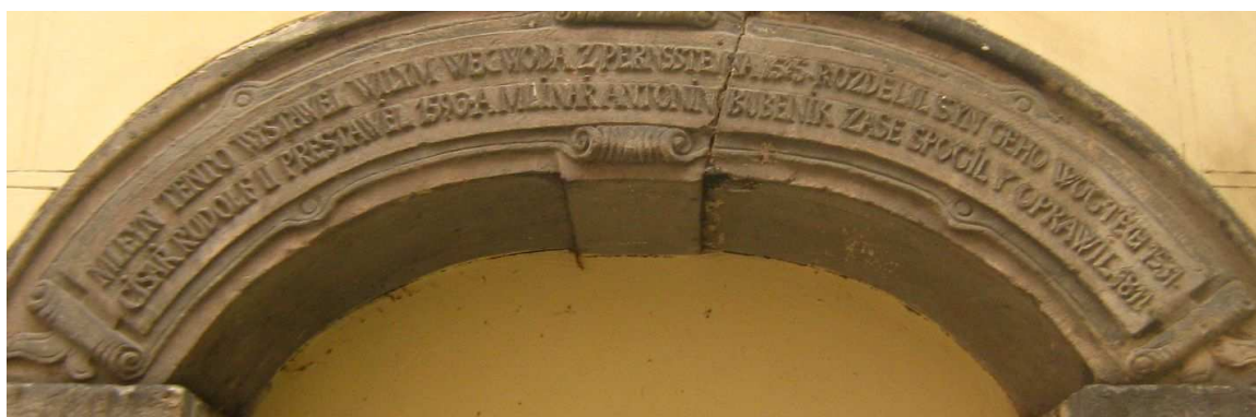
OBR 48 C