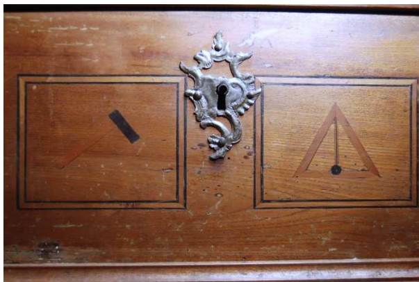
OBR 32 A – 2.1.