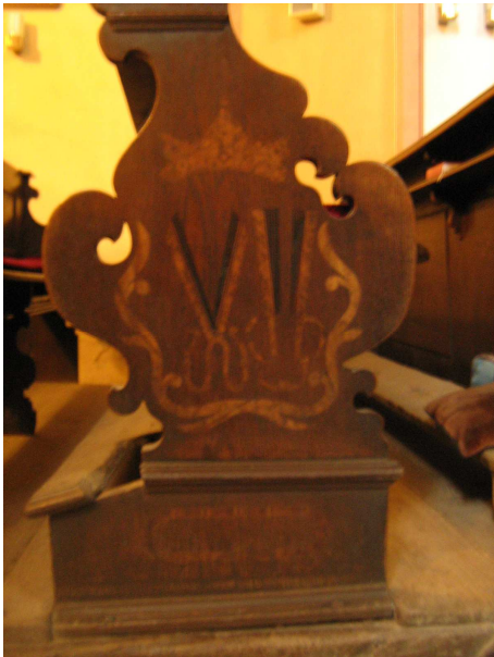
OBR 47 C