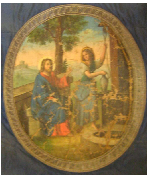
OBR 39 A - ŽENA REBEKA NABÍRÁ VODU