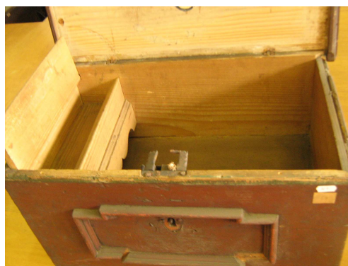
OBR 33 D -2.2.