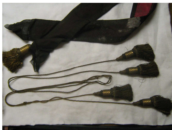
OBR 42 E - ŠERPA POŠITÁ ČERNOU (POHŘEBNÍ) LÁTKOU