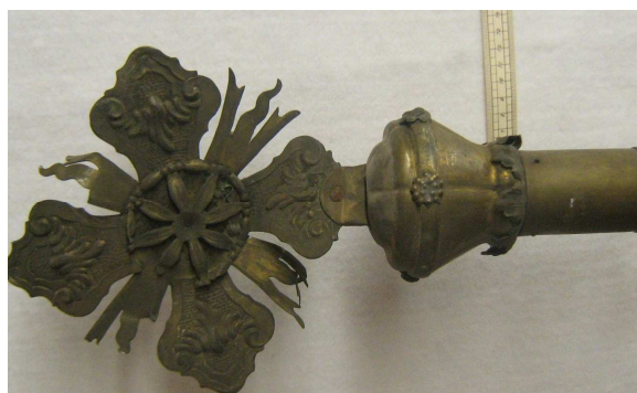
OBR 40 F