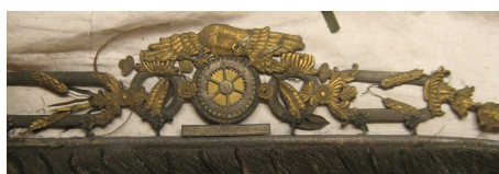
OBR 40 C - DETAIL ZDOBNÍ