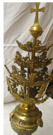
OBR 38 H - OZDOBNÁ RŮŽICE