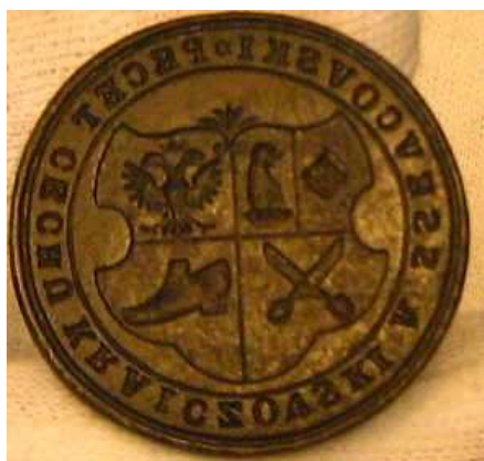
OBR 5- 1.3.1.