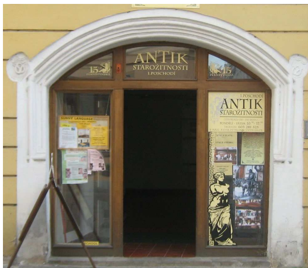
OBR 50 A