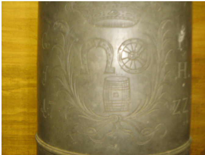
OBR 43 A