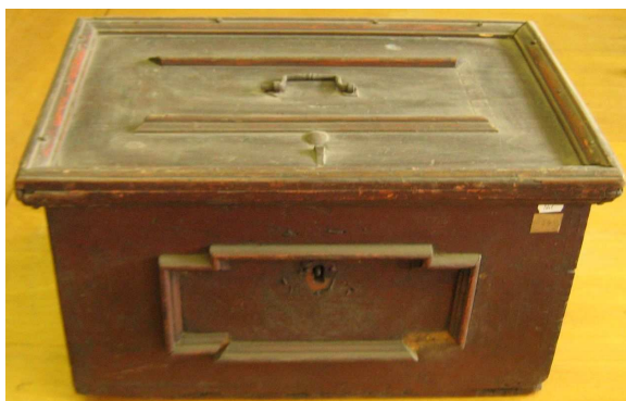
OBR 33 A -2.2.