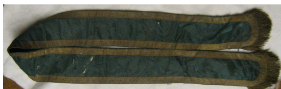
OBR 38 F - ŠERPA