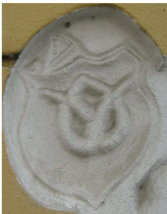
OBR 50 B