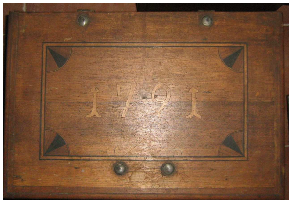
OBR 32 – 2.1.