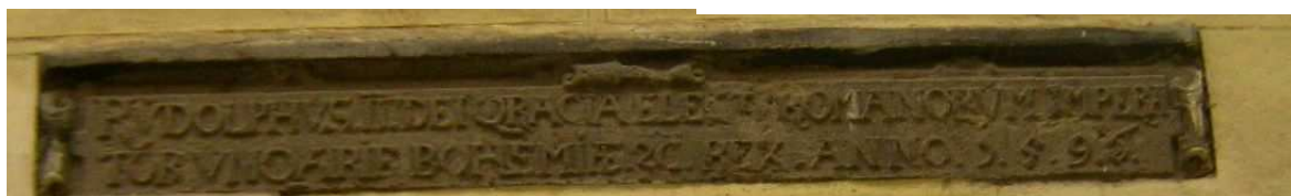
OBR 48 B