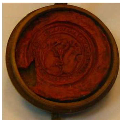
OBR 23 – 1.5.10.