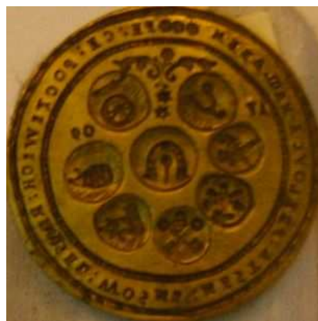
OBR 26 – 1.6.2.