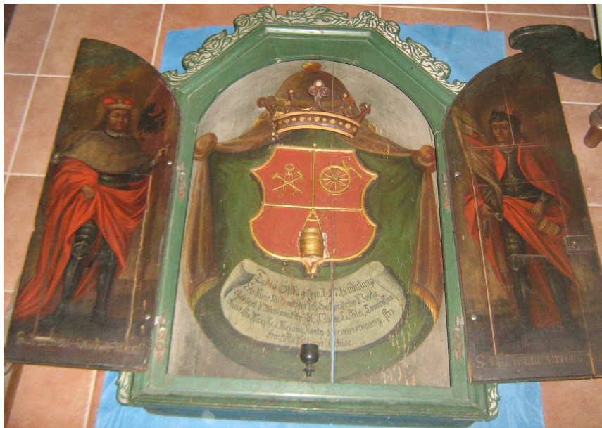
OBR 46 A .5.1