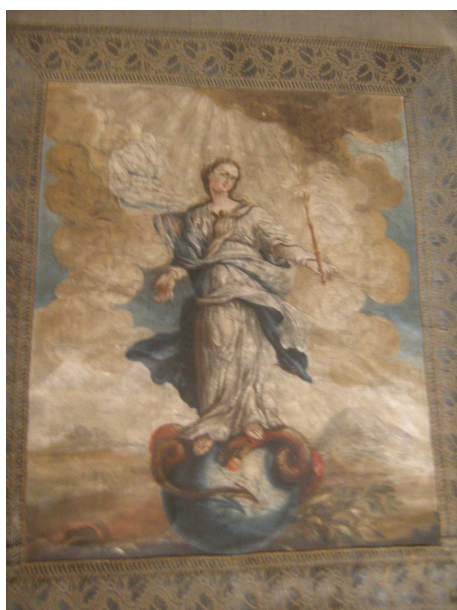
OBR 40 A - MARIA IMACULATA