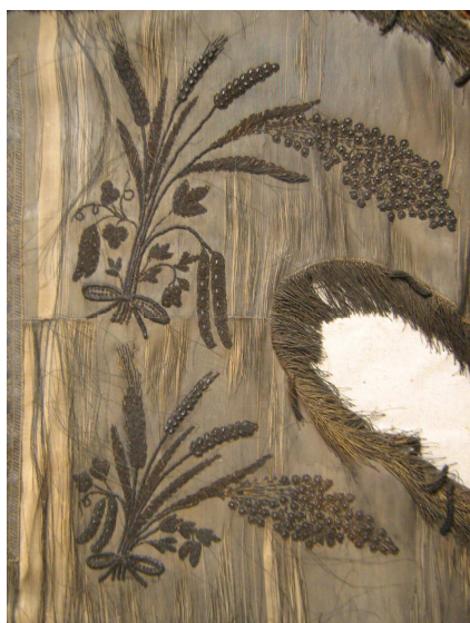
OBR 40 E