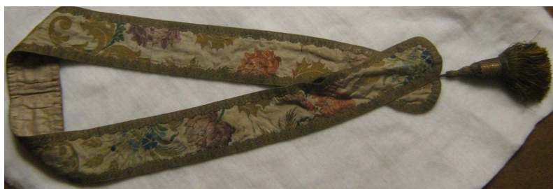
OBR 41 D - ŠERPA