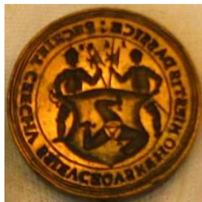
OBR 2- 1.1.2.