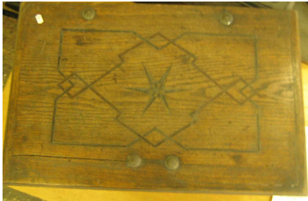
OBR 36 A -2.5.