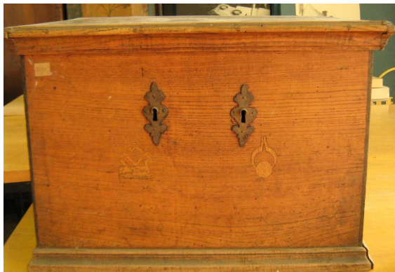
OBR 34 A - 2.3.