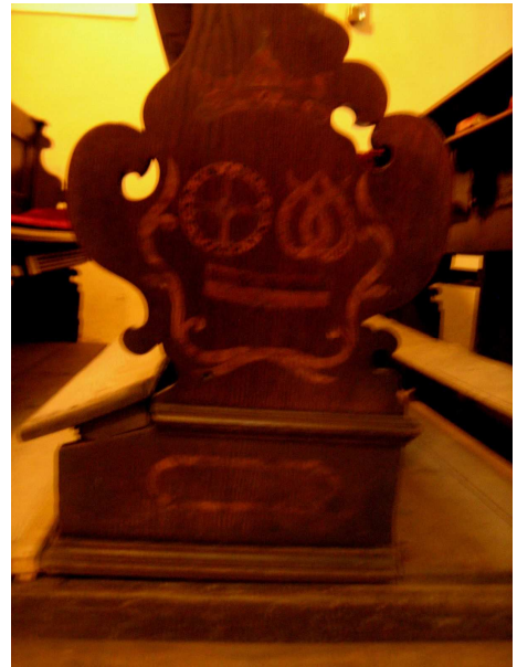
OBR 47 D