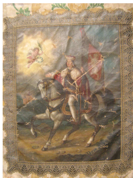
OBR 41 B - SV VÁCLAV