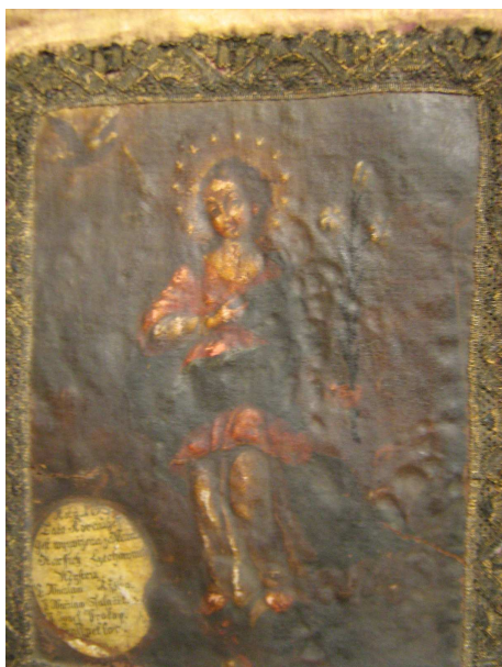
OBR 42 A - PANNA MARIA SEDMIBOLESTNÁ