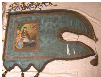
OBR 38 C - CELKOVÝ POHLED NA PRAPOR