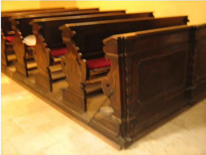
OBR 47 A