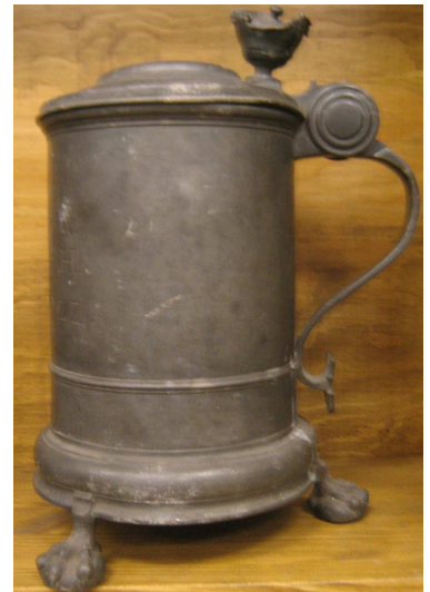
OBR 43 B