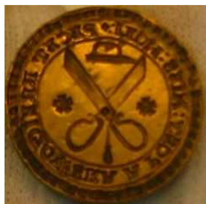
OBR 4- 1.2.2.