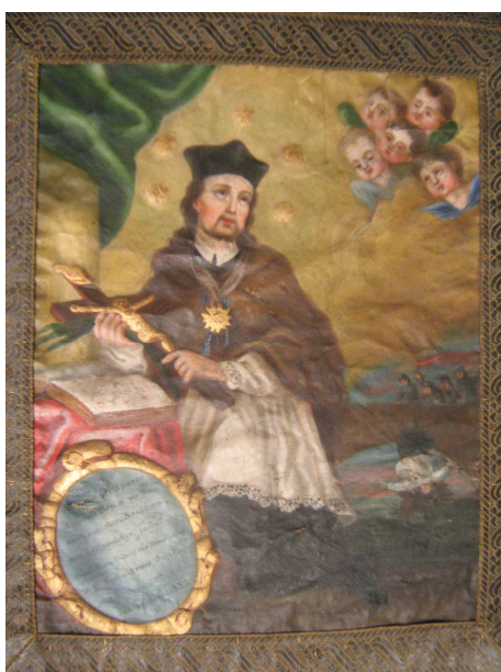
OBR 38 A - SV. JAN NEPOMUCKÝ