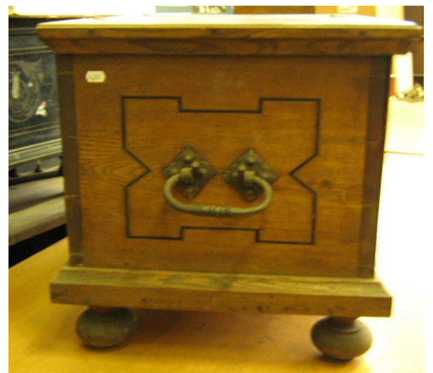
OBR 36 D -2.5.