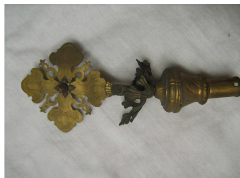
OBR 42 D - OZDOBNÁ HLAVICE ŽERDI