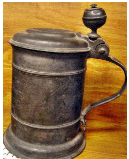
OBR 44 B