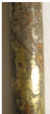
OBR 38 G - ŽERŤ