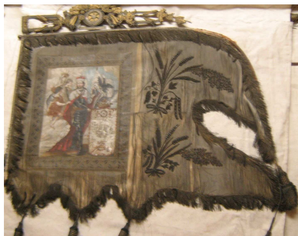
OBR 40 B - SV VÁCLAV