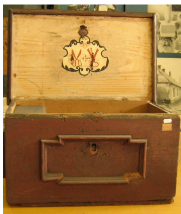
OBR 33 C - 2.2.