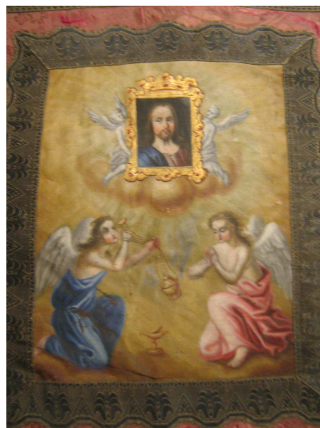
OBR 42B - SV KRYŠPÍN, DVA ANDĚLÉ, SCHRÁNKA NA HOSTIE A KADIDELNICE