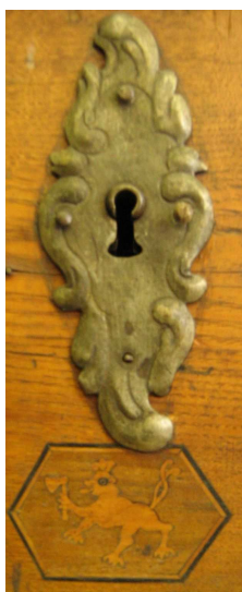
OBR 36 C