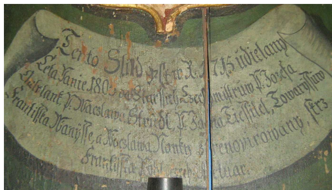
OBR 46 C- 5.1