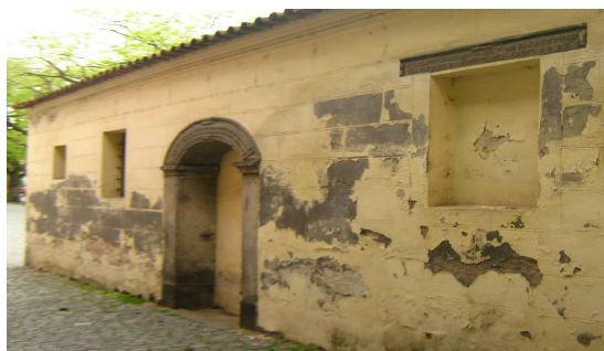
OBR 48 A