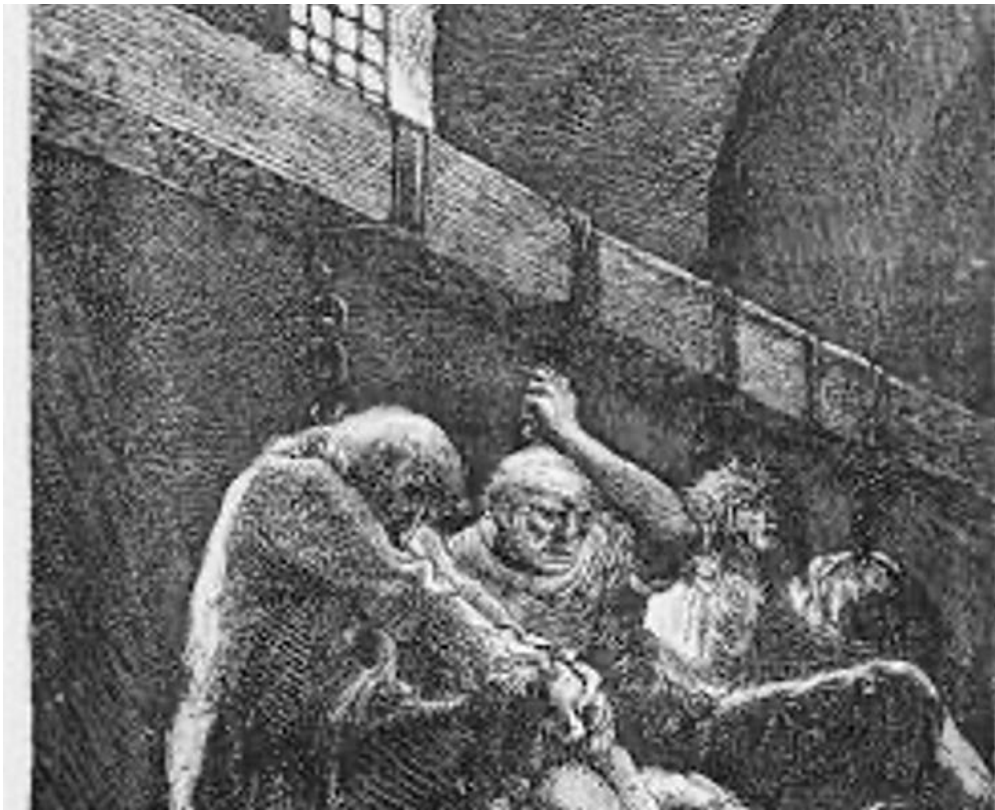
Obr. č. 1: Gustav Doré, Jean Valjean v pařížské kanalizaci.

Dobové rytiny a ilustrace z 18. a 19. století často zobrazovaly hrůzné scény přesunu kostí a uspořádání lebek v podzemí, čímž upevňovaly jejich morbidní a děsivý charakter. Tyto vizuály se staly součástí širšího gotického a romantického estetického proudu, který se zaměřoval na temné, tajemné a hrůzostrašné. Příkladem může být ilustrace Gustava Doréhoka Hugovým Bídníkům 129 , které ačkoliv zobrazují kanalizaci, evokují stejnou klaustrofobii a pocit podzemního pekla, jaký byl spojován s katakombami. Dorého detailní a dramatické rytiny, jako je scéna Valjeana v kanále, vizuálně ztělesňují Hugovy popisy temnoty, špíny a zoufalství, čímž vytvářejí silné vizuální paralely s obrazy kostnic.