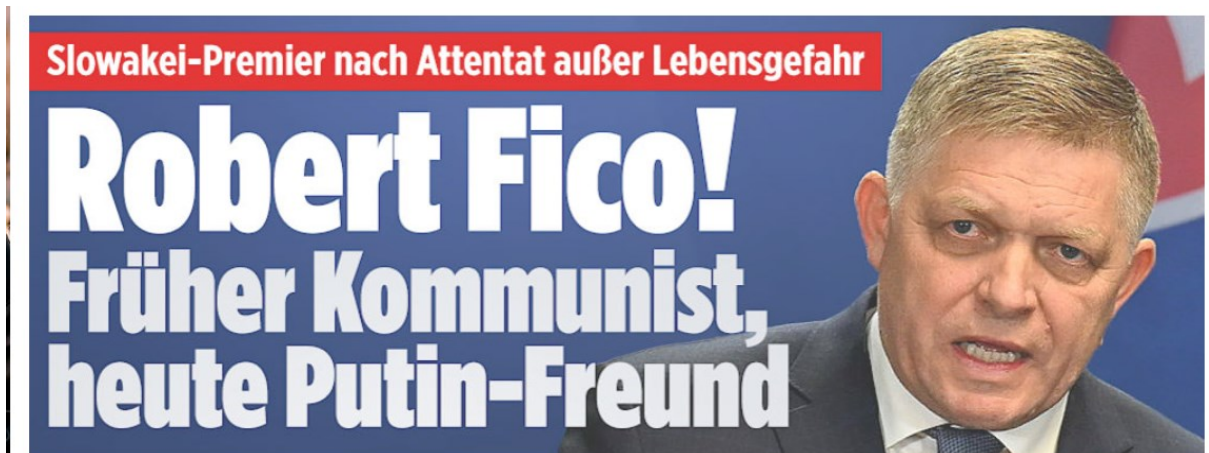
Abbildung 17, Bild Zeitung 16.05.2024 68

Nach dem Attentat an den slowakischen Premier Robert Fico wurden von „Bild“ nur negative Nachrichten geschrieben. Im Artikel wurde erwähnt, dass Fico Gegner von Angela Merkel, der ehemaligen Bundeskanzlerin Deutschlands war. Außer diesem Fakt wurde im Artikel seine politische Karriere beschrieben. In Blesk wurde aber berichtet, wie das Attentat geschehen ist, wo die Leibwache einen Fehler gemacht hat. 69