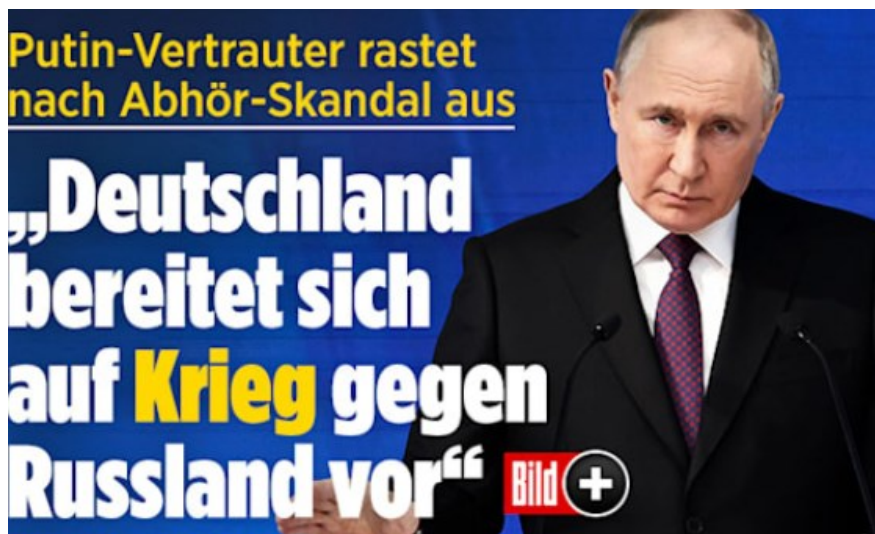
Abbildung 6. Bildzeitung 03.03.2024 57

Auf diesem Foto erscheinen sich emotiver Wortschatz – Krieg – ruft eine negative Emotion hervor, wie auch Abhör-Skandal . Diese Wörter werden gelb geschrieben – stilistischer Aspekt.