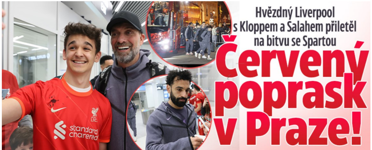
Abbildung 9, Blesk Zeitung 06.03.2024 60

Auf diesem Foto aus Zeitung Blesk wird das Wort „Čevený poprask“ rot geschrieben čevená bedeutet rot, also es verstärkt das Gefühl der Intensität und spielt mit der Emotion des Lesers (emotive Wortschatz).