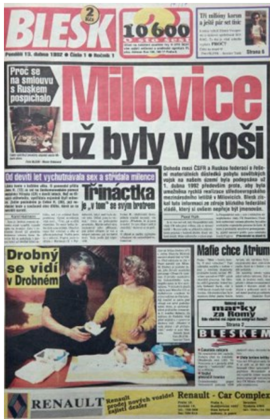
Abbildung 5. Die erste Ausgabe der „Blesk Zeitung“ 50

Gesellschaft vom deutsch-schweizerischen Verein Ringier Axel Springer gekauft. Zum „Blesk“ gehören nicht nur Zeitungen in der Printform oder Onlineform, sondern auch der virtuelle mobile Operator „Blesk Mobil“, Zahlkarte „Blesk Penženka“ und das Produkt „Blesk Energie“.