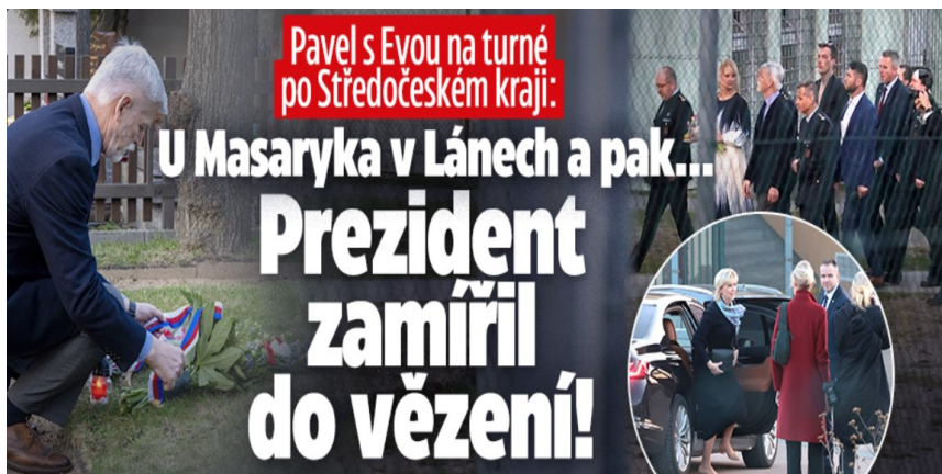
Abbildung 10., Blesk Zeitung 06.03.2024 61

Hier gibt es nochmal eine rote Hervorhebung, was passieren hat. Gegenwärtige tschechische Präsident Petr Pavel hat mit seiner Frau mittelböhmisches Gebiet besucht. Zuerst folgt eine würdige Nachricht über den Besuch des Grabes ehemaligen tschechoslowakischen Präsidenten Tomáš Garrigue Masaryk. Dann wird „a pak...“ bedeutet „und dann...“ besuchte er ein Gefängnis und ist auf dem Foto groß mit Ausrufezeichen geschrieben. „Positive Nachricht wird einer Negativen gefolgt. Ähnliches Foto aus Bild Zeitung wird in nächste Abbildung.