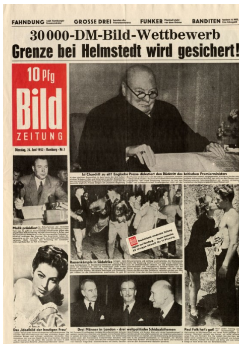
Abbildung 4. Die erste Ausgabe der „Bild Zeitung“ 43

Ganz am Anfang wird „Bildzeitung“ als die erfolgreichste Zeitung in ganzes Deutschland bezeichnet. Schon in fünfziger Jahren liegt der Fokus in riesigem, aber wenigem Text mit vielen Fotos. Der Preis damals war sehr billig und zwar nur zehn Pfennige. 42 Der Gründer dieser berühmten Zeitung heißt Axel Springer, wie der Verlag in Hamburg. Seine Idee wurde ein Inhalt, den interessant für ganze Gesellschaft wäre zu erstellen. Was er als sehr wichtig betrachtete, waren die sogenannte riesige Schlagzeile, große Bilder und die rote Farbe. Axel Springer hat eine Zeitung entworfen, die wie ein Fernsehen in der Druckform funktionierte.