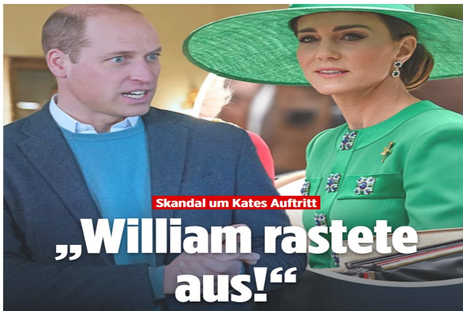
Abbildung 8, Bildzeitung 07.03.2024 59

Dieses Foto zeigt vielen Elemente der Presse Manipulation, z.B. das Wort Skandal selbst wirkt negativ (emotive Wortschatz). Dann aus stilistischer Seite – rot, Ausrufezeichen, das Gesicht