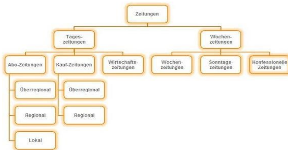
Abbildung 1: Übersicht der Zeitungsgattungen 13