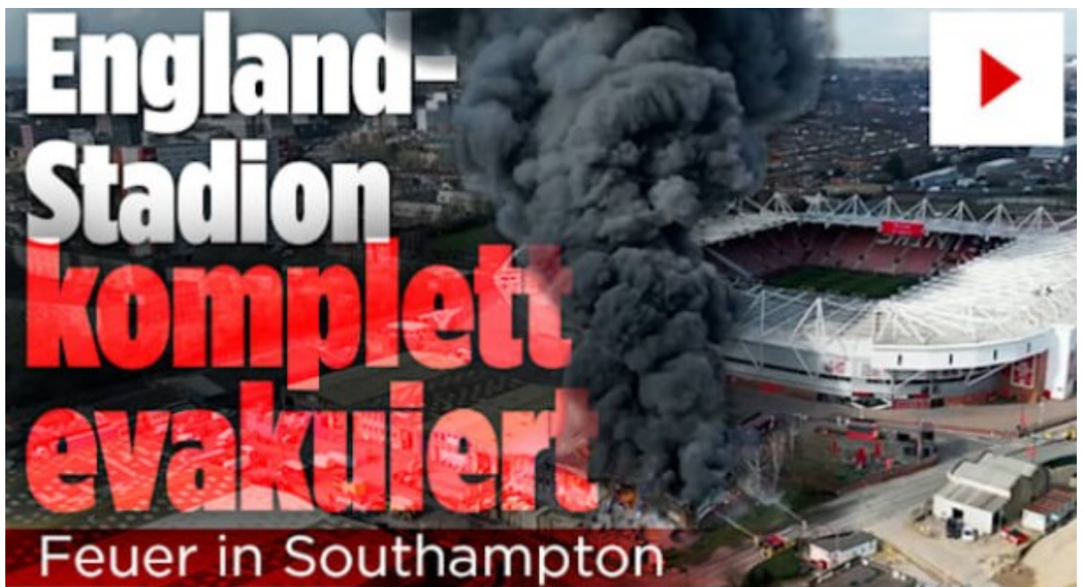
Abbildung 11, Bild Zeitung 06.03.2024 62

Dieses Foto sieht sehr negativ aus. Visuell wirkt wegen des Rauchs tragisch aus. Es gibt wieder wie bei dem Präsidenten Pavel (Abbildung 10) eine Information „Englandstadion“, das wird neutral geschrieben, aber „komplett evakuiert“ und alles in rote Farbe ruft negative Emotion des Schreckens hervor.