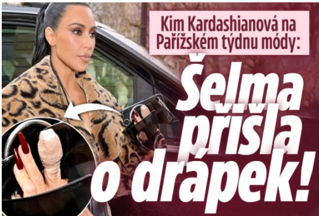
Abbildung 12, Blesk Zeitung 05.03.2024 63

Auf diesem Foto wurde die Promi, Unternehmerin und Model Kim Kardashian auf der Mode Woche in Paris erschienen. Die Überschrift „Šelma přišla o drápek!“ wird als „das Biest hat eine Klaue verloren!“ übersetzt und wirkt absichtlich attraktiv und komisch. Im Artikel aus Blesk Zeitung ist nicht sicher, welchen Unfall oder was genau passierte.