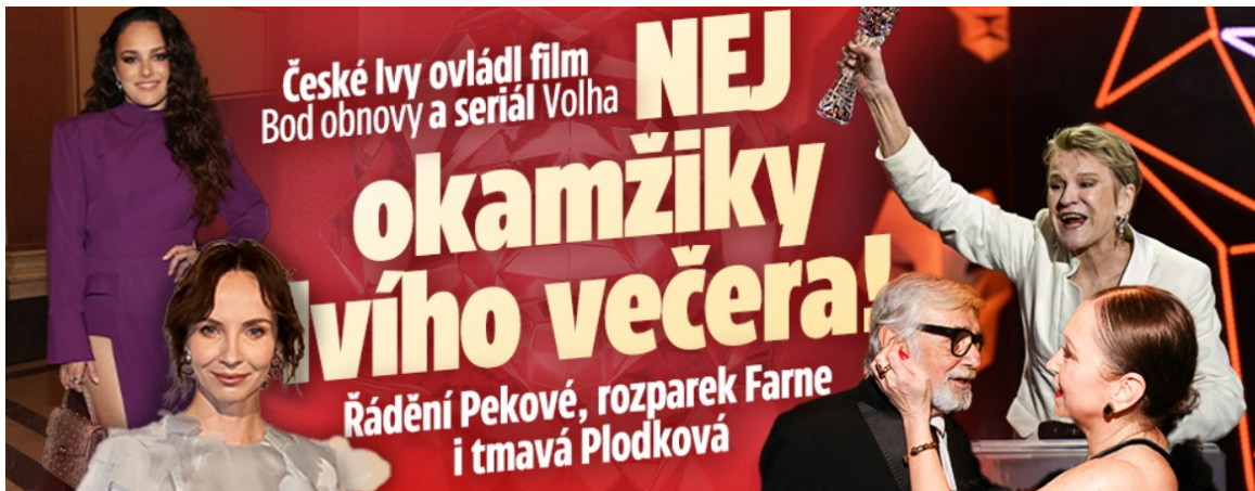
Abbildung 13, Blesk Zeitung 10.03.2024 64

Dieses Foto zeigt die Übergabe der Preisen tschechischer Löwe. Es geht um eine der berühmten Preisen des tschechischen Films. „NEJ okamžiky lvího večera!“ „Die besten Momente der Löwennacht!“ Das ist das Beispiel der Sensation von diesem Abend. Das Wort rozparek der Sängerin Ewa Farna weist auf ihr Kleid hin, dass es ihre Beine alle Menschen sehen können. Dies dokumentiert die sexistische Herangehensweise der tschechischen Boulevardpresse.