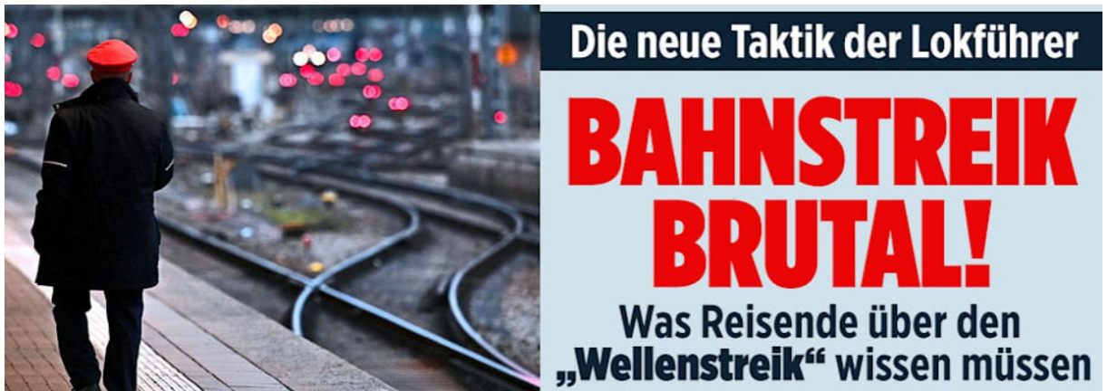
Abbildung 7, Bildzeitung 05.03.2024 58

Auf diesem Foto kann man sehen, dass Überschrift Bahnstreik brutal rot geschrieben wird und mit Ausrufezeichen (stilistische Element). Überschrift die neue Taktik ruft im Leser Neugierigkeit hervor.