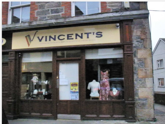
Obrázek č. 5 Charitativní obchod St Vincent de Paul, Cavan Town 73