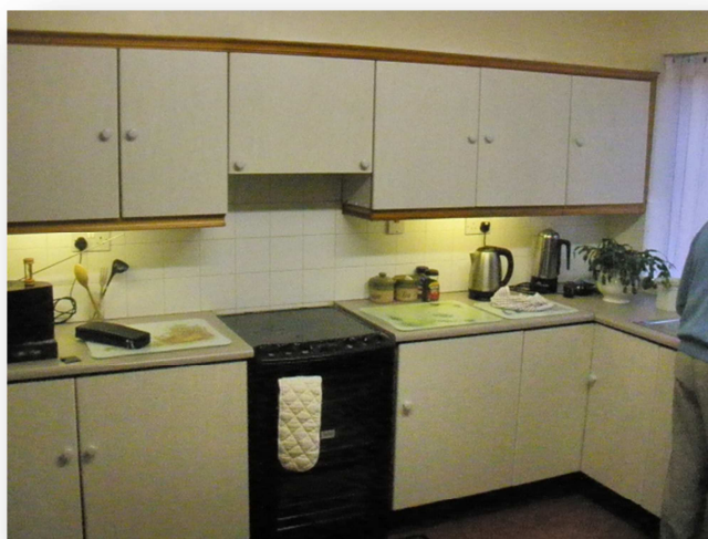
Obrázek č. 8 St Peter's Night Shelter, kuchyně 83

Můj celkový dojem z tohoto malého útulku pro bezdomovce je velmi pozitivní. Nejvíce mě překvapila neexistence jakéhokoliv zápachu, který bývá pro zařízení tohoto typu charakteristický. Všechny místnosti byly čisté, vkusně, jednoduše a hlavně účelně zařízené.