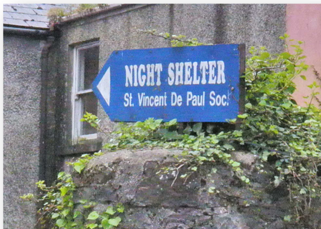
Obrázek č. 6 Cedula útulku St Peter's Night Shelter 80

Noční útulek St Peter's Night Shelter byl vybudován konferencí SVP St Peter's v roce 1984 81 původně jako noclehárna pro muže/bezdomovce alkoholiky, kterým zde za určitých podmínek bylo umožněno konzumovat alkohol (tzv. wet shelter ). Záměrem tohoto opatření, prvního svého druhu v Irské republice, bylo jednak zredukovat počet povalujících se opilců v ulicích města, jednak se pokusit zmapovat stav bezdomovectví v kraji a poskytnout alespoň základní péči osobám bez přístřeší (jídlo, oblečení, nocleh). Přestože je dnes pití alkoholických nápojů v tomto zařízení zakázáno, samotný smysl útulku se během let nijak zvlášť nezměnil. Jeho hlavní činností stále zůstává poskytování jednorázového krizového ubytování a pomoci mužům, kteří se z nejrůznějších důvodů ocitli na ulici . Nejedná se tedy o dlouhodobé řešení problému bezdomovectví jako takového, ale spíš o první pomoc nebo „odrazový můstek“ pro ty, kteří se z pomyslného dna odrazit chtějí.