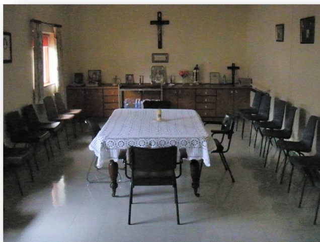
Obrázek č. 7 St Peter's Night Shelter, společenská místnost 82

První, menší společenská místnost je určena k relaxační aktivitě klientů, nachází se zde pár stolků, židlí a televize. Druhá, větší místnost slouží především ke společným modlitbám, které útulek pořádá několikrát ročně (jinak musí chodit klienti klasicky do kostela), nebo k informativním schůzkám s dobrovolníky. Jak je vidět na obrázku č. 7 dekorace v této místnosti se nese v náboženském duchu a skládá se převážně z křížů a obrázků Svatých.