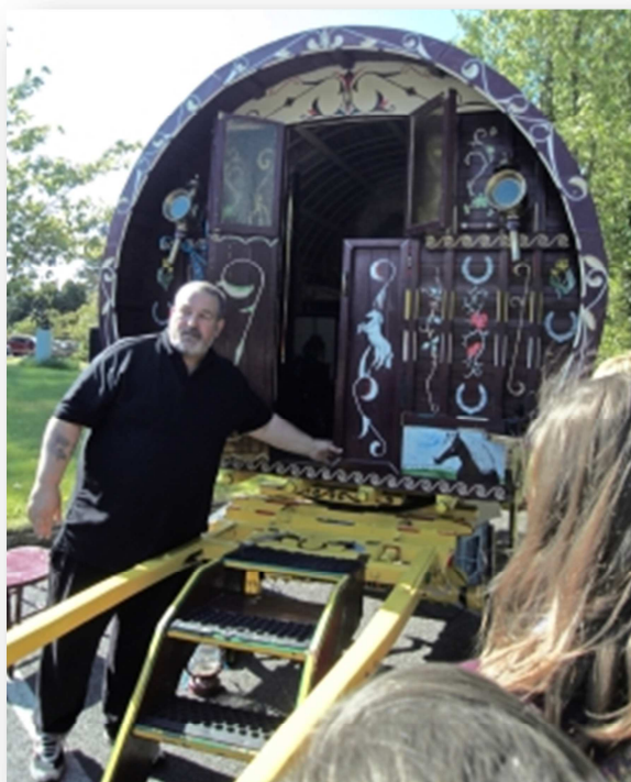
Obrázek č. 3. Tradiční karavan irských Travellers, součást exhibice „The Living History“ 64

příčemž k dispozici je i odborná instruktáž od pracovníka MTW. Tato exhibice je v současnosti mobilní a slouží především pro školní exkurze, ale do budoucna se počítá s pronájmem menšího pozemku, na kterém by se tato historická scéna zabydlela a také rozšířila. V příštích letech by tak návštěvníci měli mít možnost nejen přijít se podívat, jak se Travellers v minulosti žilo, ale také si to vyzkoušet na vlastní kůži, např. přespat v karavanu, vařit na ohništi, rybařit „na pytláčku apod.