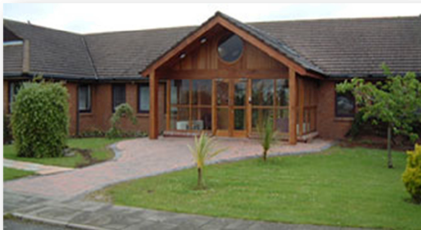
Obrázek č. 1 Trinity House School 27

Trinity House School je jednou ze tří detenčních škol na území Irské republiky, a jedinou detenční školou s maximální množnou úrovní zabezpečení. Nachází se spolu se dvěma dalšími detenčními školami (Oberstown Boys School, Oberstown Girls School) v kampusu Oberstown ve městě Lusk (okres Dublin), na území o celkové rozloze 63 akrů, což je přibližně 255 tisíc čtverečných metrů.