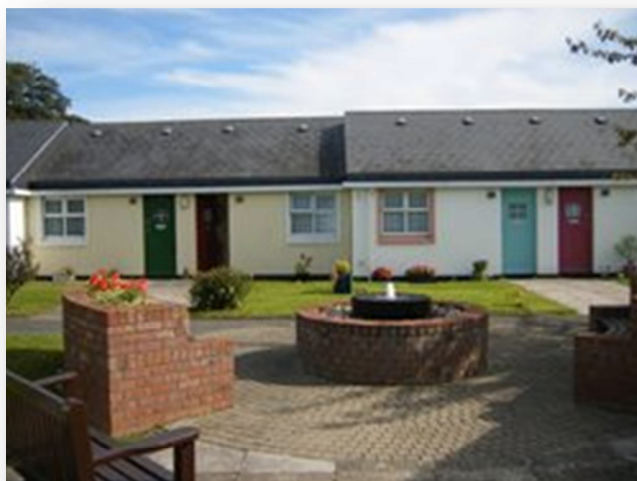
Obrázek č. 4 Bethany House, příklad sociálního bydlení pro seniory

Projekt sociálního bydlení byl vytvořen jednotlivými konferencemi, které se tímto způsobem snažily reagovat na konkrétní požadavky své komunity. Jedná se o poskytování dlouhodobého ubytování zejména starším lidem, ale také rodinám s dětmi, které si vlastní bydlení samy nemohou dovolit. Projekt sociálního bydlení je (finančně) podporován Ministerstvem životního prostředí, kultury a samosprávy ( Department of Environment, Heritage and Local Government ), soukromými sponzory a z určité části také prostředky, které SVP odkázali bývalí klienti. SVP v současnosti poskytuje přes 900 ubytovacích jednotek (domů). 71