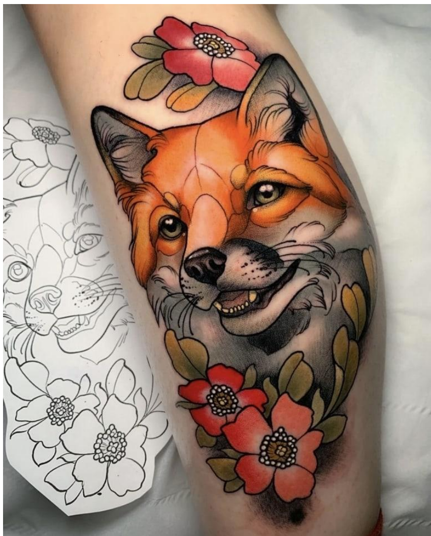
Obrázek č. 2: Neo Traditional tattoo styl