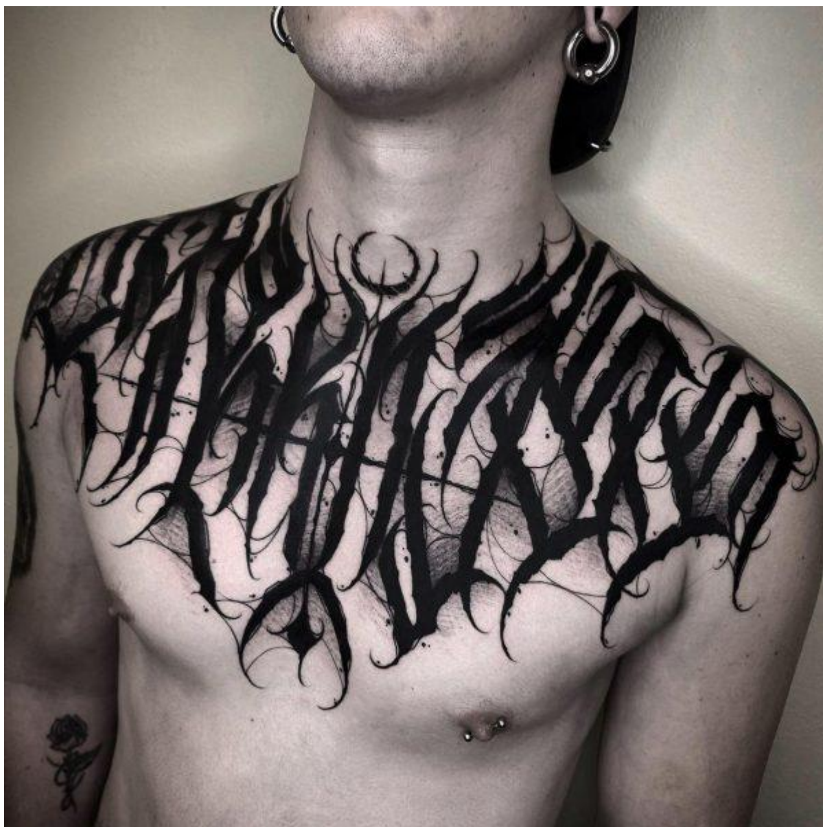
Obrázek č. 4: Dark lettering tattoo styl