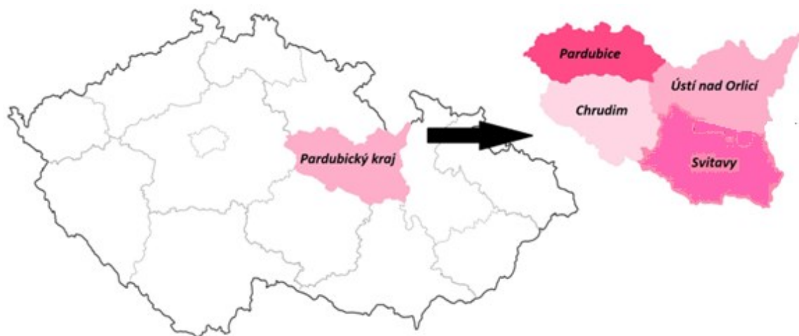
Obrázek 4 Mapa Pardubického kraje včetně jeho okresů