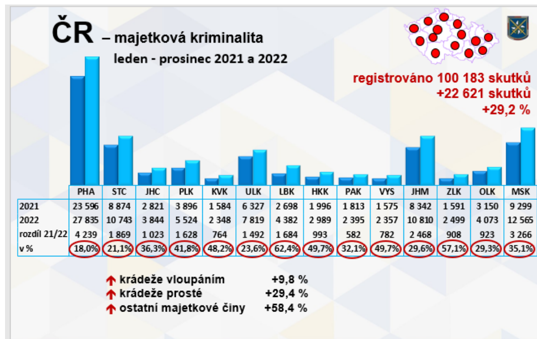
Obrázek 3 Počet trestných činů na úseku majetkové kriminality v letech 2021-2022

Na obrázku číslo 3 jsou uvedeny údaje o počtu trestných činů na úseku majetkové kriminality v letech 2021 a 2022 pro jednotlivé kraje v ČR. Dále je na obrázku zobrazen rozdíl počtu trestných činů krádeže v celých číslech i v procentech.