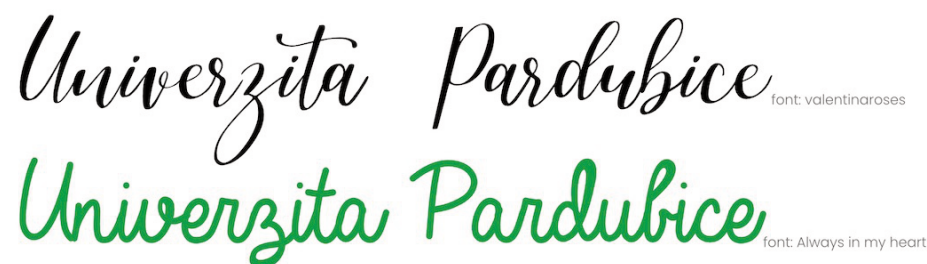
Obrázek č. 4: Ukázka ručně psaného písma

Některá písma, ať už v elegantním kaligrafickém provedení nebo v neformálním rukopisném stylu, simulují nebo připomínají ručně psaný text, zejména díky spojkám a ligaturám, které propojují jednotlivá písmena. I když jsou tyto fonty esteticky přitažlivé, je důležité je využívat s uvážením (Healey, 2011).