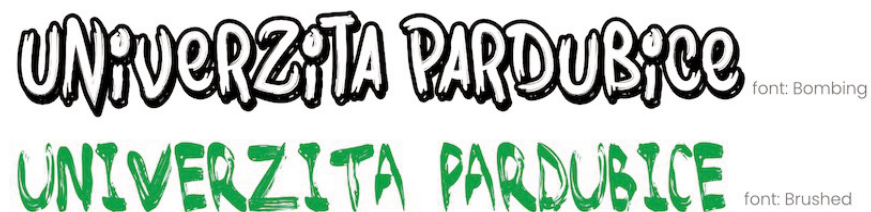
Obrázek č. 3: Ukázka grafického písma

Od počátků průmyslové éry si grafici oblíbili dekorativní způsoby zobrazení, ať už byly vytvořeny mechanicky či ručně. Tyto písma kladou důraz především na kreativitu. I když mohou způsobit snížení čitelnosti, výrazný charakter těchto písem dává návrhu loga jedinečnou a zapamatovatelnou identitu, takže stylistické výhody převažují nad ostatními nedostatky (Healey, 2011).