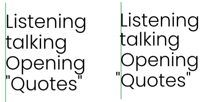
Obrázek č. 6: Ukázka kostrbatých hran

Text nevypadá dobře, když není zarovnaný, proto pozor na zarovnání svislých tahů, přizpůsobení vodorovných čar, zvětšení křivek a správně umístění interpunkce (McWade, 2011).