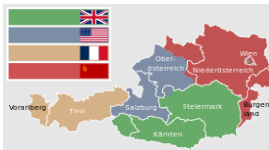
Bild 2 - Die Aufteilung Österreichs im Kommunismus.

Nach dem Zweiten Weltkrieg wurde Europa in West- und Osteuropa geteilt. Die unter dem Begriff "Ost" aufgeführten Länder waren es Länder, die unter kommunistischer Herrschaft standen und die westlichen Länder hatten die Möglichkeit der Demokratie. Zu diesen westlichen Ländern gehörte auch Österreich 20 .