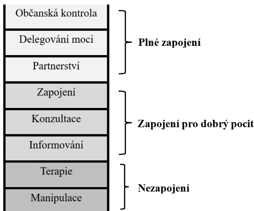
Obrázek 2: Žebřík participace

Typologie občanské participace dle Arnsteinové je představena jako metaforický „žebřík“, který lze vidět na obrázku 2. Model zahrnuje osm „příček“ participace, kdy každá stoupající příčka představuje zvyšující se úroveň občanské aktivity.