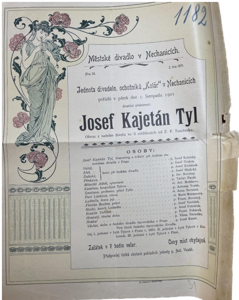
Obr. 9.: Divadelní cedule k představení Josef Kajetán Tyl 1901