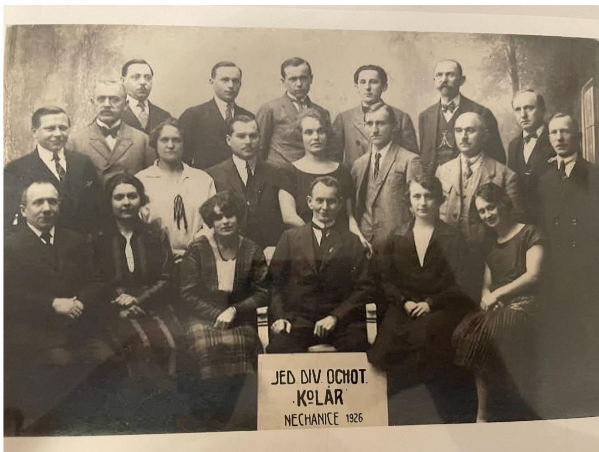
Obr. 2.: Fotografie členů Jednoty divadelních ochotníků Kolár 1926