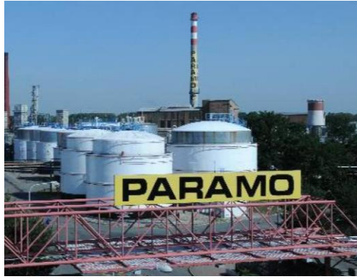
Obrázek 7: chemický podnik Paramo