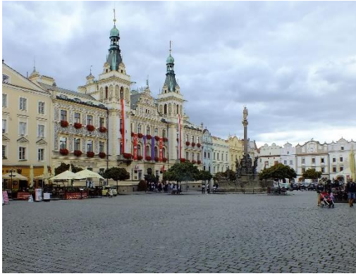
Obrázek 6: Pernštýnské náměstí