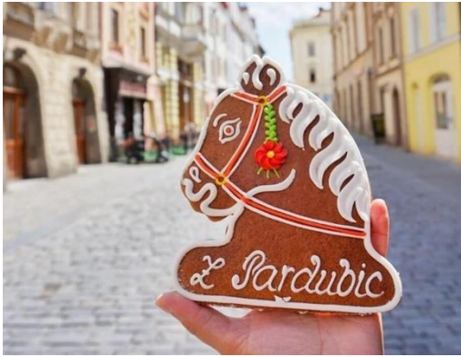
Obrázek 8: pardubický perník