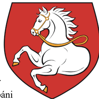
Obrázek 3: Znak