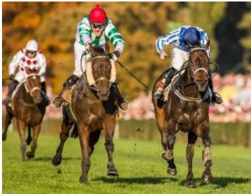
Obrázek 5: Velká pardubická