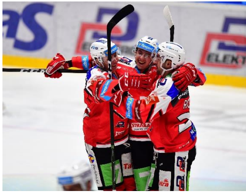
Obrázek 9: HC Dynamo Pardubice