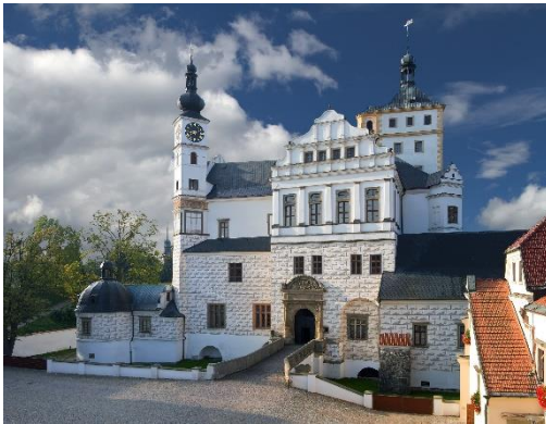
Obrázek 4: Zámek Pardubice