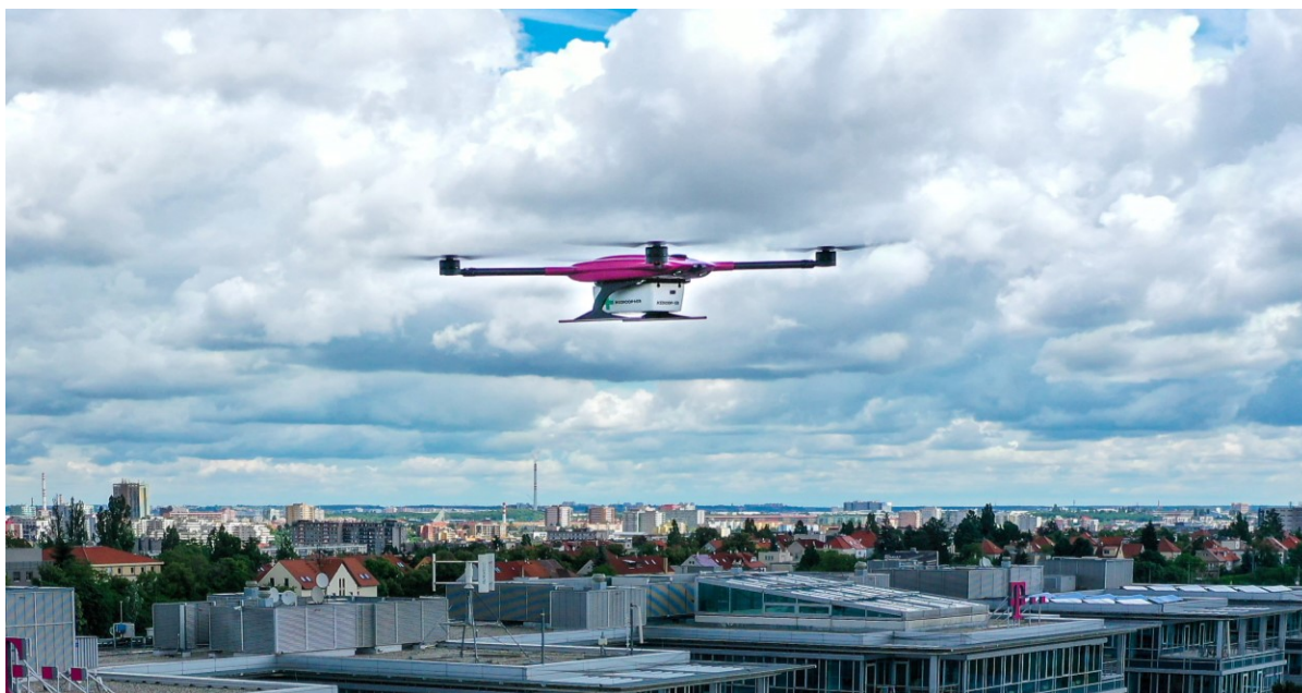
Obrázek 9 Dron s medicínskou zásilkou