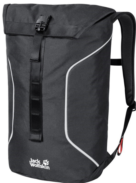
Obrázek 3 Batoh pro kurýra, 2022

Speciální batoh, pro přepravu zásilek má nepromokavou úpravu proti znehodnocení zásilky, dostatečný objem, odolný materiál proti proříznutí a v neposlední řadě by měl mít vybaven zámek nebo podobným zařízením proti neoprávněnému vniknutí cizích osob. Toto doporučení se vztahuje na pohyb kurýra městskou hromadnou dopravou. Obrázek 3 ukazuje batoh, který se může i rozsvítit, což přispívá k větší bezpečnosti kurýra za soumraku nebo za deště (Wokas,2022).