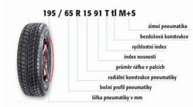
Obrázek 7 Označení pneumatik, 2022

Pneumatiky musí mít schválené rozměry dle Osvědčení o registraci vozidla část II. (Technický průkaz) a je nutné sledovat stav jejich opotřebení.