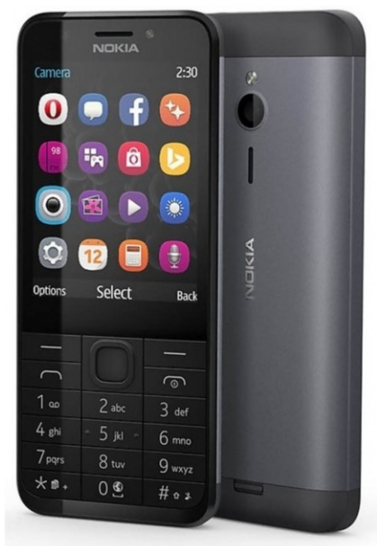
Obrázek 2 Mobilní telefon, 2022

Základním vybavení každého kurýra je mobilní telefon se SIM kartou nebo mobilní zařízení, které umožní přístup na internet a vyhledávat např. adresu doručení, nejbližší spojení městské hromadné dopravy nebo nejkratší cestu pro doručení.