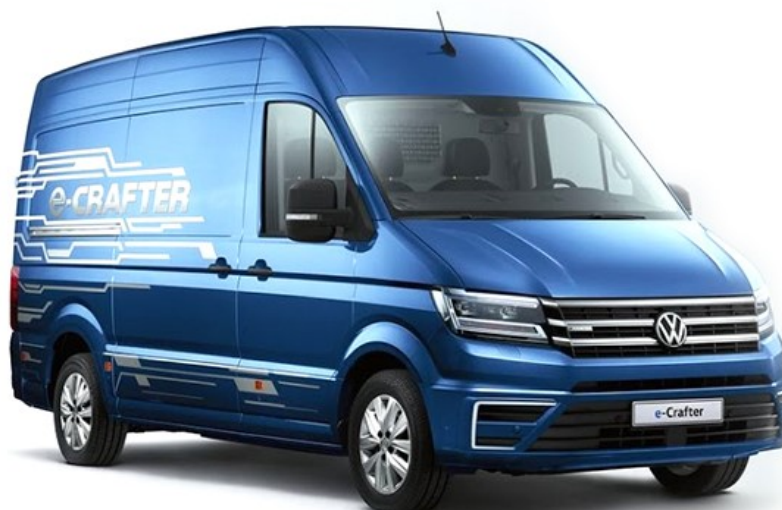
Obrázek 8 e-Crafter, 2022

U užitkového automobilu je nejdůležitější objem a rozměry zavazadlového prostoru. Tyto dva parametry jsou důležité pro přepravu nestandardních a nadrozměrných zásilek. Stejně jako osobní automobily mají i užitkové automobily různé pohony.