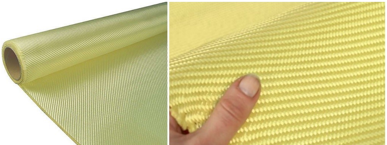
Obrázek 6 Aramidová tkanina,2022

světla. Aramidové tkaniny jsou široce používány zejména pro jejich výjimečné rázové vlastnosti a tahovou pevnost. Aramidové tkaniny jsou významnou součástí neprůstřelných vest a jiného ochranného oblečení. Zejména v kombinaci s keramikou, ocelí či speciálními plasty a laminací epoxidovou pryskyřicí tvoří velmi odolný kompozit. Jsou výbornou volbou pro vrtulové listy helikoptér, motory raket na tuhá paliva, tlakové nádoby stlačeného zemního plynu a dalších částí, které musejí vydržet vysoká napětí a vibrace. Například křídla dopravních letadel Airbus A380 jsou vyztužena vlákny s obchodním označením Kevlar®. Kevlar® je aramidové vlákno s vysokou pevností a nízkou průtažností. Představen byl na počátku sedmdesátých let firmou DuPont. Typickým materiálem je v současné době Kevlar® 29 spolu s novějším Kevlarem® 129, který je lehčí, ohebnější a s vyšší pevností. Dalším konstrukčním materiálem na trhu je Twaron® a Twaron® High Tenacity, aramidová vlákna velmi podobná Kevlaru (Element-Shop, 2022).