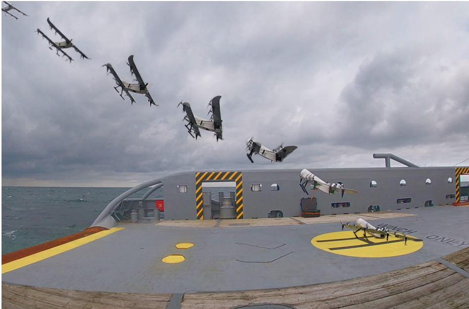
Obrázek 10 Složený snímek testovaného dronu během startu z paluby loď pobřežní stráže (autor Stanislav Mihulka, 2020)

Jak ukazují informace uvedené v této kapitole práce, nasazení dronů v oblasti komerčního doručování zásilek je zatím na samém počátku a je zde velký prostor pro vlastní vývoj, i z pohledu technických parametrů dochází ke stálému zlepšování. Z hlediska ekonomického může být nad možnosti společnosti celý jej zafinancovat z vlastních zdrojů i přesto, že se ceny dronů se v minulých letech velmi snížily.