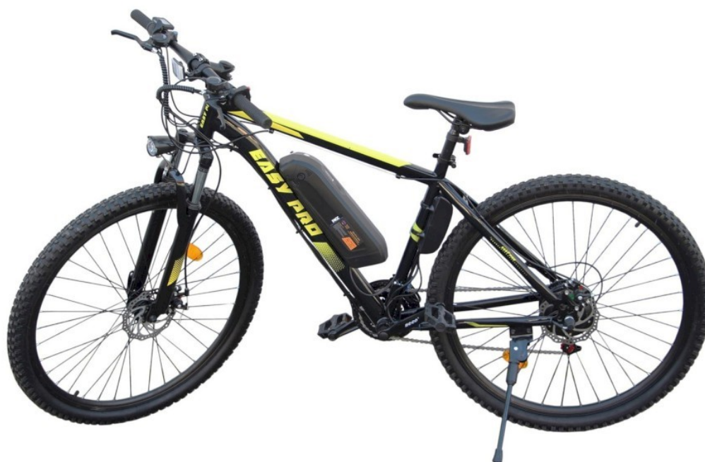
Obrázek 4 Elektrokolo, 2022 (Elektrokolo horské 250 W 29" (proteco-naradi.cz))

Šetří kurýrovi energii a je oproti motorizovaným dopravním prostředkům mobilnější, může jezdit i po pěší zóně a samozřejmě po cyklostezkách. Ty mohou doručovací vzdálenosti značně zkrátit. Nevýhoda jízdního kola je dojezdová vzdálenost, je závislá na výdrží řidiče. Delší vzdálenost ujede kurýr na elektrokole, které pomáhá jezdcovi při stoupání na cestě. Elektrokolo je sice těžší než klasické jízdní kolo, ale pomoc na delších trasách za tuto nevýhodu jistě stojí. Kurýři na jízdních kolech mohou denně najezdit i několik desítek kilometrů.