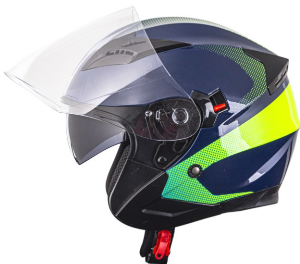
Obrázek 5 Helma na motocykl, 2022

I zde je nutné vybavení, vhodné oblečení a ochranné pomůcky. Jednou ze základních a zákonných ochranných pomůcek je helma, která by mohla být ve firemních barvách a vybavená zařízením pro bezproblémové přijímání telefonních hovorů během jízdy, jak to nařizuje zákon č. 361/2000 Sb., zákon o provozu na pozemních komunikacích a o změnách některých zákonů.