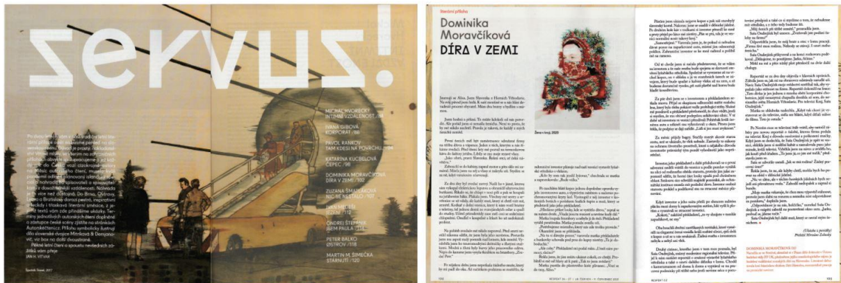
Obrázek 4: Grafický vzhled literární přílohy čísla 27/2021

Letní příloha roku 2021 se nazývá Servus! a věnuje se slovenské literatuře, i když se původně měla věnovat literatuře islandské. Kvůli pandemii koronaviru bylo téma festivalu pozměněno na Slovensko, které bylo Česku dostupnější. Najdeme zde pět textů z povídkových knih, tři ukázky z románu a dvě z novely. 134