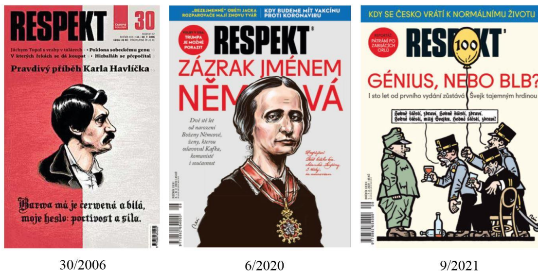
Obrázek 3: Obálky čísel s literárními tématy