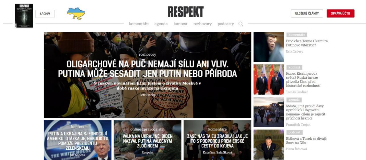
Obrázek 2: Titulní strana internetové stránky Respekt.cz

Můžete nahlédnout do jejich obsahu, avšak po rozkliknutí některých článků se zobrazí jen do čtvrtiny a čtenář je vyzván k zaplacení předplatného. Předplatitel má neomezený přístup do celého archivu. Ve spodní části strany naleznete informace o aktuálně vydaném čísle, seznam uživatelsky nejčtenějších článků a odkazy na další zajímavé aktuální články. Pro hledání konkrétních informací může uživatel využít „lupy“, ikony, která se nachází v hlavní liště. Tato funkce začne filtrovat všechny články z archivu, tedy všechny články od roku 1990. Uživatel může hledat podle názvu, autora článku, rubriky nebo roku vydání. 82