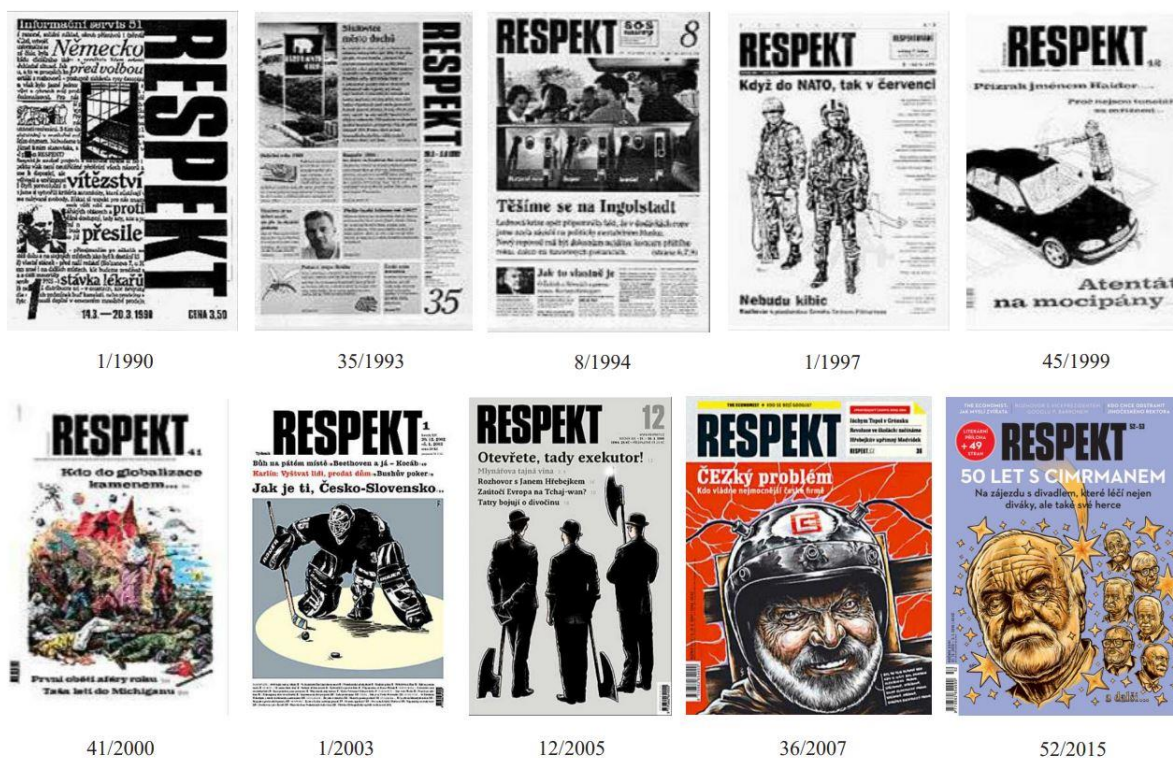
Obrázek 1: Změna vzhledu obálek v průběhu let