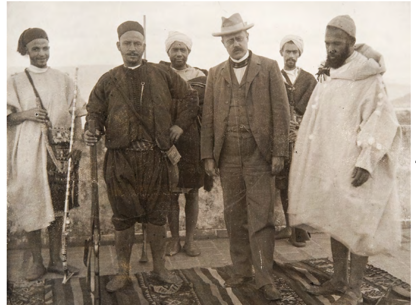
Edvard Westermarck vietti vuosia Marokossa. Hänet on kuvattu tapaamassa paikallisia 1900-luvun ensimmäisinä vuosina.

Moraalin synnyn kannalta ratkaiseva tapaus oli Westermarckin mukaan yhteiskunnallisten instituutioiden kehittyminen. Esimer-