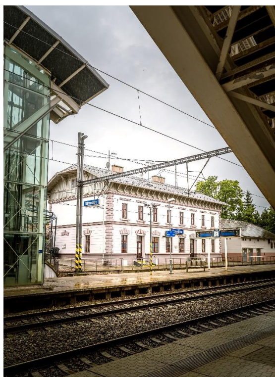
Obrázek č. 2 – Nádražní budova ve stanici Strančice zbudovaná r. 1886, současný stav (2022).

Nádražní budova, v dnešním umístění, byla postavena v roce 1886 105 . Jednalo se tak o další významnou událost ve spojitosti s železnicí od roku 1884, kdy byla dráha zestátněna 106 . Na výstavbě nové nádražní budovy se podílela i samotná baronská rodina Ringhofferů. Do roku 1886 se budova nacházela na druhé straně kolejiště 107 . Původní nádražní budovy, které se začaly stavět již při samotném budování železnice, vznikaly v architektonickém stylu, jenž byl zvaný "alpský". Volba na tento styl nepadla náhodně, ba naopak byla zcela prozaická. Na výstavbě trati se totiž muselo šetřit, a tak nezbyvaly finance na to, aby trať měla vytvořená svá vlastní dokumentační schémata