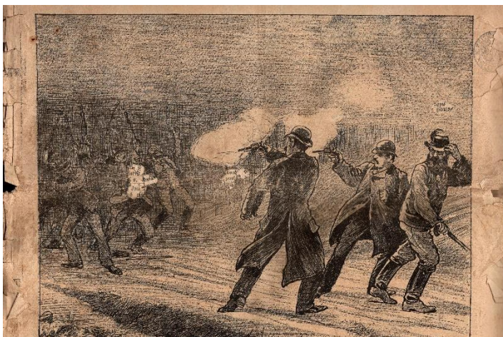
Obrázek č. 7 – Ilustrace na titulní straně časopisu Ilustrovaný Kurýr ze dne 30. září 1894.