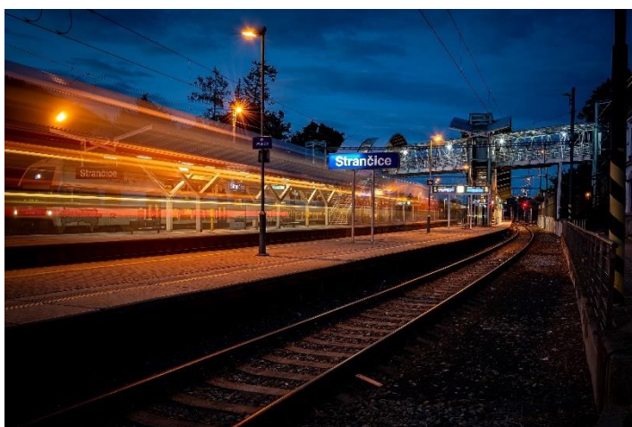
Obrázek č. 1 – Železnice vedoucí skrze obec Strančice, pohled od nádražní budovy, současný stav (2022).

Pracovat na výměru této dráhy se začalo právě v roce 1864, načež tato činnost zabrala celkem čtyři roky. V té době však Strančice nepatřily mezi samostatné obce, ale spadaly pod správu nedaleké obce Předboře. To se změnilo, až roku 1909, kdy se Strančice staly samostatnými.