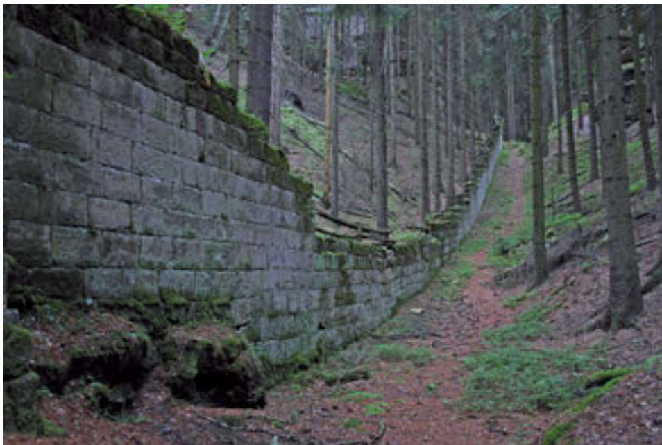
15 Současný stav oborního plotu v Žehrově. Foto Pavel Jakubec, 2020. Zdroj: soukromý archiv autora.

4 jeleni, mezi nimiž byl jeden osmerák, dále 10 kusů černé divoké zvěře z valdštejnské hraběcí obory. 195