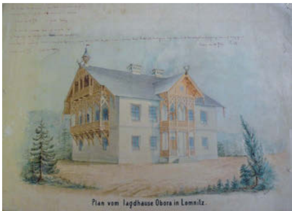
7 Plán loveckého záměčku Obora, 1863.

záměčku, též „loveckého domu“, ještě třetí stavbu situovanou v jižním sousedství velké hospodářské budovy. Nacházel se zde také 12,4 m dlouhý a 2,5 m vysoký skleník o šíři zadní stěny 4,8 m s bohatou skladbou pěstovaných květin. 75