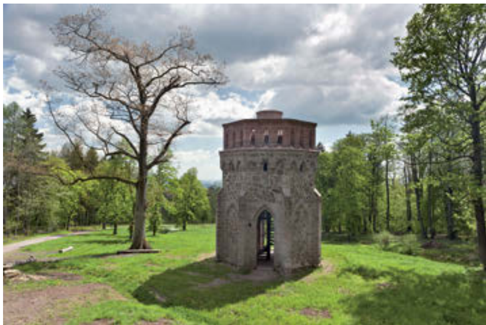
18 Alainova věž.

problém se ukázala identifikace dnes již neexistujících vstupních bran do obory. Nejednotnost terminologie pramenů a nestabilní konstrukce bran vede k domněnce, že jejich instalace a jména nemusely být bezpodmínečně trvalé. Osoby, k nimž se jména jednotlivých bran vážou, se ne vždy podařilo určit jednoznačně. Zvelebení loveckého záměčku v letech 1864–1868 umožnilo jeho pravidelné využívání jak knížecí rodinou, tak úředníky lesní správy. Fenomén švýcarských chat byl ve sledované době módní záležitostí, jelikož ideálně vyhovoval romantickému pojetí vztahu k přírodě. Logiku měla též aplikace novogotických prvků, korelovala jak s architekturou dalších rohan-ských projektů, tak se všeobecným romantickým cítěním. Přestavba záměčku Obora představovala jeden z mnoha projevů soustavného budovatelského úsilí knížete Kamila, které se ovšem rozvíjelo především v sychrovském areálu, mohlo souviset s přílivem finančních prostředků pocházejících z náhrady kompenzující zrušení feudálního vlastnictví. Další stavební činnost následovala za Kamilova nástupce Alaina Benjamina, jenž věnoval velkou pozornost převážně stavbám budov umožňujících výkon lesní správy. Architektonické řešení výše popsaných staveb plně odráží dobu svého vzniku, 2. polovinu 19. století.