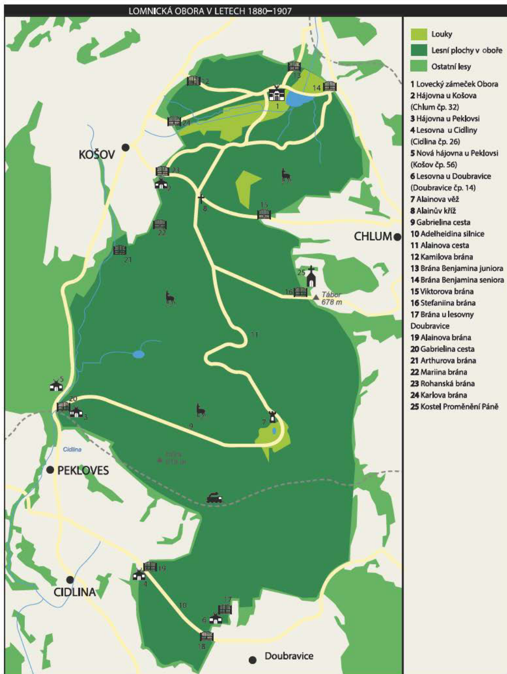
Mapa 2 Lomnická obora v letech 1880–1907. Rekonstrukční mapa, Kateřina Závadová, Jaromír Patočka (2020).