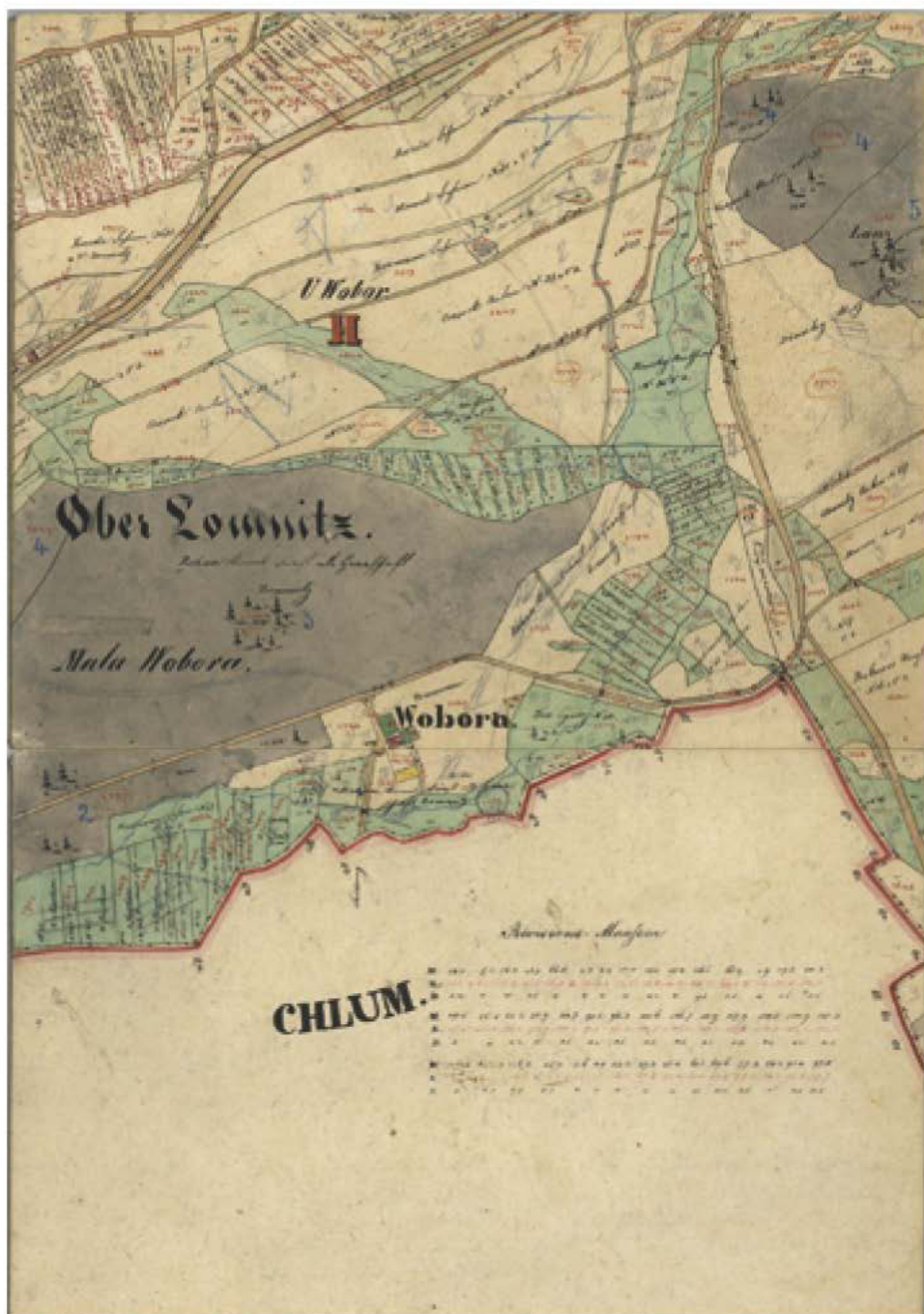
6 Indikační skica stabilního katastru, výřez.