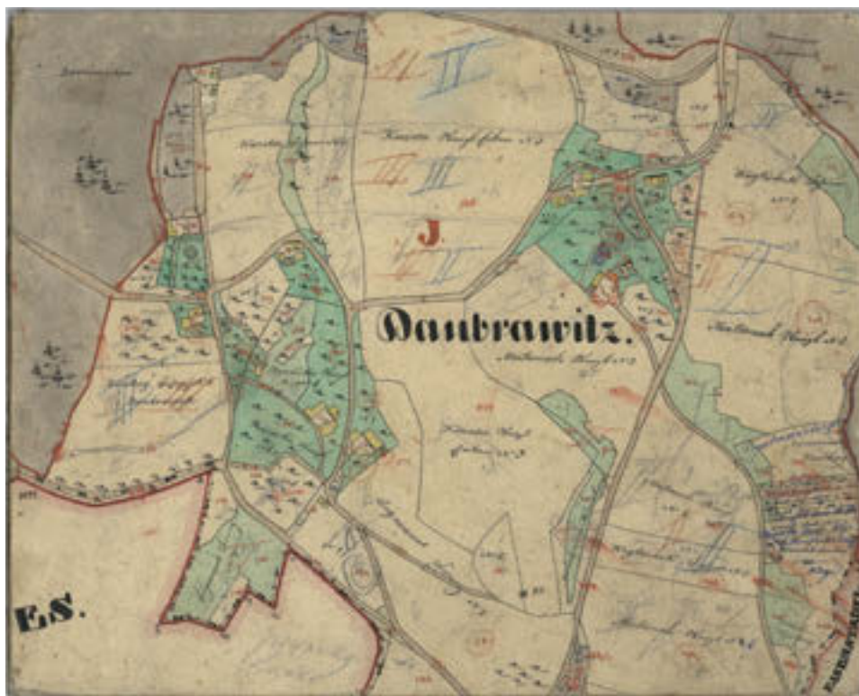
5 Indikační skica stabilního katastru, výřez.

lesní správy. Jednalo se o hájovnu u Košova a lesovnu u Doubravice. 66 Tato lesovna patří k nejstarším budovám zajišťujícím lesní správu lomnické obory. 67 Zachycují ji už topografické prameny z let 1842–1843. Na císařském otisku stabilního katastru je znázorněna jako budova z nespalného materiálu, proti ní stála stavba dřevěná. Prostor mezi budovami tvořil dvůr, k myslivně patřila i zahrada. Na indikační skice stabilního katastru je patrná parková úprava. 68