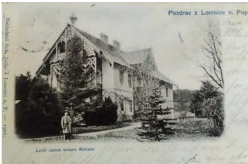
10 Lovčí zámek knížete Rohana, pohlednice, 1901.