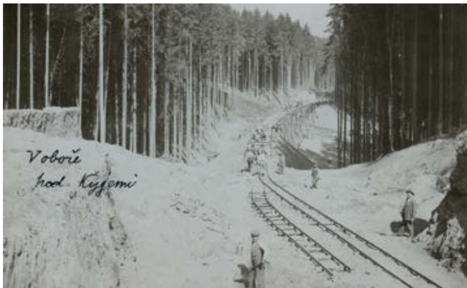
4 Fotografie z alba z výstavby železničního úseku Stará Paka – Lomnice nad Popelkou – Sobotka, nedatováno, SOkA Semily, Archiv města Lomnice nad Popelkou, bez inv. č.

Jelikož železnice měla původně vést mimo areál obory, nabízí se úvaha, do jaké míry souvisela tato změna s dopravou zde těženého dřeva.