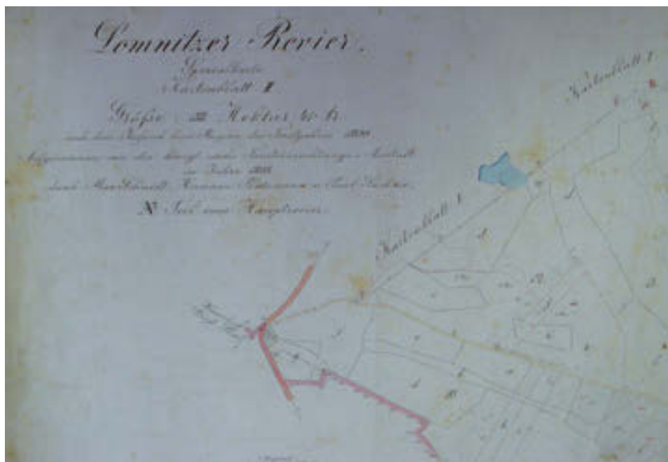
3 Výřez ze speciální mapy revíru Lomnice, 1900.