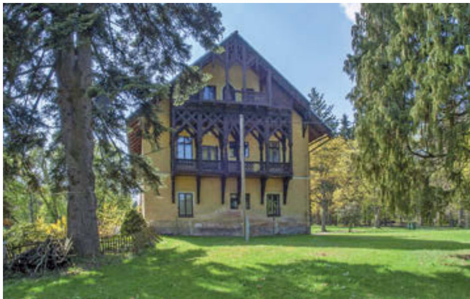
1 Lovecký zámeček Obora.