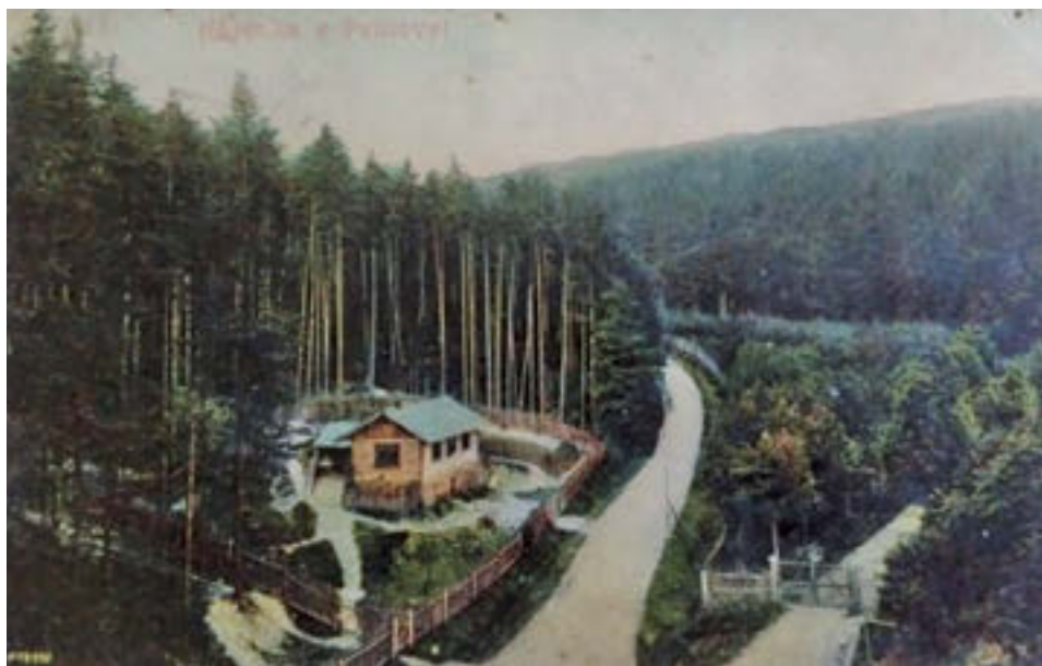
9 Hájovna u Peklovi, pohlednice, poč. 20. století.

statku nacházely rovněž hájovna Morcinov (Košov čp. 55), hájovna Bradlecká Lhota, hájovna Želechy a lesovna Tuhaň. Pod lesní správou spadaly i záležitosti vrchnostenské pily a cihelny. 115