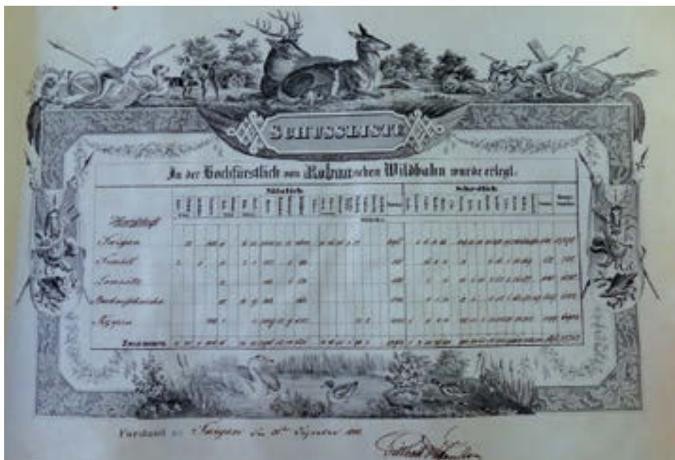
16 List odstřelů pro panství Svijany, Semily, Lomnice, Český Dub a Řepín, 1844.

a Řepín. Celkově nejvíce zvířat bylo odstřeleno na panství Svijany, a to 9 837, na druhém místě je panství Řepín s celkovými 4 842 kusy a na třetím místě panství Český Dub s 1 583 kusy. 199 V Lomnici bylo zastřeleno 15 kusů srnčí zvěře, 553 zajíců, 4 sluky lesní a 315 koroptví. Dále zde bylo zabito 1 717 kusů škodlivé zvěře, kam patřili lišky, kuny, lasičky, supi, jestřábi, krahujci, sovy, straky a krkavci. I v roce 1860 nejvíce odstřelů proběhlo na panství Svijany s 10 111 kusy zvěře, na panství Český Dub 3 127, v Lomnici 936 a nejméně na panství Semily s počtem 180 kusů. Nejčastěji lovenou zvěří byli zajáci a koroptve. Na panství Svijany zastřelili 4 788 zajíců a 4 255 koroptví, na panství Lomnice pak 447 zajíců a 450 koroptví, což je téměř 10krát méně než na panství Svijany. V porovnání užitkové a škodné zvěře zastřelili na všech panstvích v roce 1860 celkem 14 354 kusů užitkových zvířat a 15 363 kusů škodné zvěře. 200