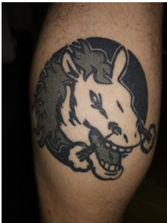
Obrázek č.6: Logo pardubického hokejového klubu

Jednapadesátiletý Radek mi sdělil: „Na levém lýtku mám hlavu pardubického koně, což je logo pardubického hokejového klubu, kterému fandím už od mládí“ (viz obr. 6). I u něho můžeme tvrdit, že se díky svému tetování řadí k určité sociální skupině, kterou něco spojuje.