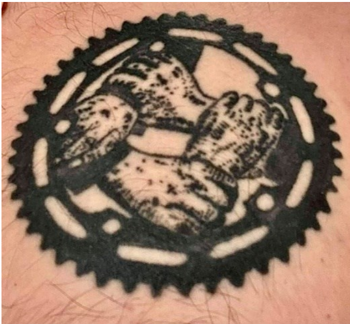
Obrázek č.4: Ozubené kolo

Sociálně-skupinová funkce je zřejmá i z výpovědí u několika mých respondentů. Jedná se tedy hlavně o zástupce mužského pohlaví. Jako třeba Lukáš má na své ruce vytetovaná řídítka (viz obr. 3) a na hrudníku má ozubené kolo (viz obr. 4). Tato tetování má z toho důvodu, že se věnuje jízdě na BMX kole. V komunitě lidí, ve které se pohybuje, jsem byla i já svědkem toho, že je tetování častým doplňkem na těle mnohých z nich a proto vím, že není jediný, kdo má takové symboly vytetované. Symbolika je tudíž spjata s určitou skupinou, jelikož se věnují stejné činnosti.