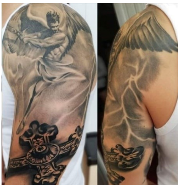
Obrázek č.2: Anděl s mečem a kříž

Ve výpovědích z rozhovorů jsem se setkala pouze u jednoho z respondentů s tím, že by svému tetování takovou funkci přisuzoval. Pětadvacetiletý Michal má na své paži vytetovaný kříž a motiv anděla s mečem, který rozděluje dobro a zlo (viz obr. 2).