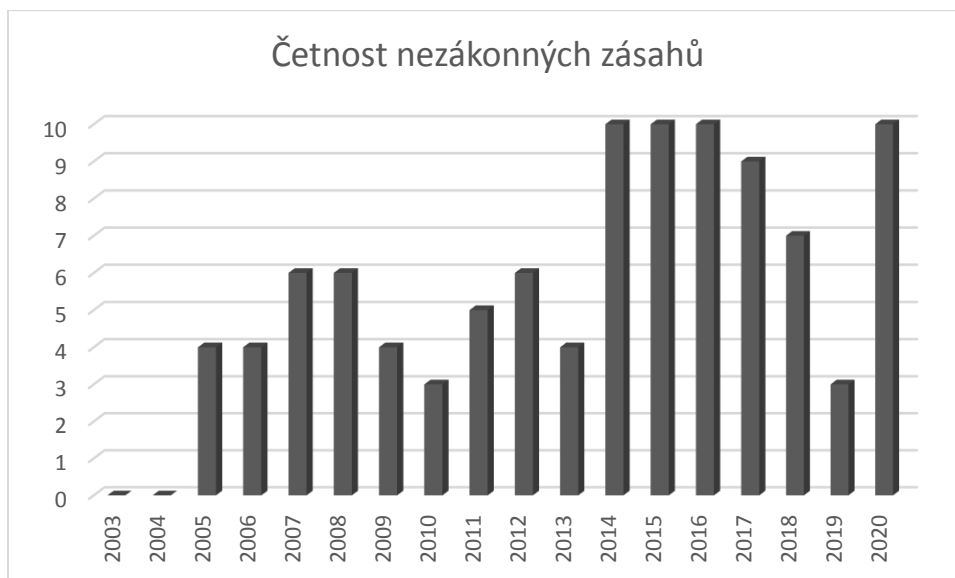
Obrázek 1: Počet zveřejněných judikátů týkajících se nezákonných zásahů