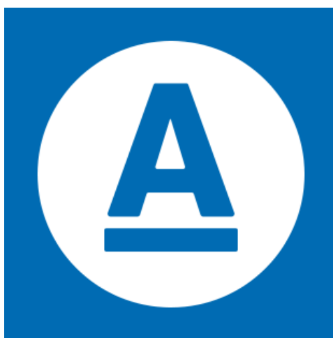
Obrázek 2: Logo Aktuálně.cz

Logo Aktuálně nese podobu modro-bílé barvy. Na úvodní straně má návštěvník možnost zjistit, jaké je aktuální počasí, nebo jaký je den a kdo, má v daný den svátek. V současnosti server zobrazuje aktuální dění o koronaviru.