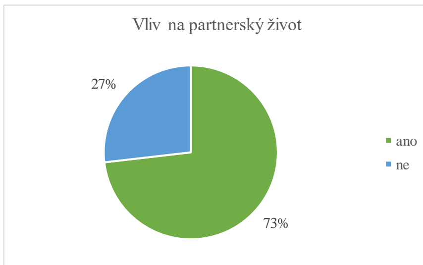
Obrázek 1 Vliv směnného provozu na partnerský život

Na otázku, zda se respondentka domnívá, že práce ve směnném provozu ovlivňuje její partnerský život odpovídá graf znázorněný na obrázku č. 1. Drtivá většina respondentek (30; 73,2 %) uvedlo, že ano. Zbýlých 11 respondentek (26,8 %) se domnívalo, že směnný provoz na jejich partnerský život vliv nemá.