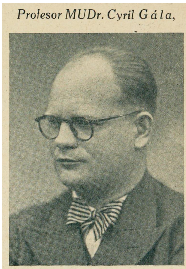
Obrázek č. 1. Portrét profesora Cyrila Gály.