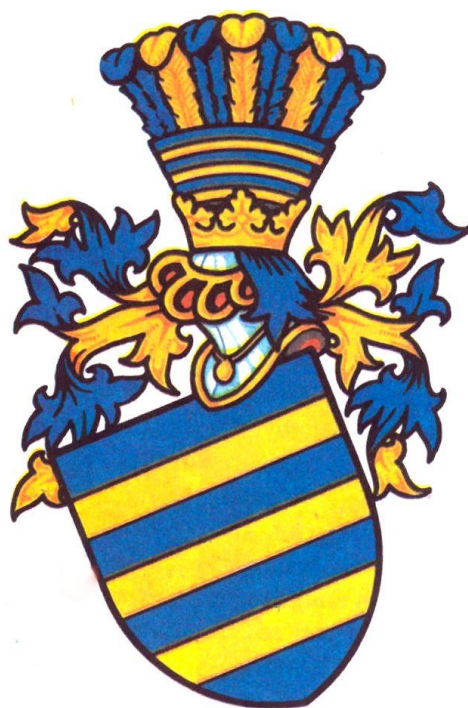
2. Erb rodu Slavatů

J. JANÁČEK, J. LOUDA, České erby , s. 159.