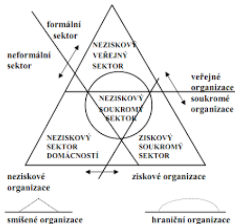
Obrázek 1 Členění národního hospodářství podle Pestoffa

v rámci občanské soudržnosti. Z tohoto důvodu se občané sdružují do různých typů nestátních neziskových organizací.