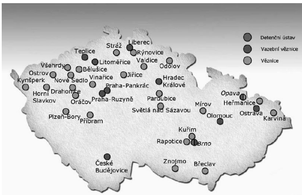
Obrázek 2- Mapa věznic a detenčních ústavů ČR

Níže uvádím mapu věznic a detenčních ústavů v ČR.