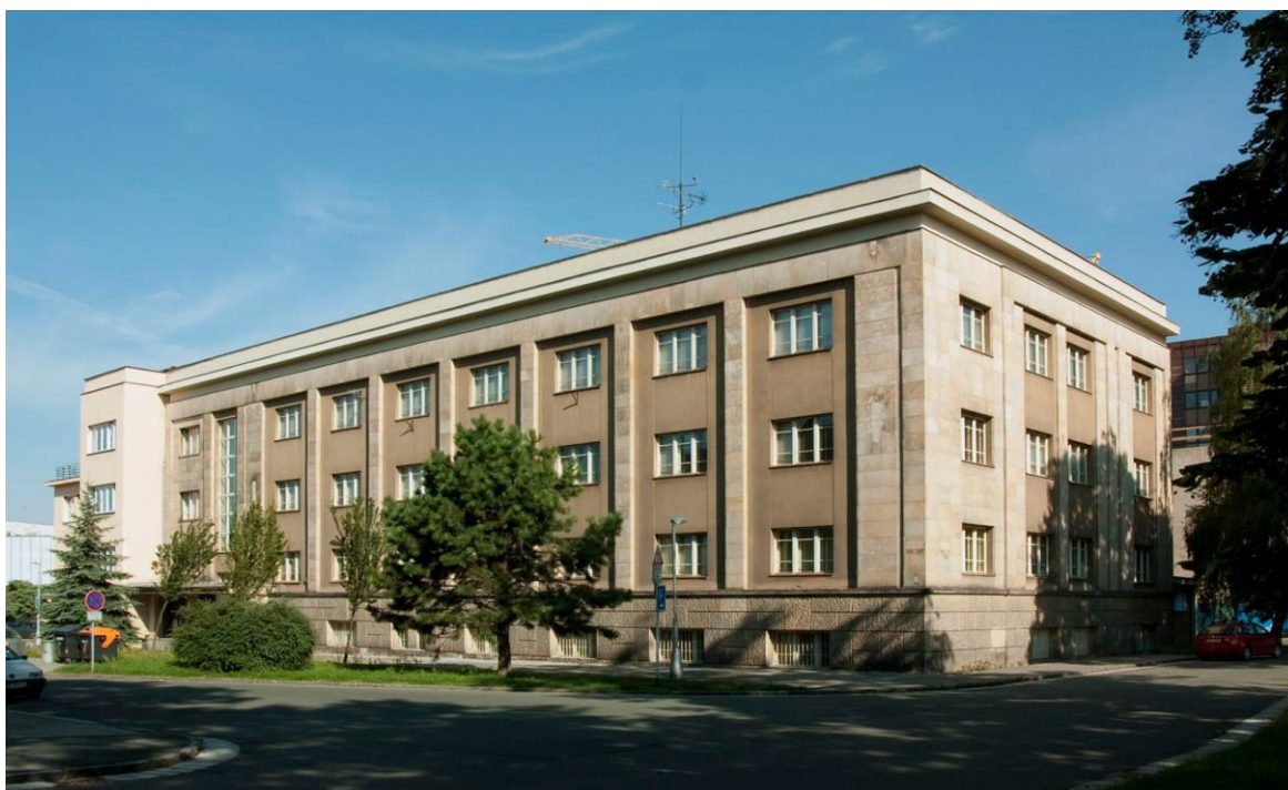
Obr. 2. Budova dnešního archivu ve Škroupově ulici.