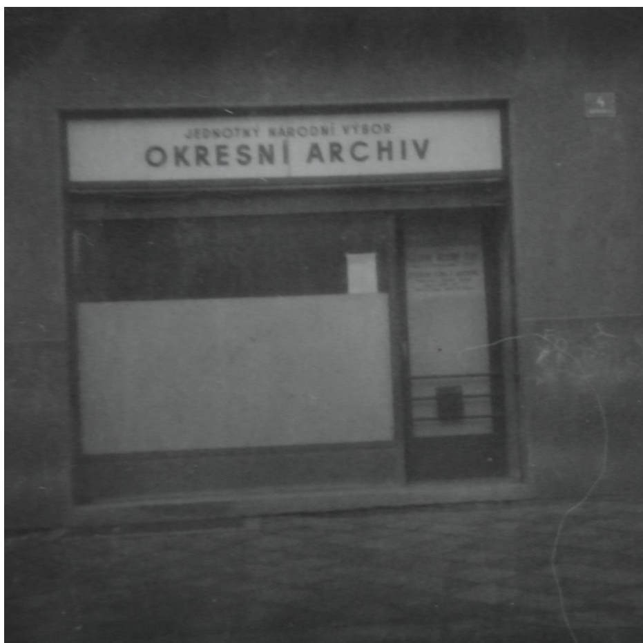
Obr. 3. Depozitář v Pospíšilově ulici z roku 1954.