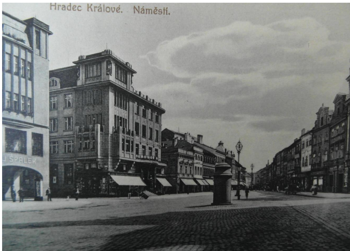
Obr. 1 Budova Záložního úvěrového ústavu v Hradci Králové, dřívější sídlo archivu.