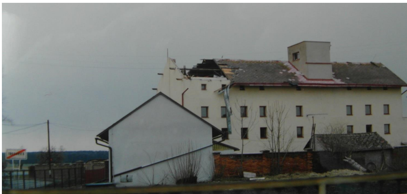
Obr. 4. Depozitář v Třesovicích po vichřici.