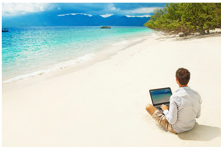
Obrázek 2 - Způsob, jakým je digitální nomádství často prezentováno.

Ne úplně každé místo pozitivně podpoří naši produktivitu a umožní nám soustředit se plně na práci. Každému může mít jiné preference a proto uvedu místa, které k výkonu práce digitální nomádi často volí.