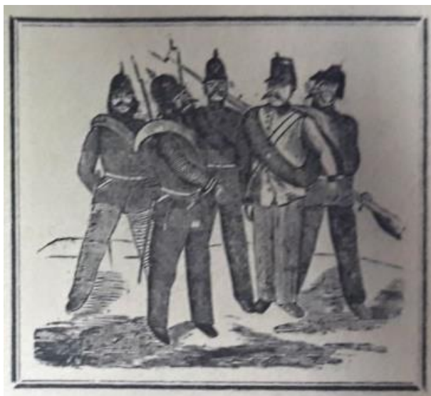
Obrázek 19 Obrázek pěti vojáků

Vojáci mají hrdý a sebevědomý postoj. Jsou oblečení do uniformy, pas jim lemují opasek, přes rameno mají přehozenou pušku. Hlavu jim zdobí ochranná helma. Všech pět vojáků má hustý knír a sebevědomý výraz ve tváři. Celý obrázkový výjev je orámován jednoduchými tenkými linkami.