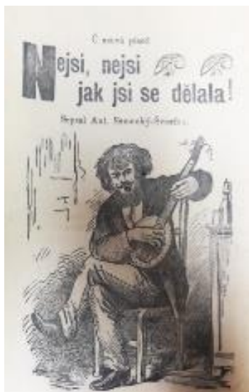
Obrázek 1 Zpěvák z písně: Nejsi, nejsi, jak jsi se dělala!

V pozadí se nachází kus nábytku. Zpěvák pravděpodobně sedí v uzavřené místnosti. Součástí tohoto obrázku je ozdobný název písně, který je zakomponovaný do pozadí obrázku.