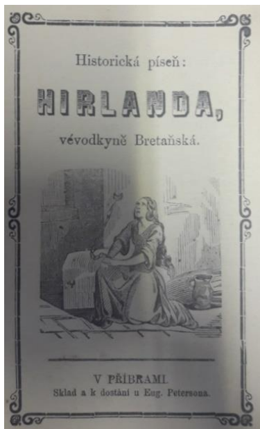
Obrázek 3 Titulní strana historické písně: Mirlanda, vévodkyně Bretaňská

Text se dělí na 26 slok, které jsou označeny číslicemi. Jednotlivé sloky se rýmují a jsou od sebe odděleny mezerou a číslicí. Refrén se v této kramářské písni nevyskytuje. Kramářský text je v rozsahu osmi stran, strany nejsou nijak označeny. Pod poslední slokou se objevuje tiskacím velkým písmem slovo „konec“. Text obsahuje pouze jeden obrázek, který se nachází na titulní straně. Na obrázku je znázorněna klečící spoutaná Mirlanda vévodkyně Bretaňská. Titulní strana je ozdobně orámovaná.