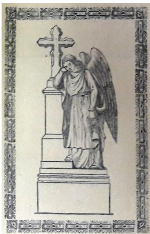
Obrázek 16 Památník mrtvých zákopníků

Refrén se v této kramářské písni nevyskytuje. Kramářský tisk je v rozsahu 4 stran, strany nejsou nijak označeny. Pod poslední slokou se nachází věta „Patisk se přísně zapovídá.“ Text obsahuje jeden obrázek., který se nachází na titulní straně a znázorňuje pravděpodobně památník mrtvých zákopníků. Dominantou památníku je honosný zdobený kříž. Na památníku stojí shrbený anděl, který si podpírá hlavu. Je oblečen v bílém rouchu. Na zádech má veliká křídla. Obrázek památníku s andělem je ozdobně orámován. Tento obrázkový výjev se opakoval u několika kramářských tisků, pravděpodobně je pouze ilustrací smutku, který pokaždé může vyjadřovat trochu něco jiného.