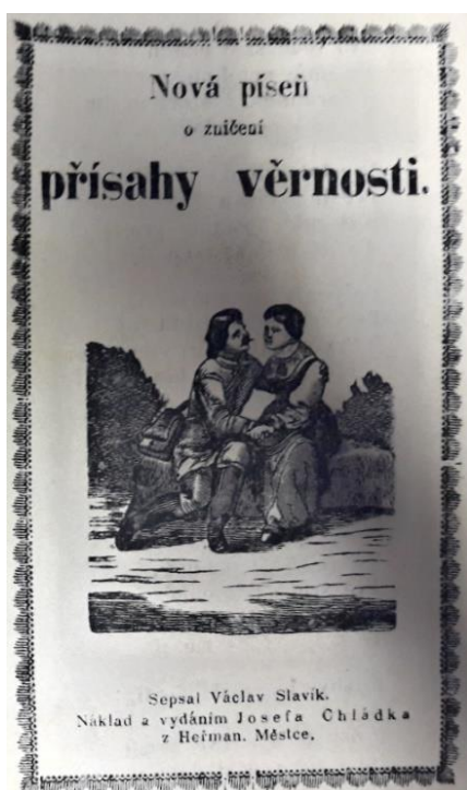
Obrázek 11 Přísahy věrnosti

je tiskacím písmem napsané slovo „konec.“ Píseň je v rozsahu 2 stran. Druhá píseň je označená římskou číslicí II. a skládá se z šesti slok, které jsou označeny arabskými číslicemi. Pod poslední slokou je tiskacím písmem napsané slovo „Konec.“ Celkový rozsah této písně je na 1 straně tisku. Kramářský tisk je v celkovém rozsahu čtyř stran, které nejsou žádným způsobem označeny. Text obsahuje celkem jeden obrázek. Tento obrázek se nachází na titulní straně a znázorňuje dvě rozmlouvající osoby. Jedna osoba představuje ženu a druhá muže. Muž s hustými vlasy a knírem vypadá, že ženu dychtivě přemlouvá a prosí. Žena má neutrální výraz a trochu se hrbí, jako by jí byl rozhovor nepříjemný. V pozadí je vidět přírodní krajina. Následně je celý obrázkový výjev orámován ozdobným rámečkem.