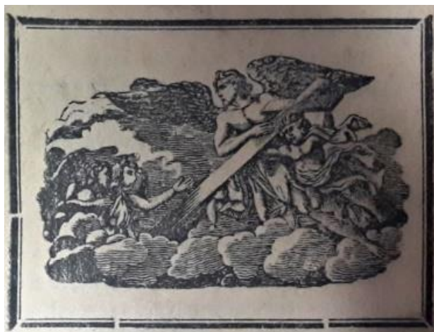
Obrázek 17 Ukázka obrázku k písni o desateronásobné vraždě

Text je psán tiskacím neozdobným písmem a dělí se na 23 slok, které jsou označeny arabskými číslicemi, jednotlivé sloky se rýmují a jsou od sebe odděleny mezerou a arabskou číslovkou. Refrén se v této kramářské písni nevyskytuje. Kramářský tisk je v rozsahu 8 stran, strany nejsou nijak označeny. Text obsahuje jeden obrázek., který se nachází na titulní straně a pravděpodobně znázorňuje dva andělíčky a dvě k nim se modlící osoby. Pohlaví osob zde nelze určit.