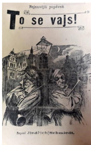
Obrázek 5 Ukázka obrázku z kramářské písně s názvem: Nejnovější popěvek „To se vajs!“

Text se dělí na 16 slok, které nejsou označeny číslicemi. Jednotlivé sloky se rýmují a pokaždé končí souslovím „To se vajs!“, což bychom mohli přeložit do dnešní mluvy jako „To se ví!“. Jednotlivé sloky jsou od sebe odděleny mezerou. Refrén se v této kramářské písni nevyskytuje. Kramářský text je v rozsahu čtyř stran, strany nejsou nijak označeny. Pod poslední slokou se objevuje věta „Patisk se zakazuje.“ Tato kramářská píseň obsahuje pouze jeden obrázek. Kde jsou zobrazeni dva potulní zpěváci u lampy na náměstí ve městě.