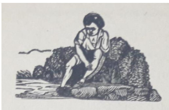
Obrázek 7 Ukázka z druhé strany písně o přehrozné a strašlivé bouři, krupobití a povodni v Jižních Čechách, u města Přeštic v kraji Plzeňském dne 16. května 1889

Druhý obrázek pravděpodobně znázorňuje nešťastnou osobu, nejspíš dítě, nebo mladého chlapce. Chlapec hledící na stále stoupající hladinu vody. Z obrázku je patrné čiré zoufalství a bezmoc zabránit vodě ničit krajinu, domy i životy.