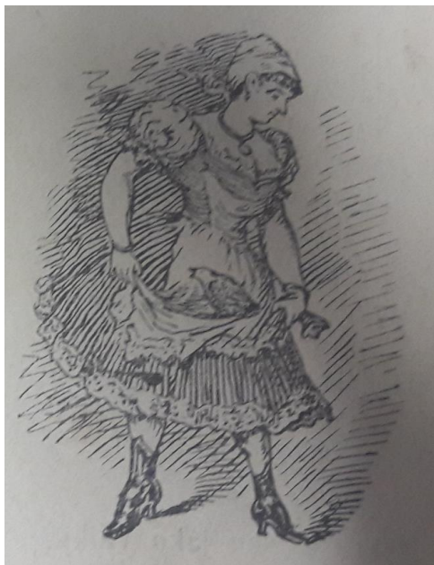
Obrázek 15 Ženská postava

Text obsahuje jeden obrázek., který se nachází na titulní straně a znázorňuje ženskou postavu.