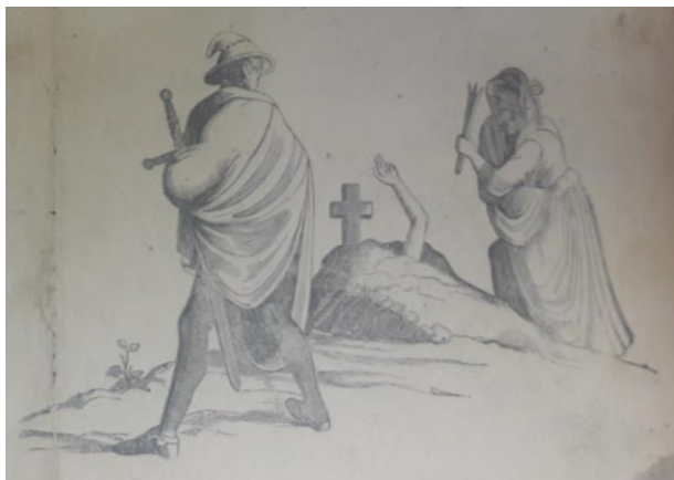
Obrázek 14 Ukázka z písně Krkavčí matka

Text je psán tiskacím neozdobným písmem a dělí se na osm slok, které jsou označeny arabskými číslicemi, jednotlivé sloky se rýmují a jsou od sebe odděleny mezerou a arabskou číslovkou. Kramářský tisk je v rozsahu čtyř stran, strany nejsou nijak označeny. Pod poslední slokou se nachází drobný ozdobný ornament. Text obsahuje jeden obrázek., který se nachází na titulní straně a znázorňuje hrob malé Růženky. Z hrobu vyčnívá lidská ruka. Nad hrobem se sklání šílená matka Františka., která si jednou rukou stírá slzy z obličeje do chudých šatů. V druhé ruce Františka svírá, pravděpodobně předmět, kterým svou dceru zabila. Na obrázku je zobrazena i mužská postava, která v rukou svírá meč. Tato postava má na hlavě klobouk, jinak je zahalená v plášti. Mužské postavě není vidět do tváře, protože stojí čelem k hrobu. Tato postava nejspíše představuje četníka, nebo ducha mrtvého partnera Františky, tedy zloděje a otce mrtvé Růženky.