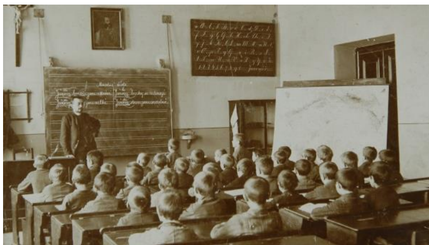
Obrázek 22 Ukázka školní třídy (Národní muzeum, 2012)

Na následujícím obrázku (obr. číslo 22) je zachycena ukázka školní třídy.