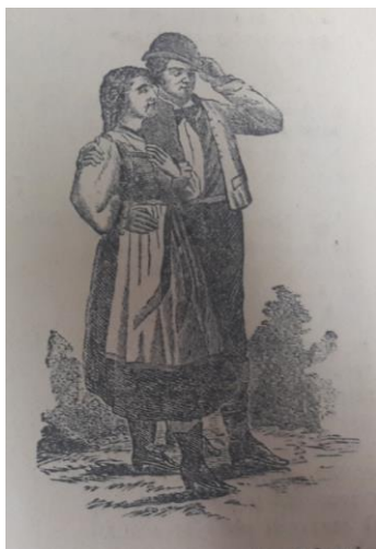
Obrázek 10 Zamilovaný pár mladých lidí

Kramářská píseň se rozkládá na 3 stranách. Kramářský tisk je složen ze dvou písní. Text první kramářské písně se dělí na 10 slok, které nejsou nijak označeny, jednotlivé sloky se rýmují a jsou od sebe odděleny mezerou. Tato první píseň je v rozsahu 2 stran. Refrén se v této první kramářské písni nevyskytuje. Často se ve skocích objevuje oslovení „Nanyňko, Nanyňko, Nanyňko má“, nebo „Andulko, Andulko, Andulko má“. V písni se objevuje stručný popis dívky, která je modrooká s červenými tvářičkami. Fyzicky popis chlapce v písni nevyznívá, pouze píseň poukazuje na jeho chudobu, pracovitost a touhu po hezkém děvčeti. Druhá píseň z tohoto kramářského textu je označena římskou číslicí II. Obsahuje šest slok a celkový rozsah této písně je na jedné straně tisku. Kramářský tisk je v celkovém rozsahu čtyř stran, strany nejsou nijak označeny. Text obsahuje celkem jeden obrázek. Tento obrázek se nachází na titulní straně a znázorňuje zamilovaný pár dvou mladých lidí.