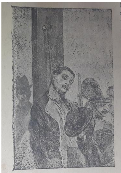
Obrázek 9 Oběšený travič Novotný

Text kramářské písně se dělí na 13 slok, které nejsou nijak označeny, jednotlivé sloky se rýmují a jsou od sebe odděleny mezerou. Opět tato kramářská píseň neobsahuje refrén. Kramářský tisk je v rozsahu čtyř stran, přičemž strany nejsou nijak označeny. Pod poslední slokou se objevuje ozdobný ornament. Text obsahuje celkem čtyři obrázky. První obrázek se nachází na titulní straně. Obrázek znázorňuje oběšeného traviče Novotného. Postava Novotného se nachází na popravišti, je slušně oblečený, má tmavé vlasy, tmavý knír a zavřené oči. Kolem krku má utáhnutou smyčku, obrázek znázorňuje, jak Novotnému z hlavy padá klobouk. Kolem popraviště jsou nějaké osoby včetně četníka, který dohlíží na popravu. Obrázek vypadá velice věrohodně, číší z něj respekt a varování před podobnými činy, kterých se dopustil Novotný.