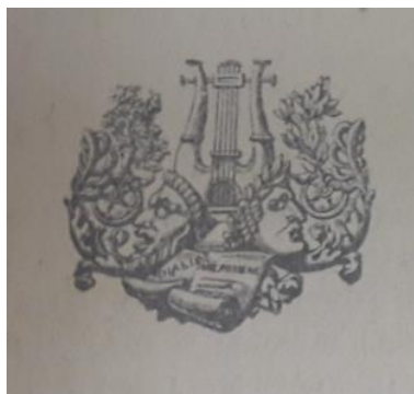
Obrázek 2 Dvě masky z písně: Nejsi, nejsi, jak jsi se dělala!

Druhým obrázkem v této kramářské písni je ozdobný ornament, který dle autora bakalářské práce s textem nesouvisí. V textu je pravděpodobně přidáný, z uměleckého hlediska. Tento obrázkový výjev se nachází na druhé straně kramářského textu. V bakalářské práci není uveden, protože nemá referenční hodnotu vůči problematice genderových konstruktů a je pouze dekorem. Třetím obrázkem, jsou dvě masky. Pravděpodobně jsou tyto masky v textu znázorněny z důvodu, že značí faleš a přetvářku. Na levé straně je znázorněna maska mužská. Tato maska může znázorňovat chlapcovo trápení, smutek, žal, pocit zrady a oklamání, zoufalství a krutost osudu. Druhá maska je dívčího vzhledu, nachází se na pravé straně a opírá se temenem o temeno mužské masky. Tedy každá maska hledí na jinou stranu. Ženská maska pravděpodobně značí krutost, lež, intrikářství, závistivost, zlomyslnost, faleš, touhu po bohatství, nemravné chování a nepoctivé a zákeřné jednání. Za těmito maskami se v dále nachází strunný hudební nástroj. Pod maskami leží pergamen s textem.