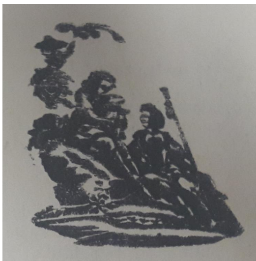
Obrázek 13 Ukázka obrázku z písně pro naši mládež, všem dívkám ku povšimnutí o nevěrném milenci

obrázek., který se nachází na titulní straně a znázorňuje dvě sedící rozmlouvající postavy. Obě dvě postavy sedí nejspíš na kopci, skále či balvanu. Jedna postava představuje ženu v chudých šatech a druhá postava představuje muže oblečeného do slušných šatů. Obě postavy se na sebe dívají. Obrázek není moc zřetelný, ale pravděpodobně žena svírá v náruči malé dítě zavinuté v dece. Muž v rukou svírá pravděpodobně strunný hudební nástroj, který připomíná kytaru. Obrázek postav je zakomponován v přírodní krajině, postavy se tedy nachází v obložení keřů a květin. Pod tímto obrázkem se nachází věta „Patisk se zakazuje.“