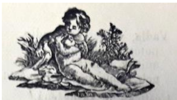
Obrázek 4 Ukázka z písně o žalostné a pravdivé události, kterak bezdětná žena, láskou šílená uškrtila nevinného synáčka svého vlastního manžela

Text kramářské písně se dělí na 27 slok, které jsou označeny číslicemi. Jednotlivé sloky se rýmují a jsou od sebe odděleny mezerou a číslicí. Kramářská píseň nemá refrén. Text je v rozsahu 5 stran, strany nejsou nijak označeny. Pod poslední slokou se objevuje čára, která pouze odděluje text písně od textu, který informuje o nakladatelství, není z pohledu tématu práce přínosem, proto zde není uvedena. Kramářský tisk obsahuje pouze jeden obrázek, který se nachází na titulní straně. Obrázek je malého rozměru a málo zřetelný, pravděpodobně znázorňuje malého uškrceného chlapce. Tento obrázek také připomíná anděla anebo nahou ženu. Postava má zamýšlený, smutný výraz v tváři a leží nejspíš na kamenném podkladu, může to být skála, nebo velký balvan. Obrázek postavy je zakomponován do přírody, přičemž se tedy postava nachází v obložení keřů a květin.