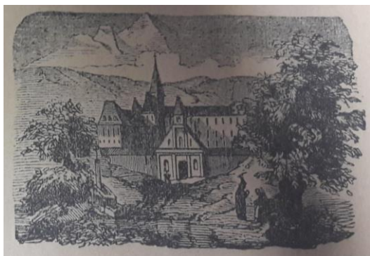
Obrázek 21 Obrázek z písně: O nezdárném synu

Text se nedělí na sloky a je psán jako popis události. Kramářský tisk je v rozsahu 3 stran, strany nejsou nijak označeny. Text obsahuje jeden obrázek, který se nachází na titulní straně pravděpodobně znázorňuje vesnici s kostelem. Na obrázku jsou zobrazeny dvě pracující osoby, u kterých nelze určit jejich pohlaví.