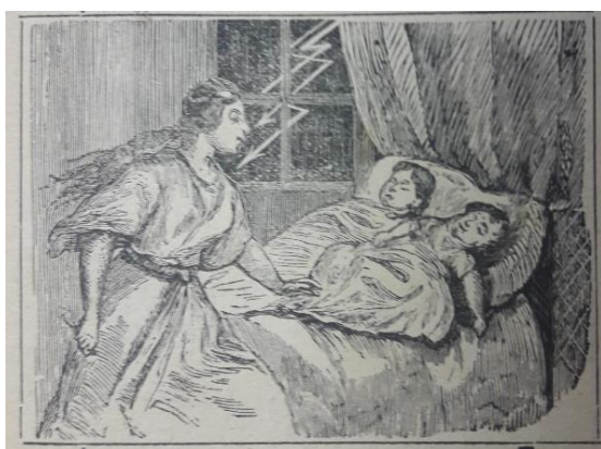
Obrázek 6 Ukázka obrázku z titulní strany písně o přehrozné a strašlivé bouři, krupobití a povodni v Jižních Čechách, u města Přeštic v kraji Plzeňském dne 16. května 1889

Text kramářské písně se dělí na 13 slok, které jsou označeny číslicemi. Jednotlivé sloky se rýmují a jsou od sebe odděleny mezerou a číslicí. Refrén se v této kramářské písni nevyskytuje. Kramářská píseň se rozkládá na třech stranách. Kramářský tisk nekončí písni, ale vylíčením. Tomu jsou věnovány čtyři strany, které slouží k vylíčení události, tedy stručným popisem události, který se nerýmuje. Kramářský text je tedy v celkovém rozsahu sedm stran, strany nejsou nijak označeny. Pod poslední slokou se objevuje ozdobný ornament. Text obsahuje celkem pět obrázků. První obrázek se nachází na titulní straně. Obrázek znázorňuje dlouhovlasou ženu, nejspíše z movitější rodiny. Žena utěšuje dvě spící děti, které spokojeně spí na jedné posteli. Postel působí honosným dojmem. Na obrázku lze spatřit velké okno, za nímž se bouří obloha a z obrázku je patrné, že se počasí v blízké době neslituje a bude pršet dál.