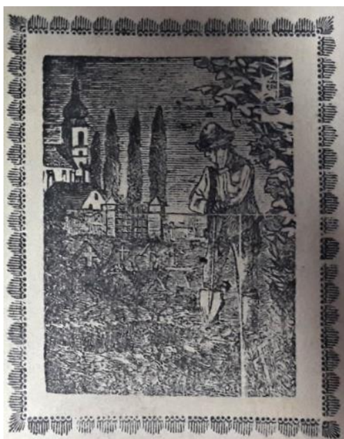
Obrázek 18 Obrázek truchlícího muže

Na obrázku je vyobrazen jeho smutek, přesto je mladík hezky oblečený. Hlavu mu zdobí klobouk, je ustrojen do bílé košile s vestičkou, dále má oblečené tmavé kalhoty. V rukou drží rýč a kope jámu. V pozadí je vidět malebný kostel a márnice. Vedle kostela se tyčí 4 vysoké topoly. Hřbitov je ohraničen kamenným plotem s velkou ozdobnou bránou. Celý obrázkový výjev je ozdobně orámován. Rámeček je skládán z ozdobných teček a čar, které tvoří vlnky.