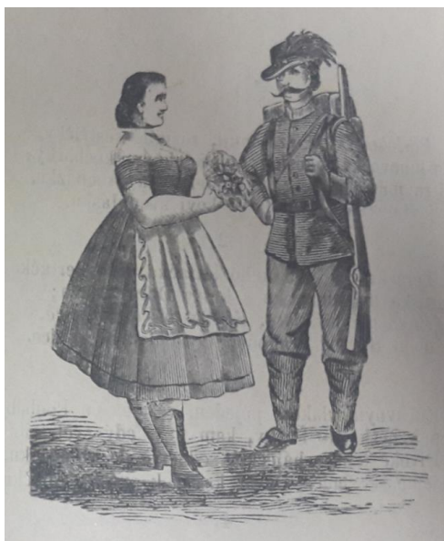
Obrázek 12 Chudé děvče a voják

Text obsahuje jeden obrázek, který se nachází na titulní straně a znázorňuje chudou dívku a vojáka.