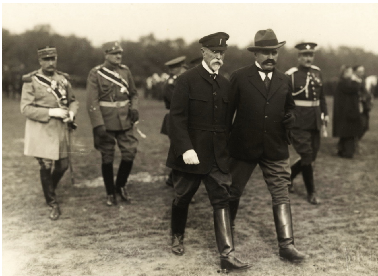
Obrázek č. 1. Prezident republiky Tomáš Garrigue Masaryk v doprovodu ministra národní obrany Františka Udržala při příležitosti jubilejní přehlídky československé branné moci 28. října 1928 v Praze na Vypichu. [cit. 2018-07.05]. URL: < http://www.vhu.cz/ministr-narodni-obrany-frantisek-udrzal/ >.