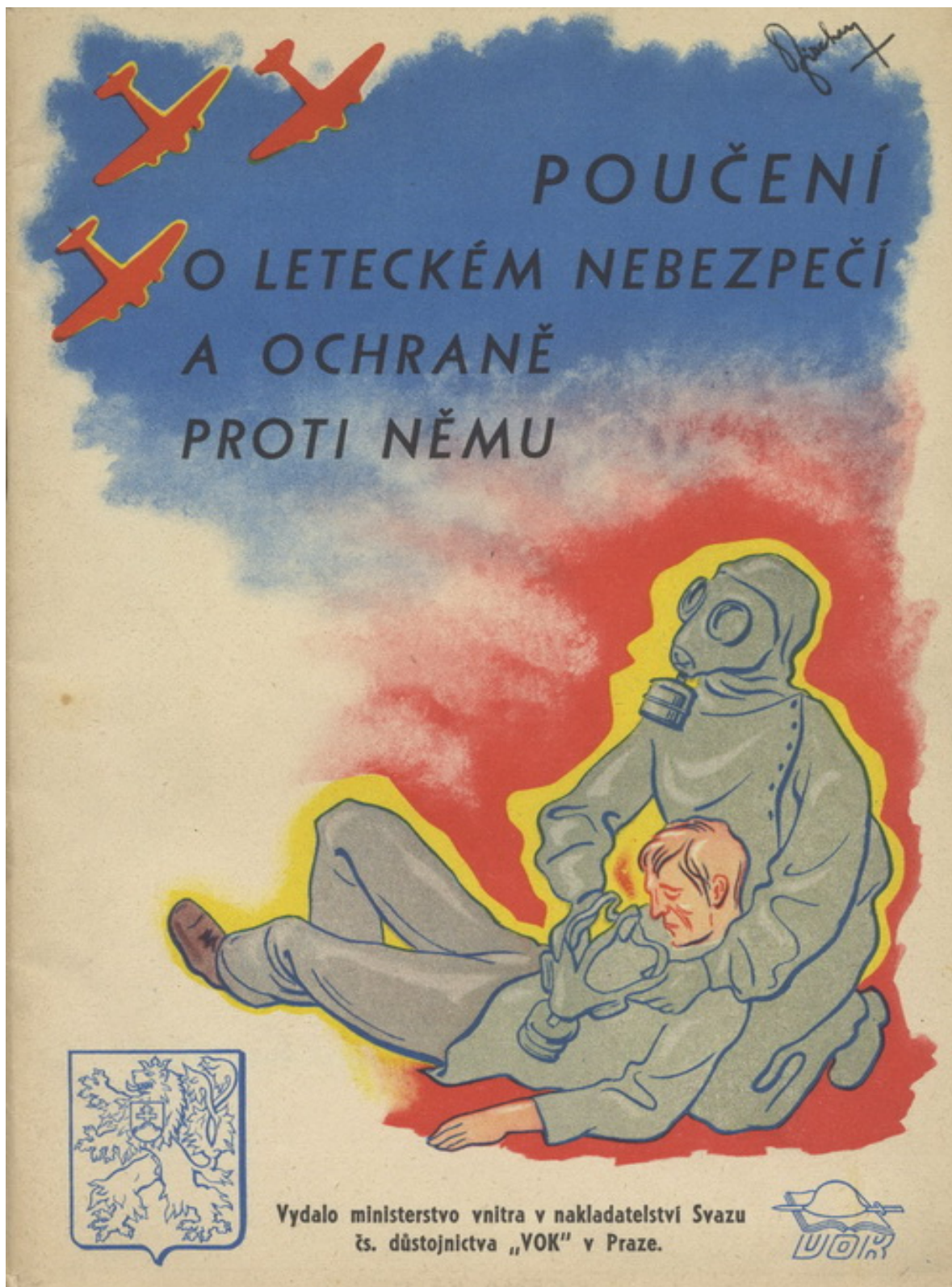
Obrázek č. 5. V roce 1936 se rozvíjel systém Civilní protiletecké ochrany. Tato organizace s celospolečenským branným dosahem byla uzákoněna o rok dříve.