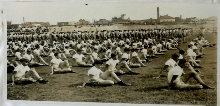
Obrázek č. 8. Dne 7. června 1936 proběhl Den brannosti v Pardubicích, kterého se účastnili žáci Obecné školy chlapecké na Novém městě. Pamětní kniha Obecné školy chlapecké na Novém městě v Pardubicích. Pardubice, 1930. SOkA Pardubice.

„Hoši v autickém sedlu - přiběhnouší děvčátka pozdravují.“