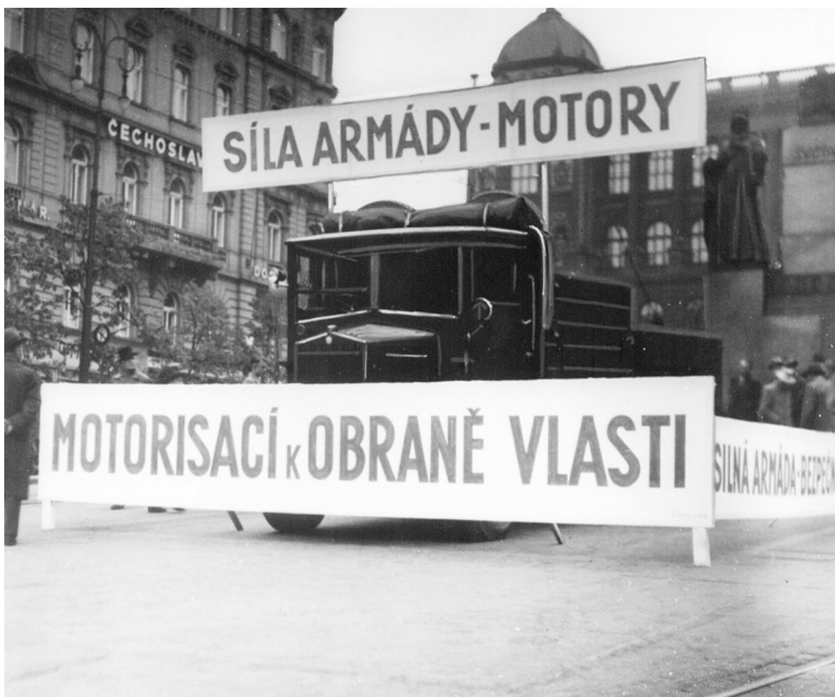
Obrázek č. 3. Čs. branná propaganda vyzývala veřejnost k aktivnímu zájmu o vojenské zabezpečení republiky. Již v roce 1935 mohli občané přispívat na národní sbírku motorizace k obraně vlasti. Na akce tohoto typu navázala v roce 1936 Půjčka na obranu státu.