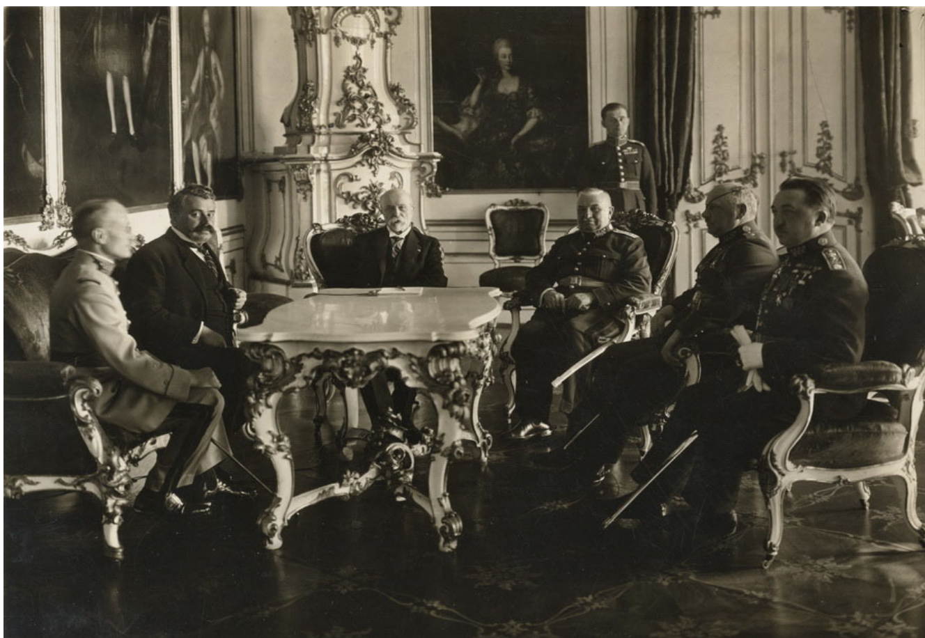
Obrázek č. 2. Audience nejvyšších činitelů československé branné moci, uspořádaná při příležitosti 78. narozenin prezidenta republiky Tomáše Garrigua Masaryka 8. března 1928 na Pražském hradě. Přítomni jsou zleva gen. Louis-Eugène Faucher, náčelník Francouzské vojenské mise v Československé republice, František Udržal, ministr národní obrany, T. G. Masaryk, gen. Alois Podhajský, generální inspektor branné moci, gen. Jan Syrový, náčelník Hlavního štábu a gen. Stanislav Čeček, přednosta Vojenské kanceláře prezidenta republiky.