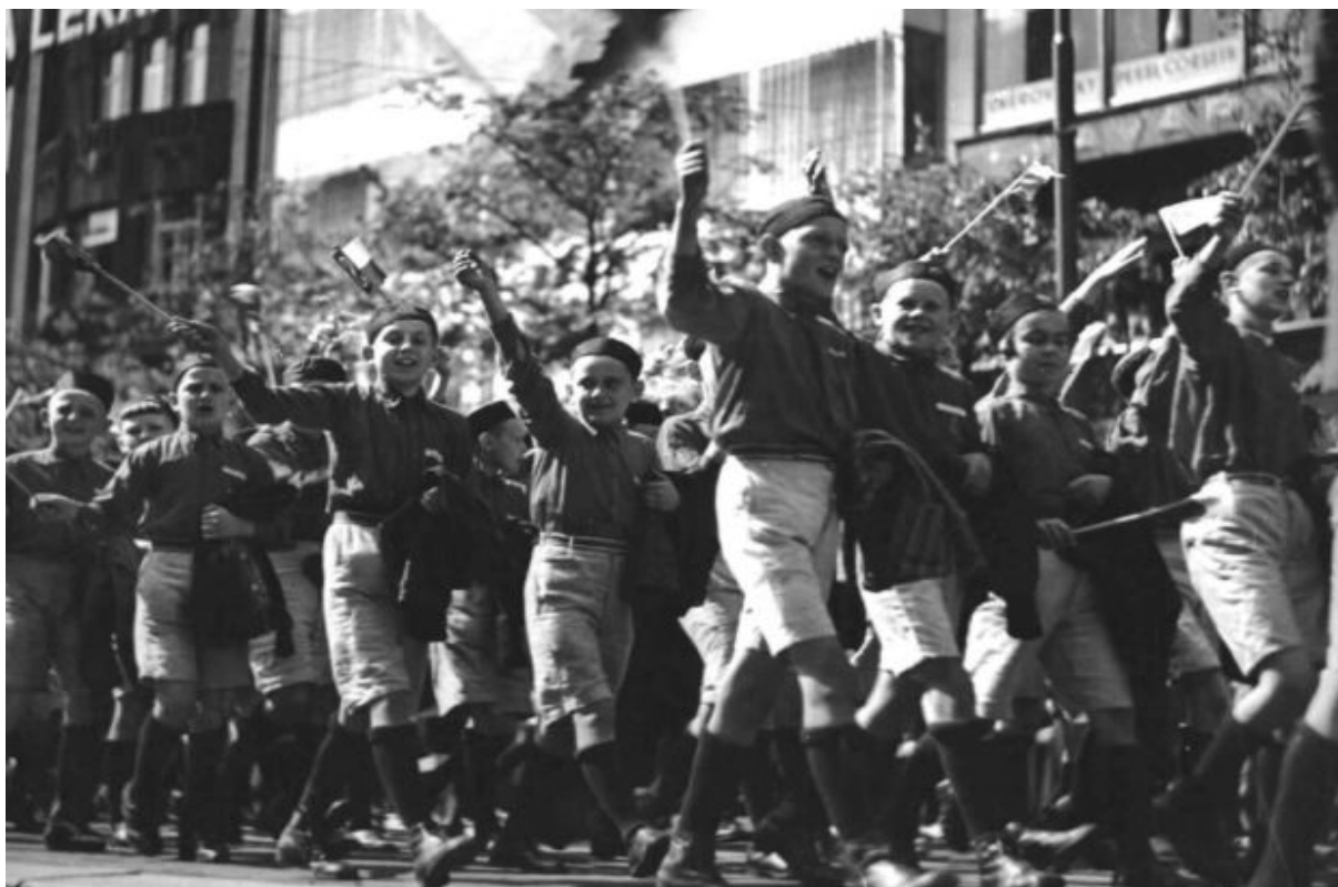
Obrázek č. 6. a 7. Průvod chlapců a průvod dívek byl součástí dění X. všesokolského sletu v roce 1938. [cit. 2018-08.05]. URL: < https://www.rozhlas.cz/archiv/reportaze-politika/_zprava/dobudujeme-a-ubranime-aneb-vsesokolsky-slet-vestinu-nemecke-expanze-1938--1672621/ >