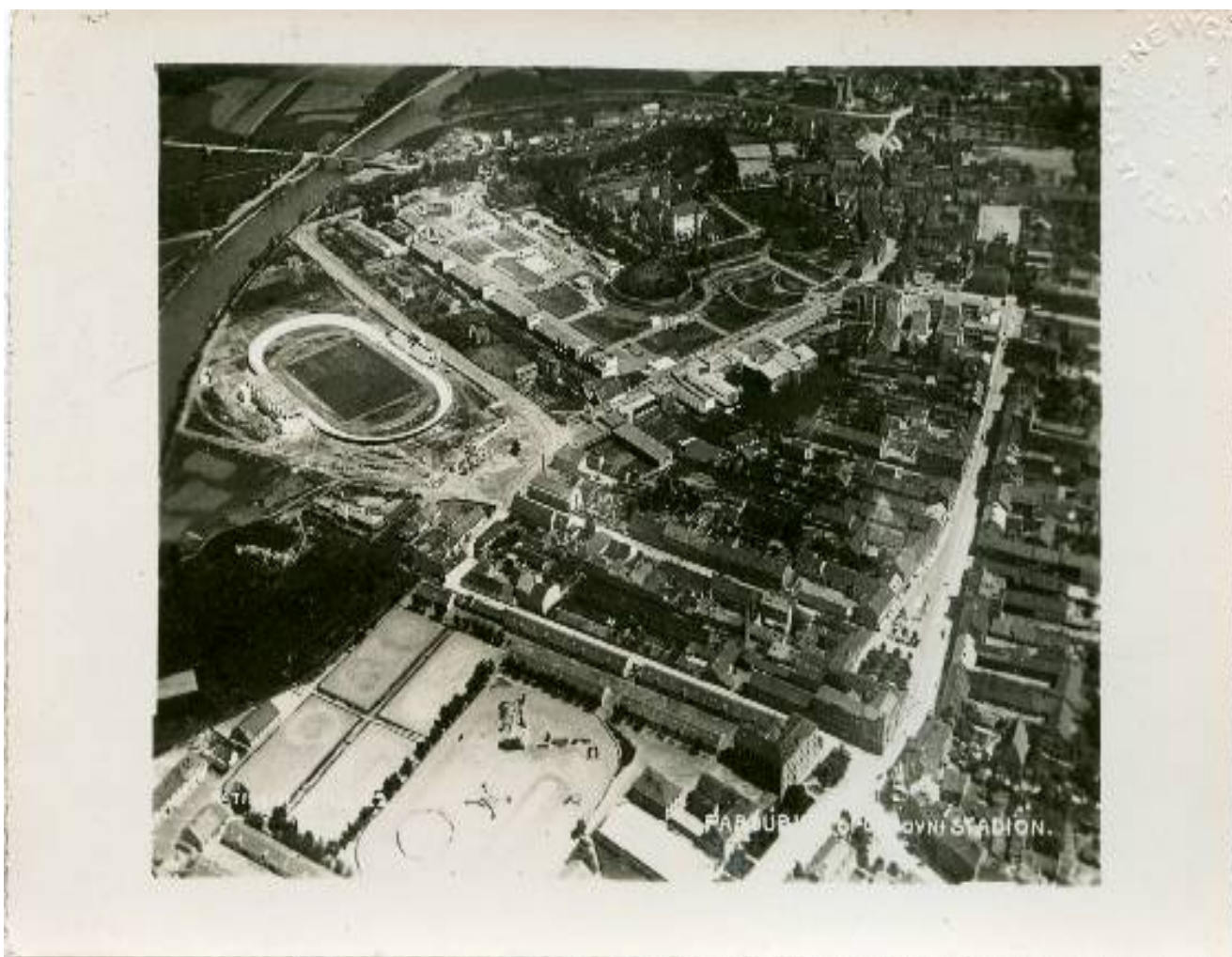
Obrázek č. 4. Pohled na Letní stadion a přilehlé výstaviště Výstavy tělesné výchovy a sportu ČSR v Pardubicích v roce 1931. Inventární č.: PO-P1-335.