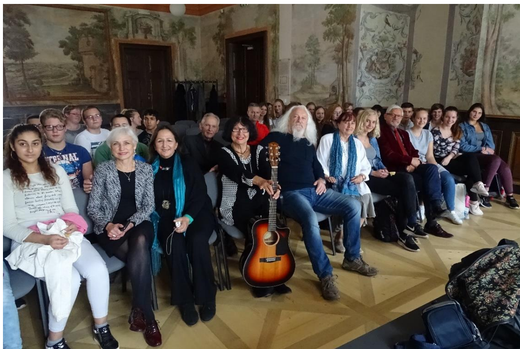
Obr. č. 1 - Dny poezie v Broumově 2018