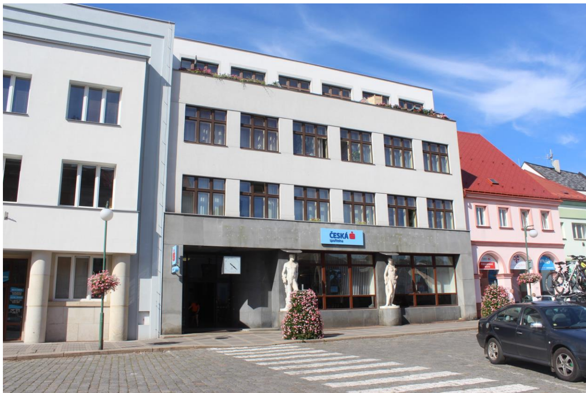
Obrázek 16. Okresní záložna hospodářská – Nová Paka, Masarykovo náměstí