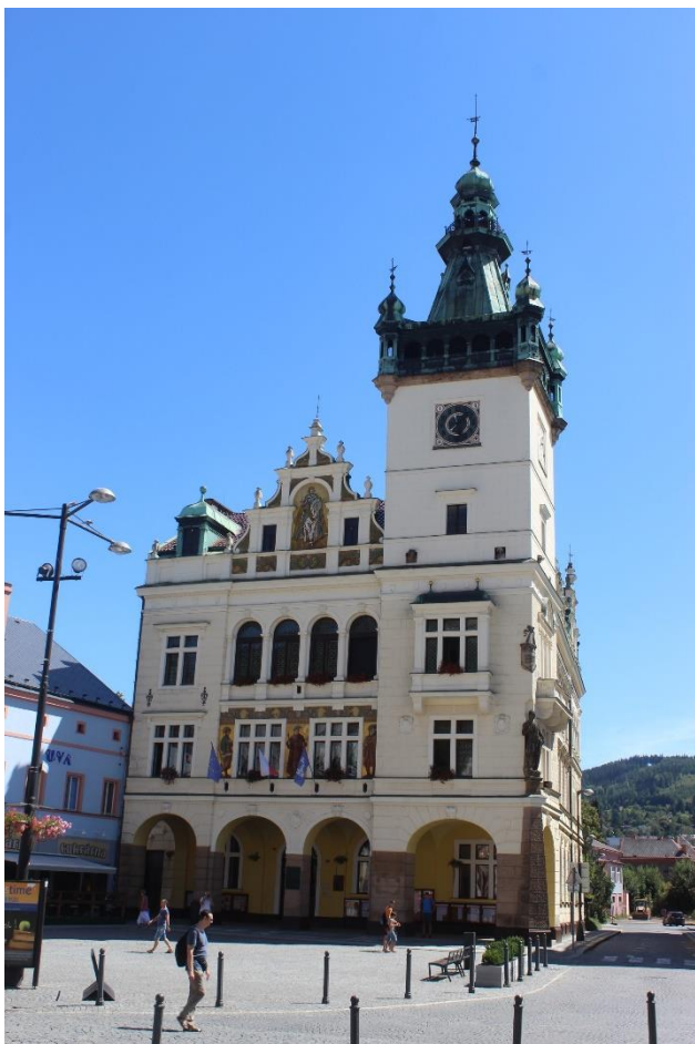
Obrázek 25. Nová radnice - Náchod, Masarykovo náměstí čp. 40