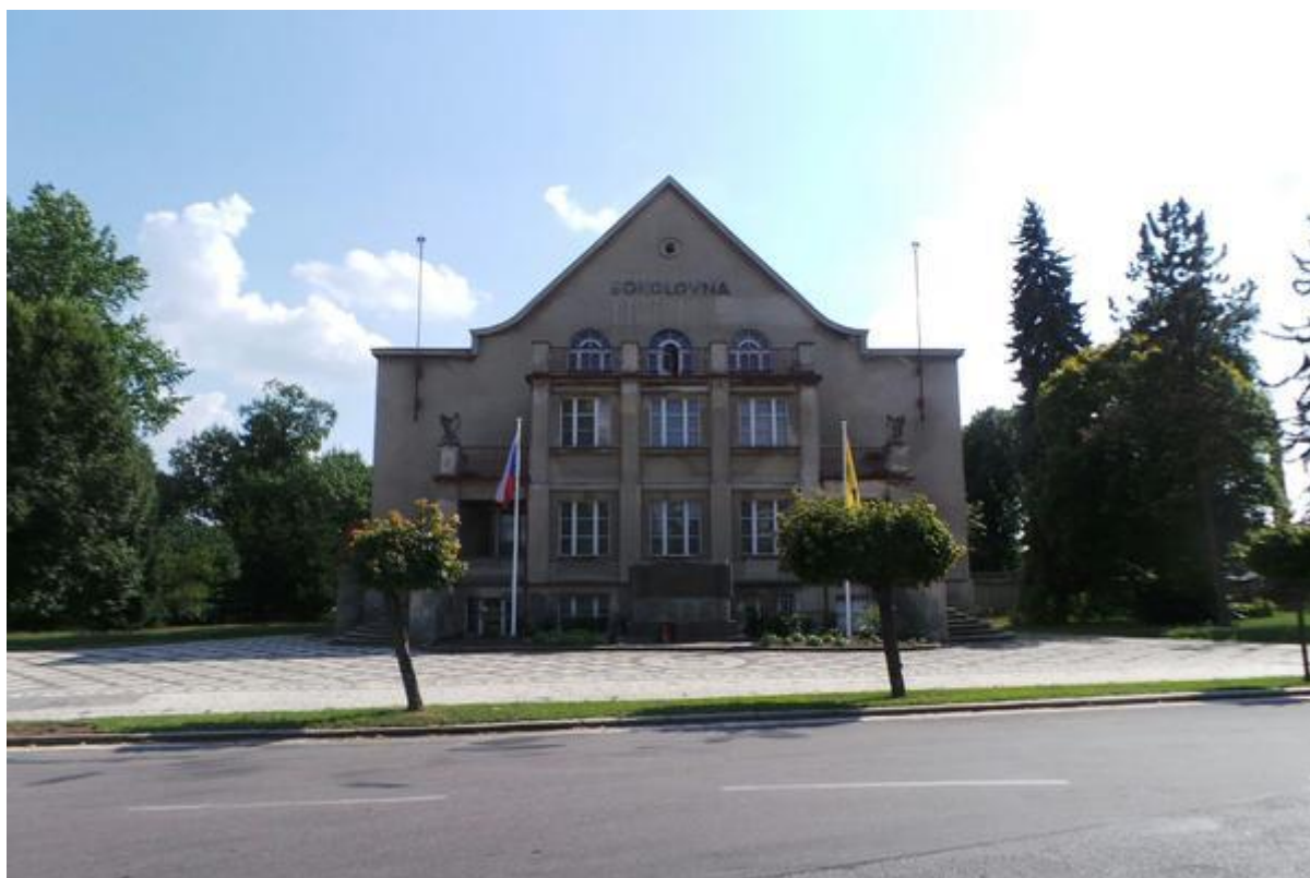
Obrázek. 30. Sokolovna – Třebechovice pod Orebem, Heldovo náměstí čp. 574