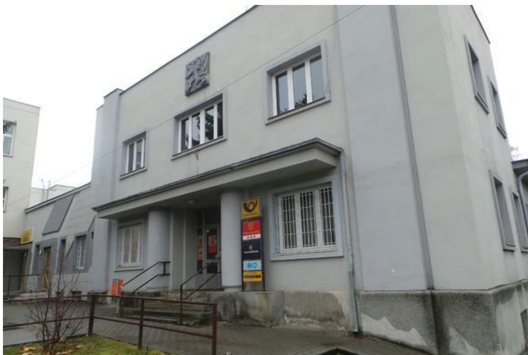
Obrázek 20. Poštovní a telegrafní úřad – Kostelec nad Orlicí, Dukelských hrdinů čp. 900