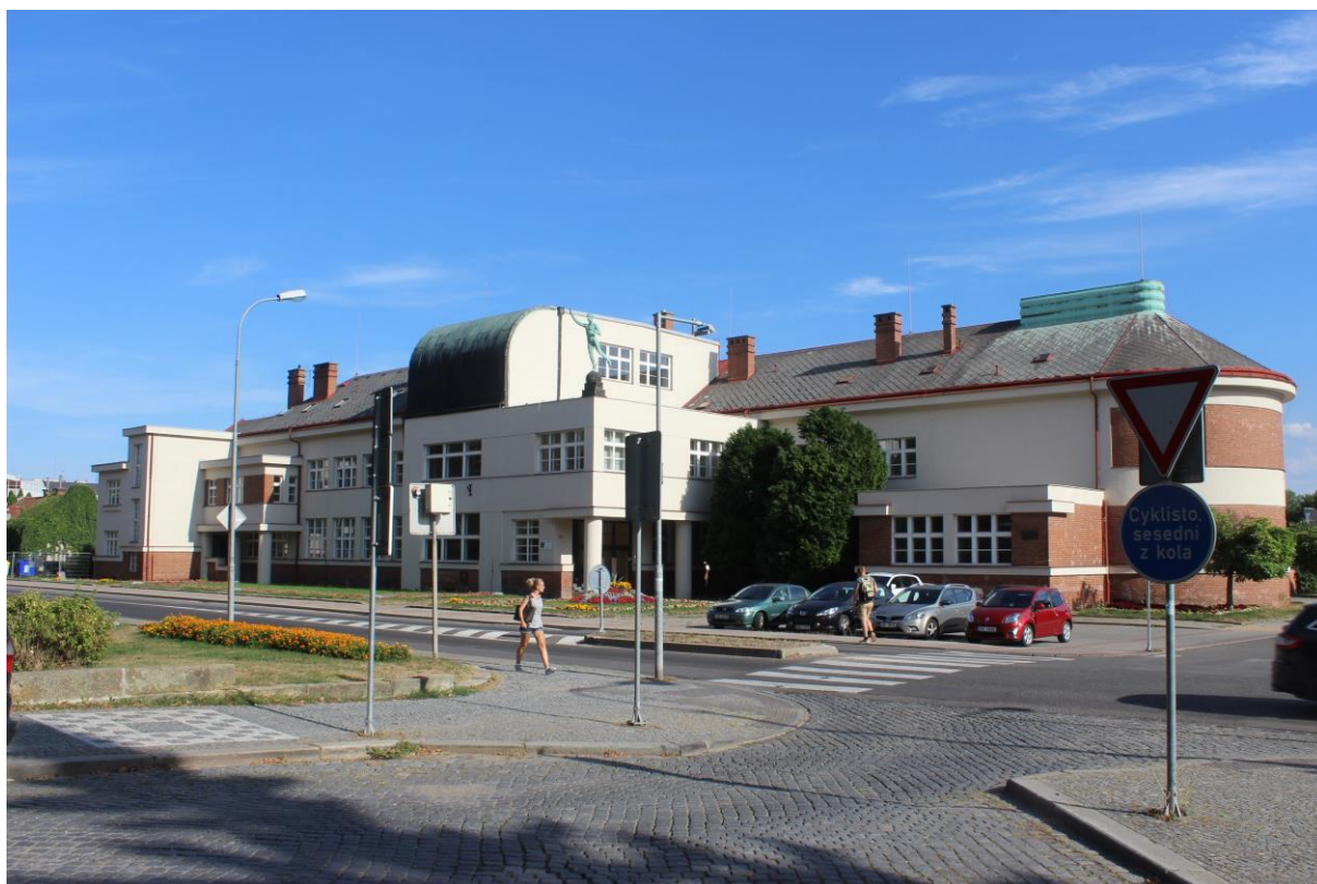
Obrázek 40. Masarykova obchodní škola – Jičín, Třída 17. listopadu čp. 220