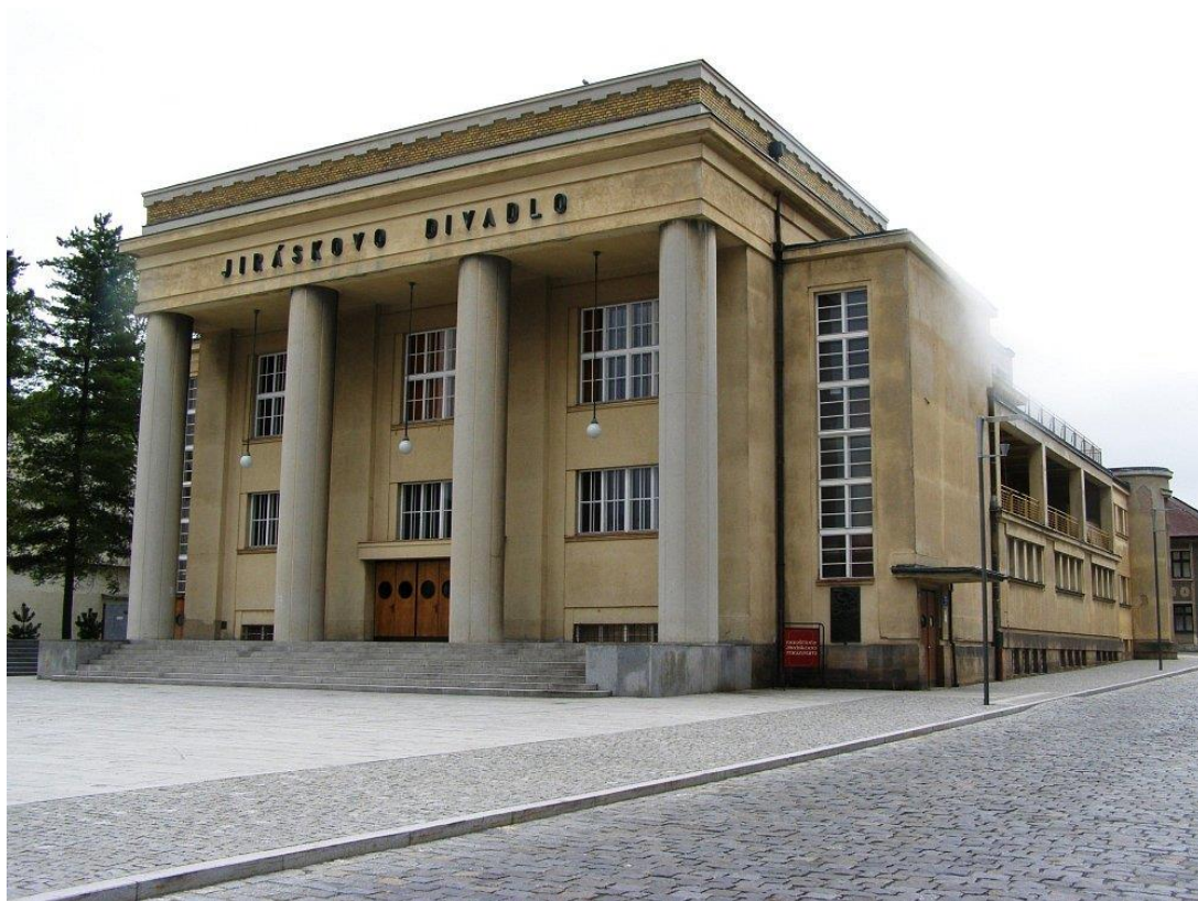
Obrázek 4. Jiráskovo divadlo – Hronov, náměstí Čs. armády čp. 500