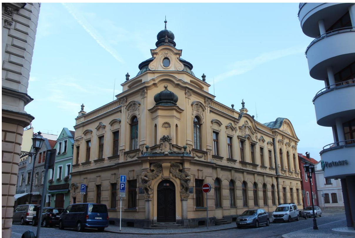
Obrázek 10. Záložní a úvěrní ústav – Hradec Králové, Tomkova čp. 177