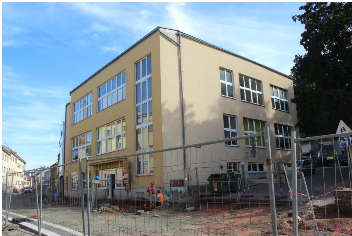
Obrázek 21. Poštovní a telegrafní úřad – Nová Paka, Komenského čp. 313