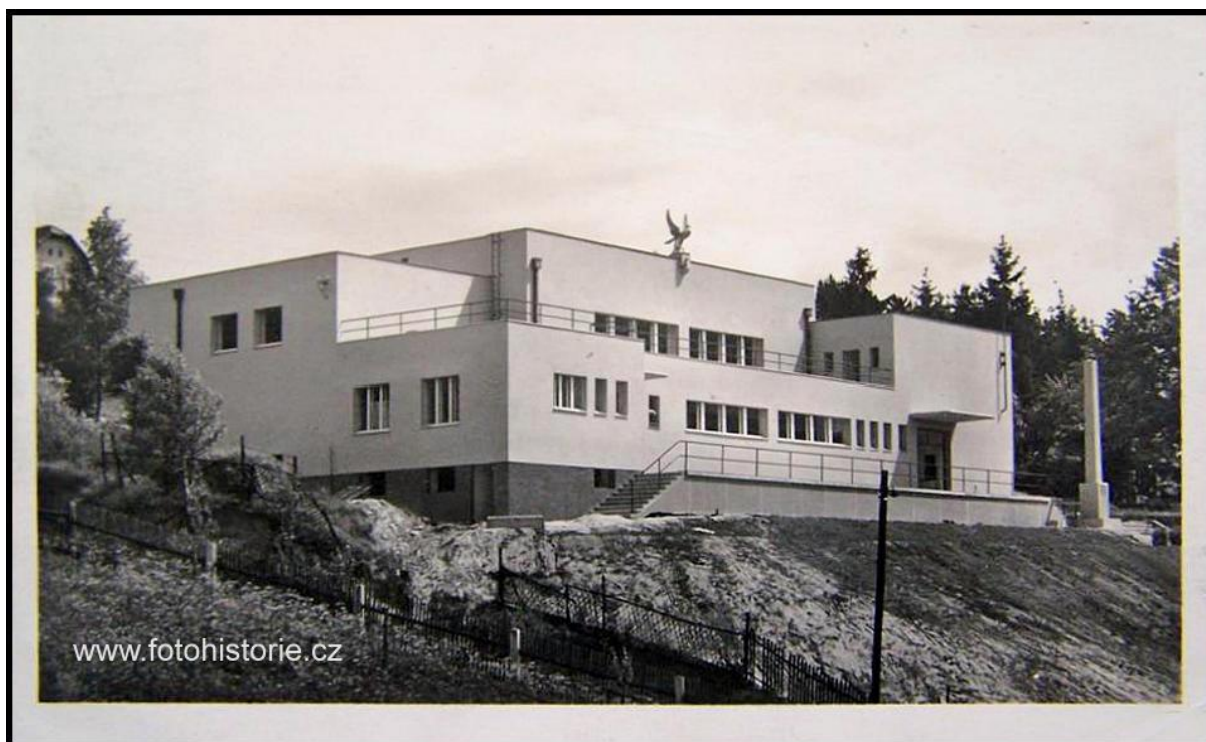
Obrázek. 34. Sokolovna – Hronov, Palackého čp. 575