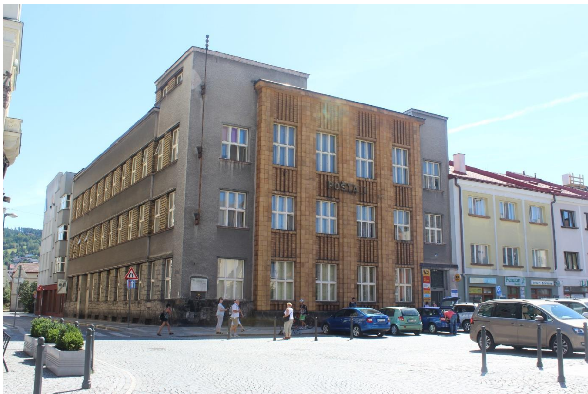
Obrázek 22. Poštovní a telegrafní úřad – Náchod, Masarykovo náměstí čp. 43