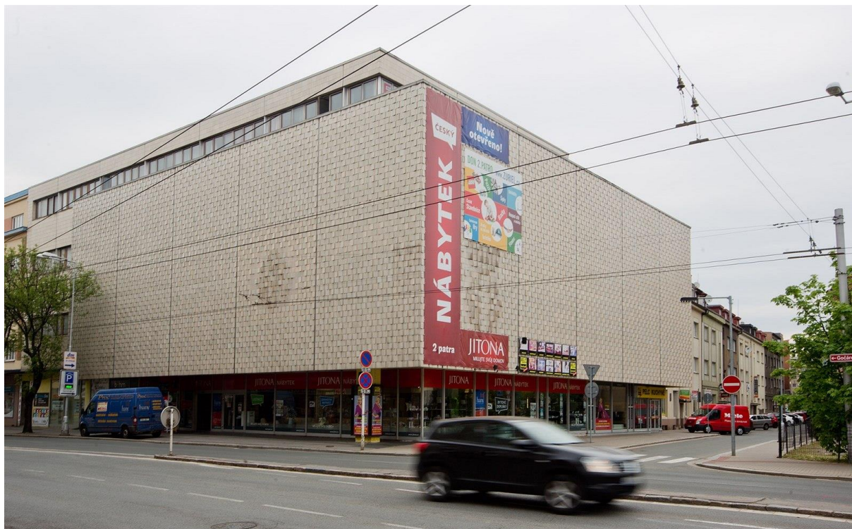
Obrázek 9. Módní dům Don – Hradec Králové, Gočárova třída čp. 1517