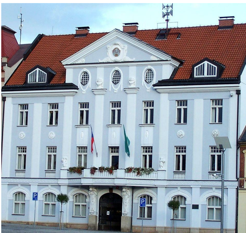
Obrázek 20. 28. Nová radnice – Dvůr Králové nad Labem, Masarykovo náměstí čp. 38