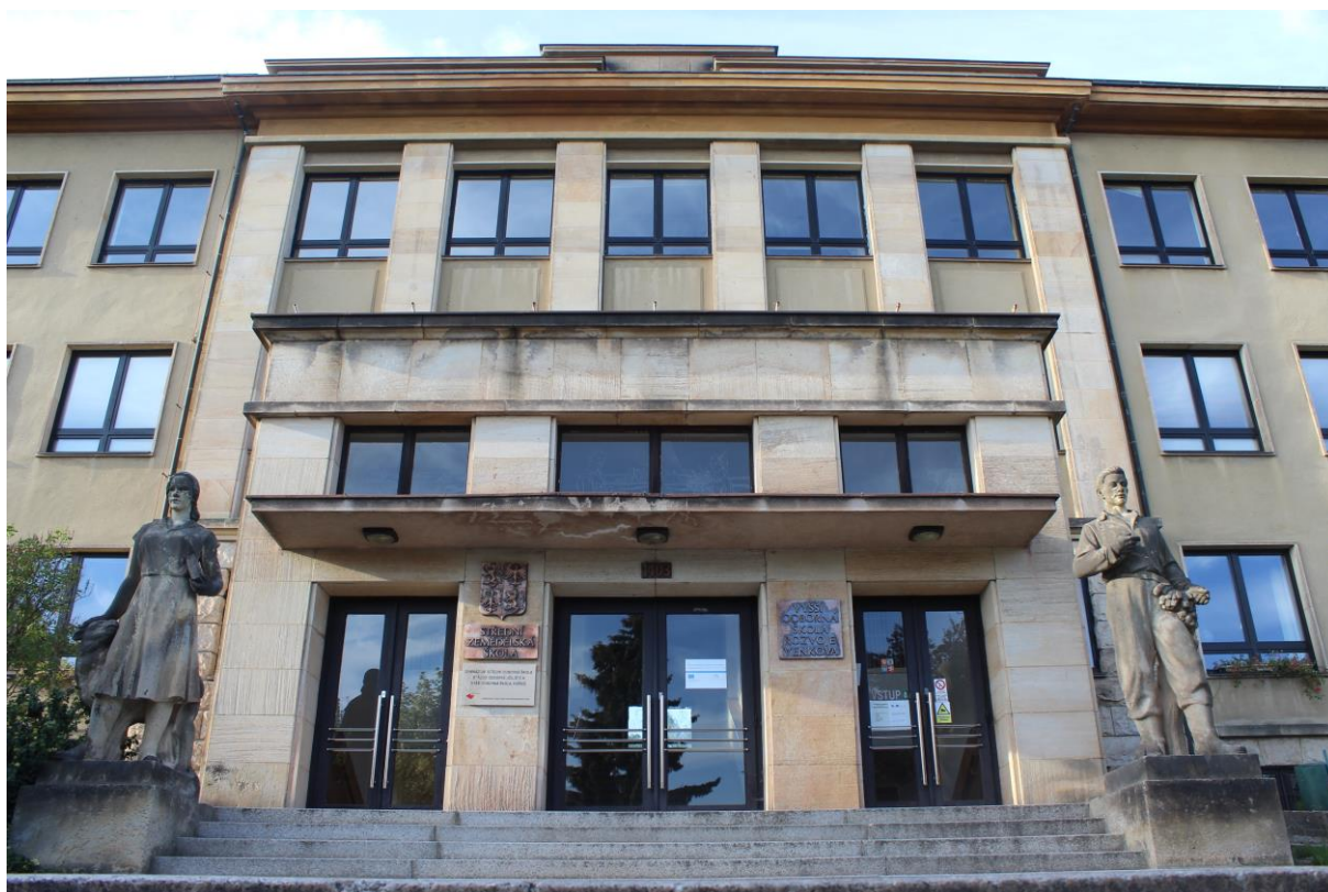
Obrázek 41. Masarykova obchodní škola – Jičín, Třída 17. listopadu čp. 220