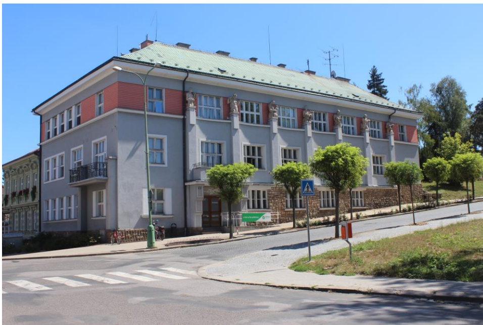
Obrázek 13. Okresní nemocenská pojišťovna - Jaroměř, Edvarda Beneše čp. 191