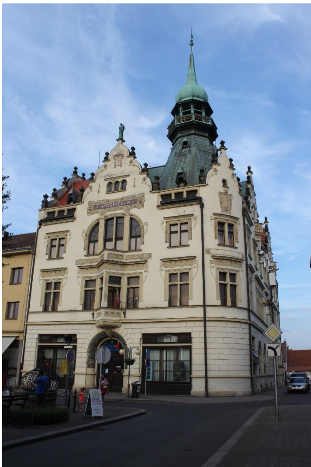
Obrázek 11. Městská spořitelna – Nový Bydžov, Masarykovo náměstí čp. 507