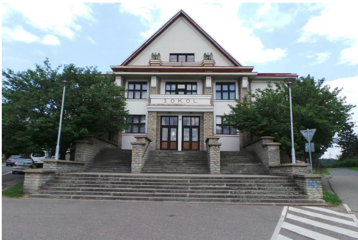
Obrázek. 33. Sokolovna – Nové Město nad Metují, Přibyslavská čp. 365