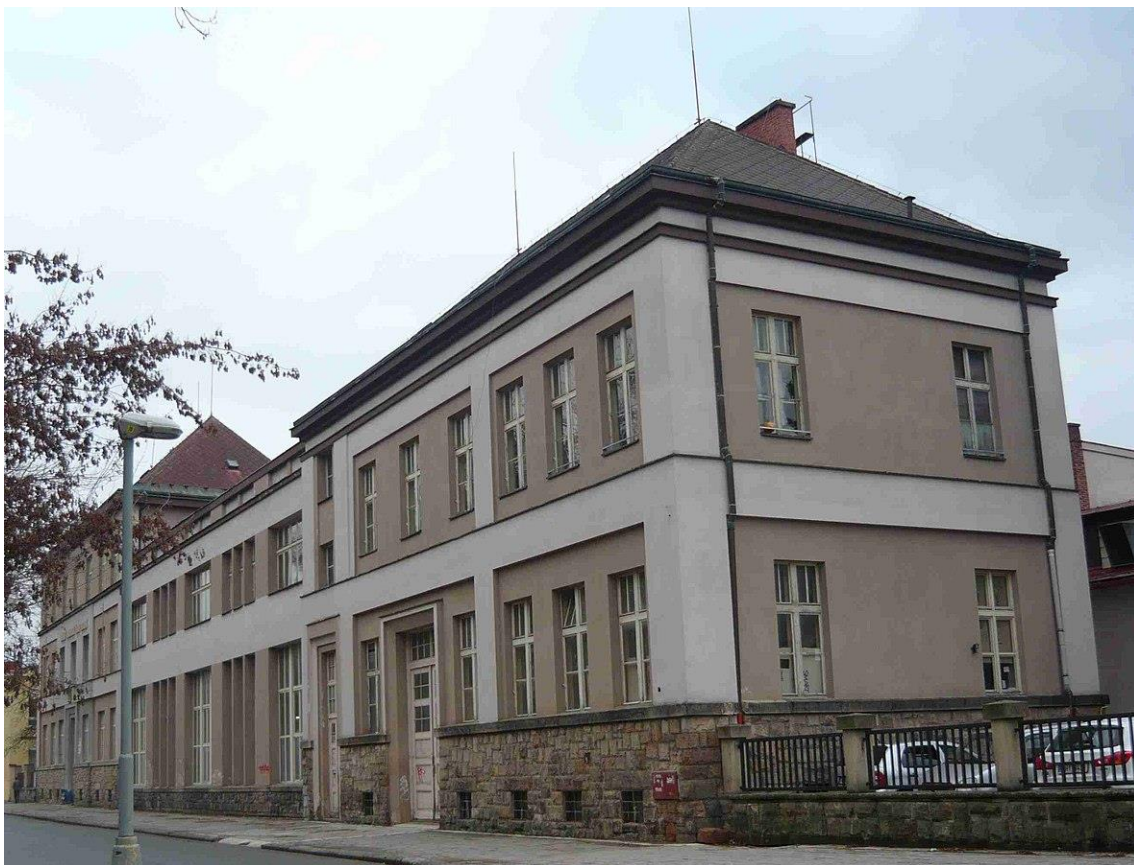
Obrázek 24 37. Škola průmyslová textilní – Dvůr Králové nad. Labem, Nábřeží Jiřího Wolkera čp. 123