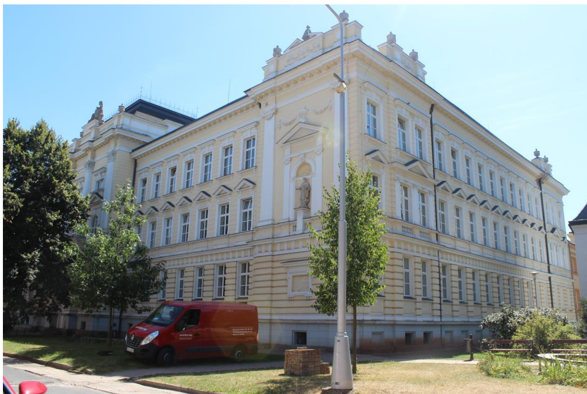
Obrázek 35. Obecní reálná škola, dnes Jiráskovo gymnázium – Náchod, Řezníčkova čp. 451