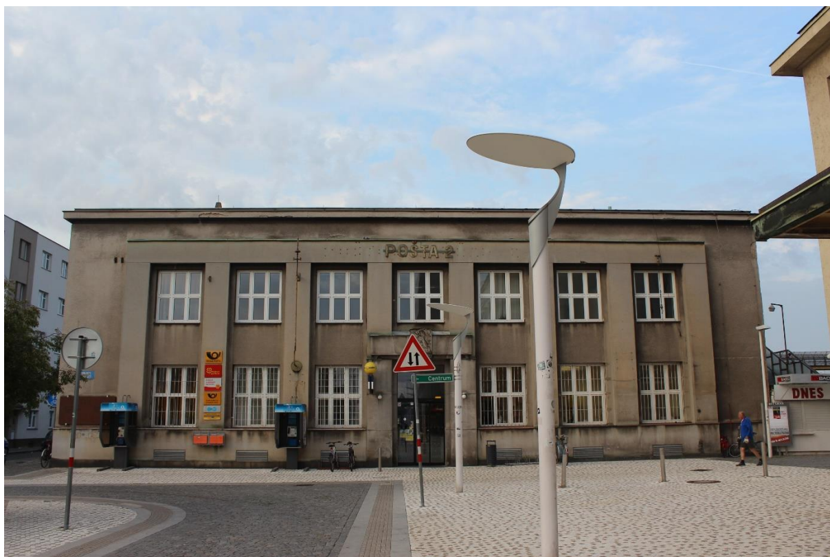
Obrázek 23. Poštovní a telegrafní úřad – Hradec Králové, Riegrovo náměstí čp. 915