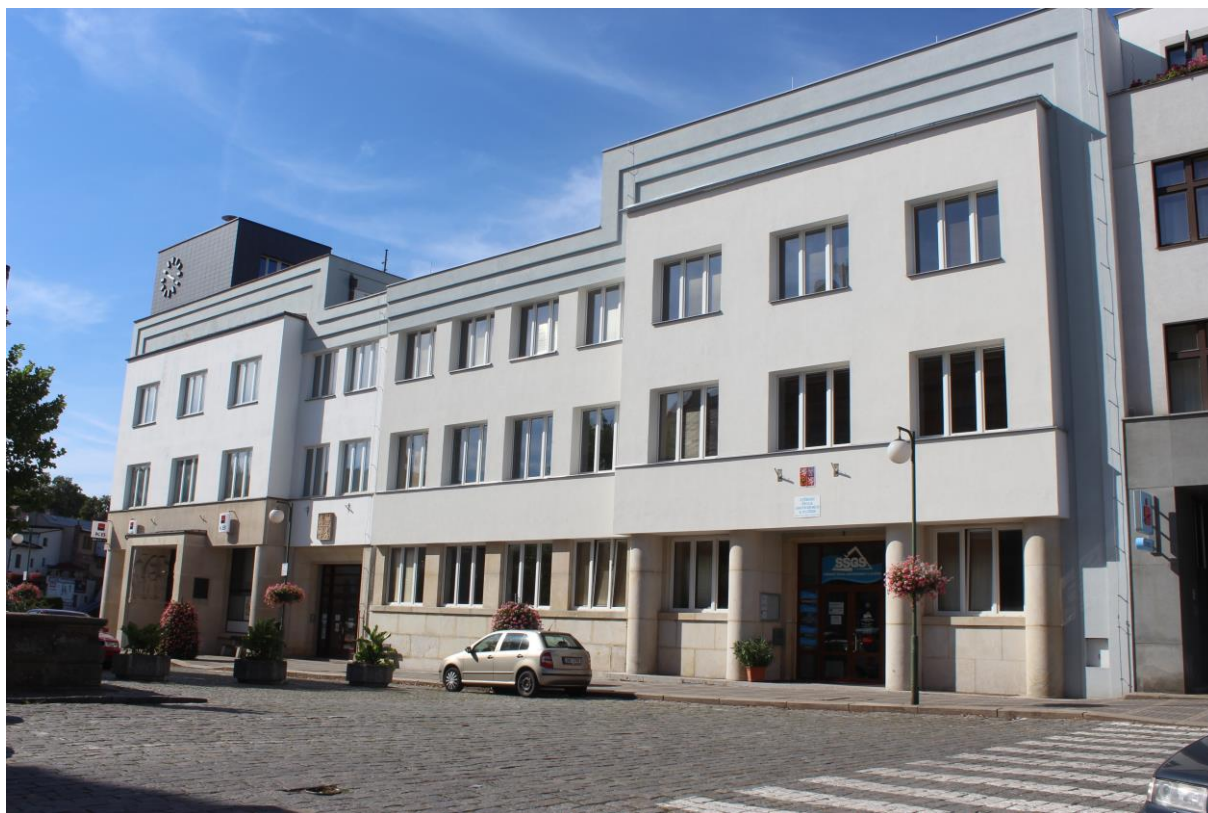
Obrázek 29. Budova Městské spořitelny s radnicí a městským úřadem – Nová Paka, Masarykovo náměstí čp. 1, 2

nov%C3%A1, n%C3%A1m. T. G. Masaryka 38, Dv%C5%AFr Kr%C3%A1lov%C3%A9 nad Labem.jpg)d)