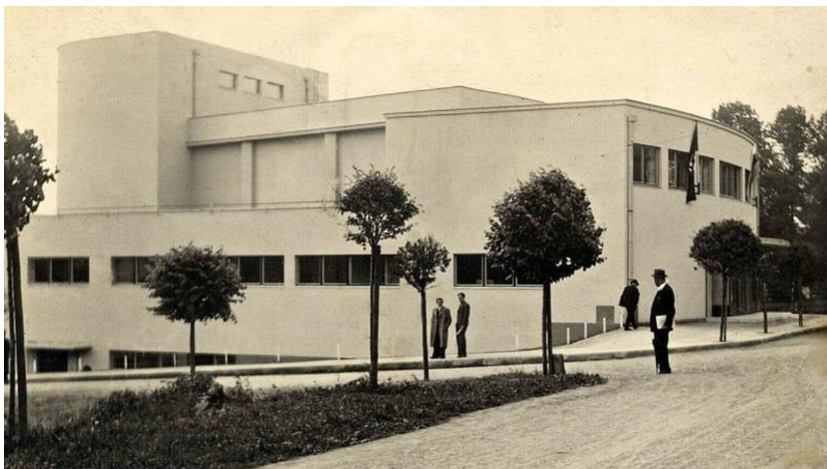
Obrázek 5. Kollárovo divadlo – Police nad Metují, Jiráskova čp. 151