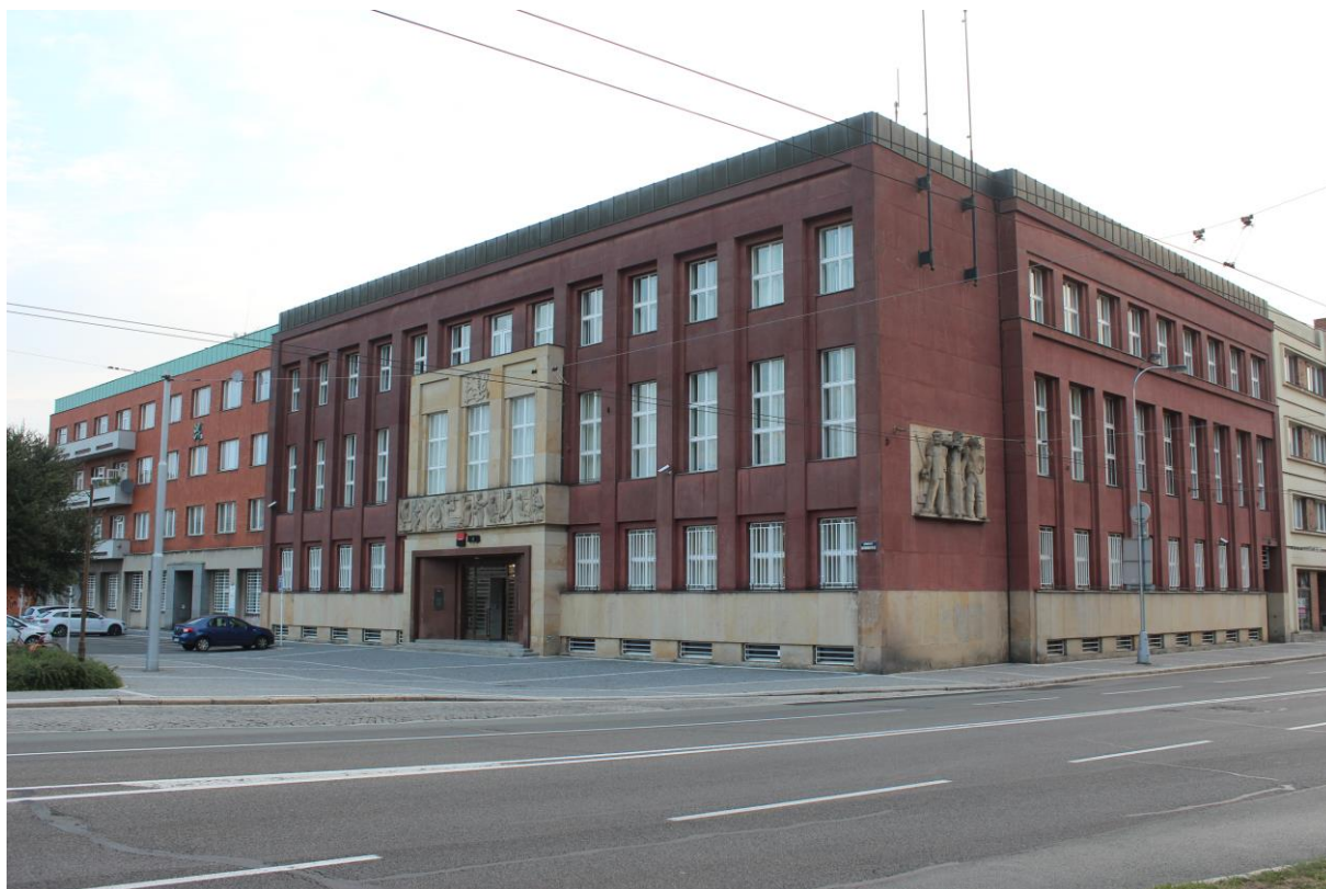
Obrázek 17. Národní banka československá a okresní hospodářská záložna – Hradec Králové, náměstí osvoboditelů čp. 798 a 820