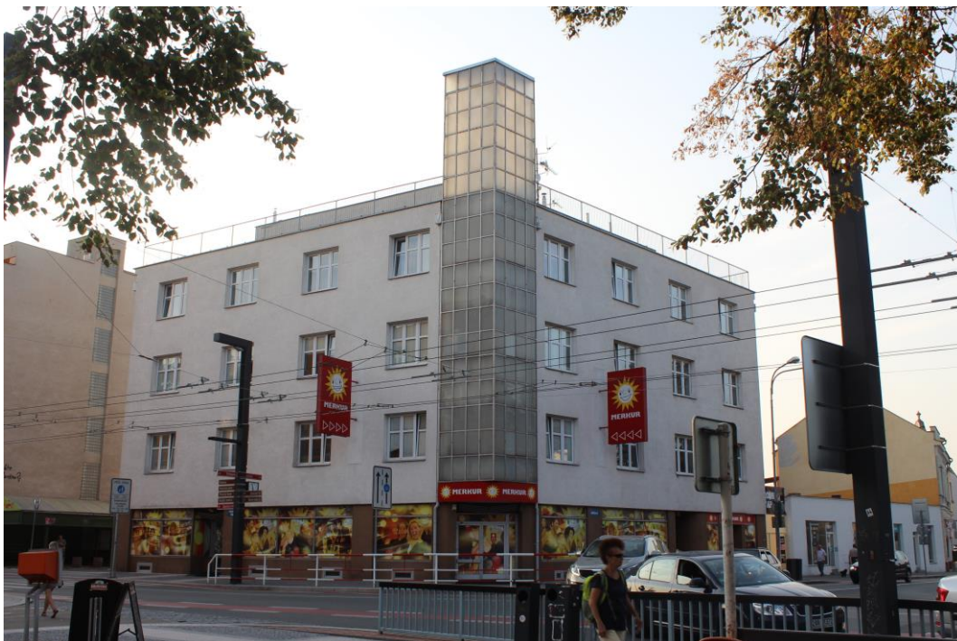
Obrázek 7. Obchodní a obytný dům, Dům u Skleněné věže - Hradec Králové, Dukelská čp. 21