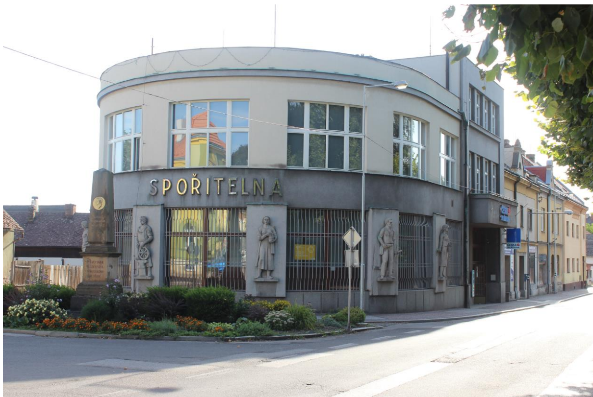
Obrázek 19. Okresní záložna hospodářská – Sobotka, ulice Jičínské čp. 420