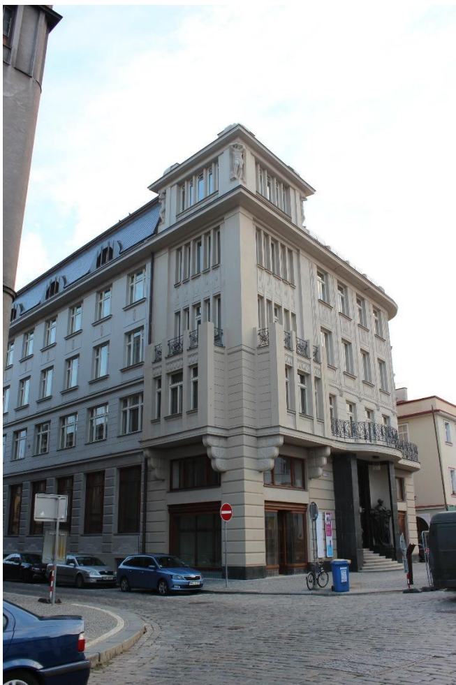
Obrázek 12. Záložní a úvěrní ústav – Hradec Králové, Velké náměstí čp. 139