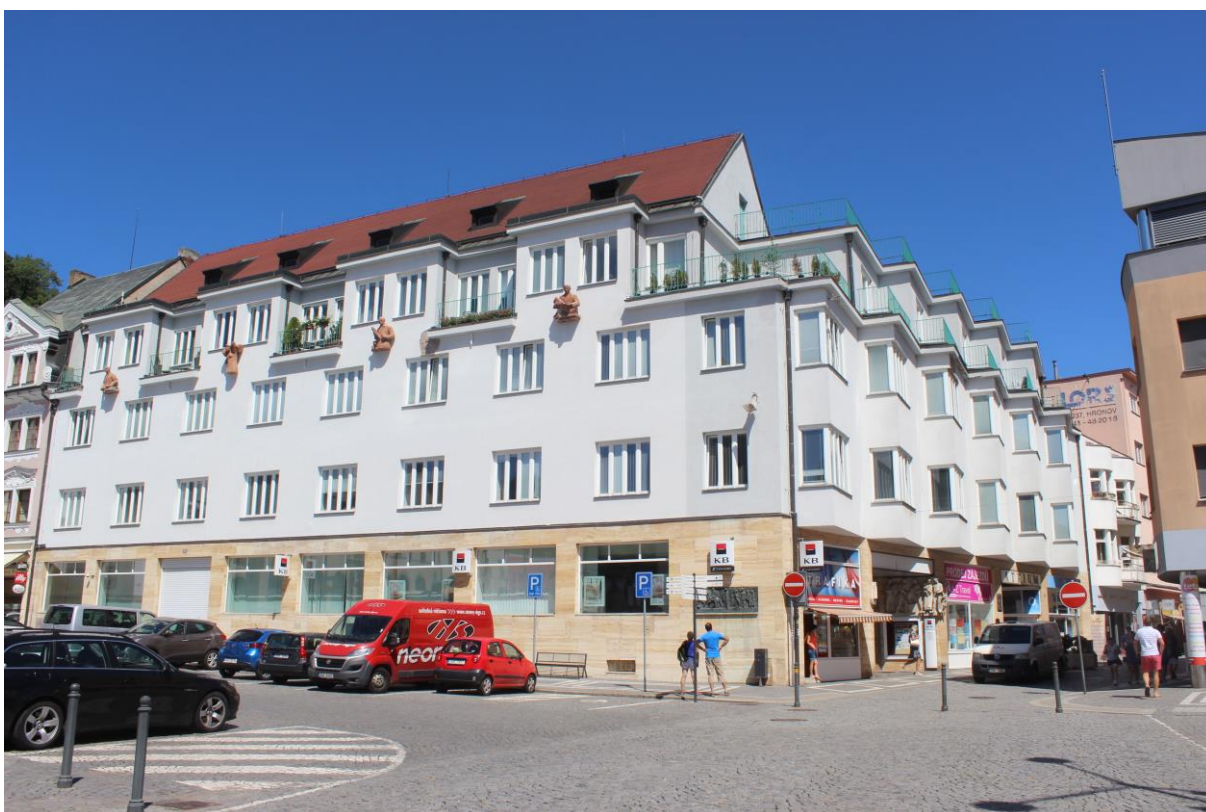
Obrázek 14. Dům městské spořitelny – Náchod, Palackého čp. 20