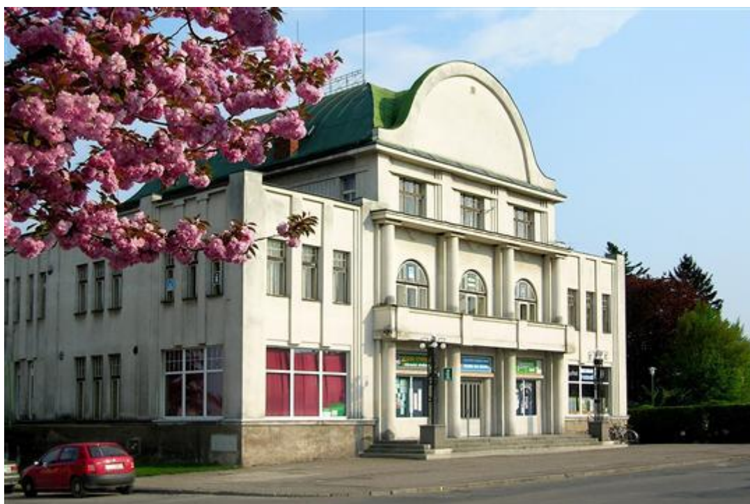
Obrázek 21. 31. Sokolovna – Chlumeck nad Cidlinou, Kozelkova čp. 26