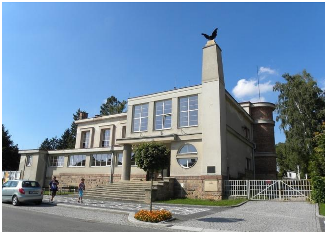
Obrázek 22. 32. Sokolovna – Lázně Bělohrad, Lázeňská čp. 295