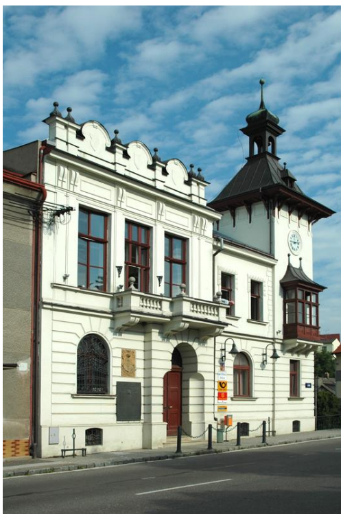
Obrázek 18. 26. Radnice – Krčín, 1. máje čp. 100