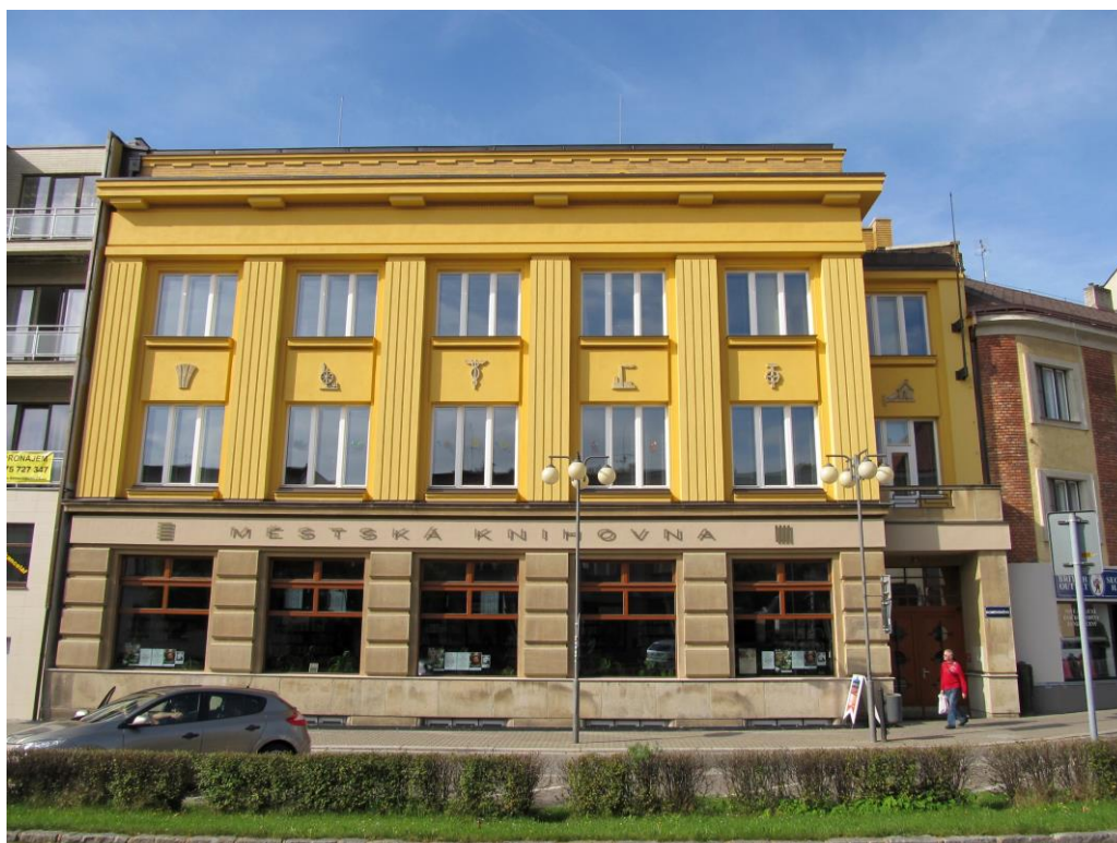
Obrázek 15. 16. Městská spořitelna – Nové Město nad Metují, Komenského čp. 30