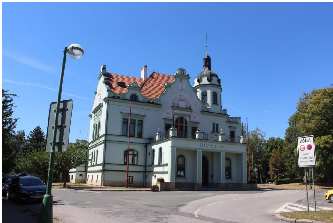
Obrázek 1. Budova sokolovny a divadla – Jaroměř, náměstí Dukelských hrdinů čp. 240