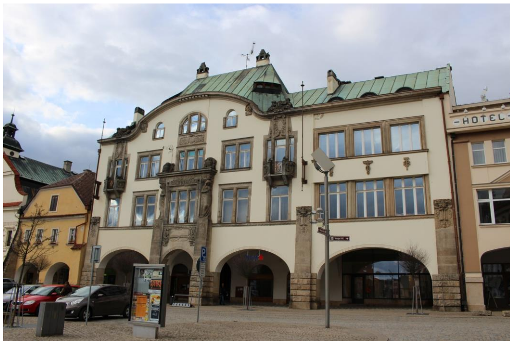
Obrázek 12. Budova Spořitelny královédvorské – Dvůr Králové nad Labem, náměstí T. G. Masaryka čp. 3