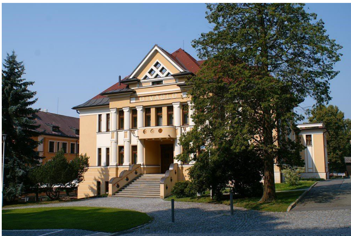
Obrázek 3. Divadlo J. K. Tyla – Červený Kostelec, Komenského čp. 537 (dostupné z: https://www.cervenykostelec.cz/budovy-a-verejne-prostory/divadlo-j-k-tyla )