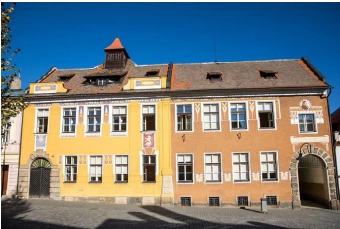
Obrázek 19. 27. Radnice – Opočno, Trčkovo náměstí čp. 11