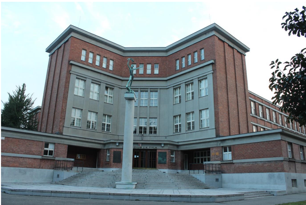
Obrázek. 39. Rašínovo reálné gymnázium dnes gymnázium J. K. Tyla – Hradec Králové, Tylovo nábřeží čp. 12