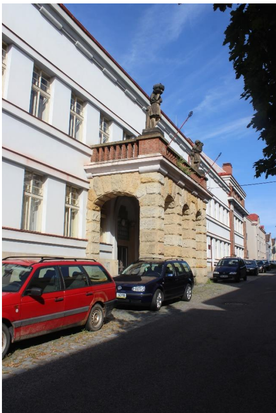
Obrázek 38. Hospodyňská škola – Jičín, Denisova čp. 212