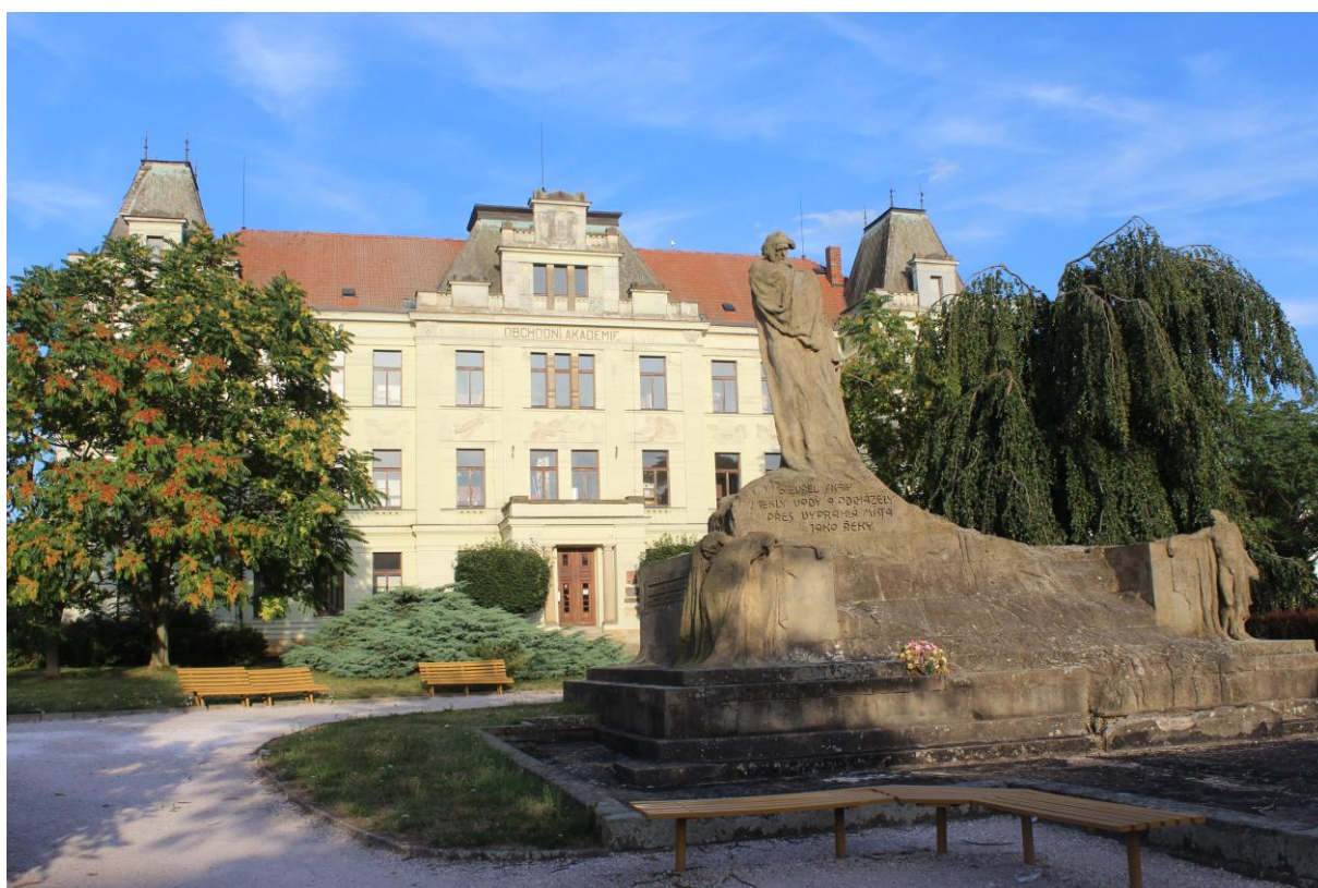
Obrázek 23. 36. Obchodní akademie – Hořice, Husovo náměstí