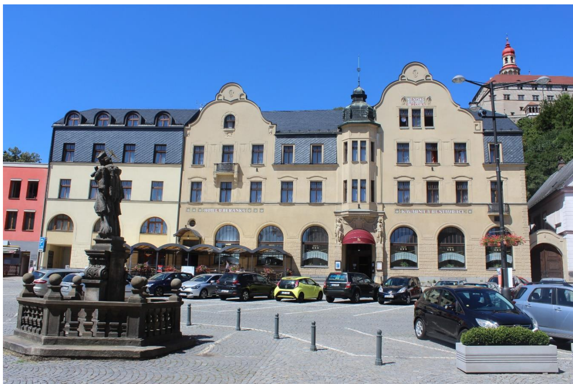
Obrázek 2. Městského divadla Dr. Josefa Čížka a hotel U Beránka – Náchod, Masarykovo náměstí čp. 7