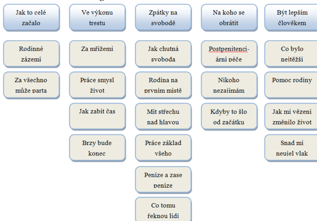
Obrázek 1: Schéma kategorií a kódů

Následující kapitola diplomové práce je věnována analýze dat, jež byla získána prostřednictvím polostrukturovaných rozhovorů s bývalými odsouzenými muži. Jak bylo popsáno výše, metodou analýzy dat bylo pro účely výzkumného šetření zvoleno otevřené kódování. Na základě stanovených výzkumných otázek byly vytvořeny jednotlivé kategorie a k nim přiřazeny kódy. V průběhu kódování rozhovorů docházelo ke zpětnému dotváření kódů tak, aby co nejkonkrétněji odpovídaly získaným odpovědím. Pro lepší přehled uvádíme schéma kategorií a kódů.