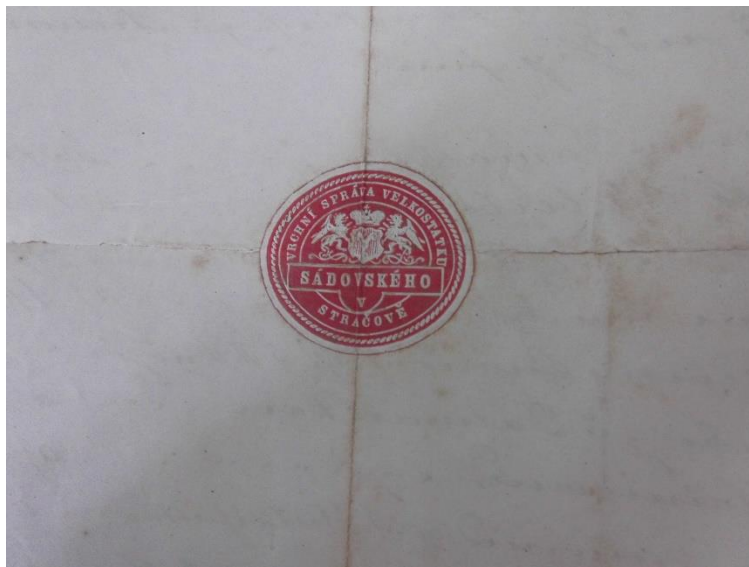
Nálepka Vrchní správy velkostatku Sádovského v Stračově