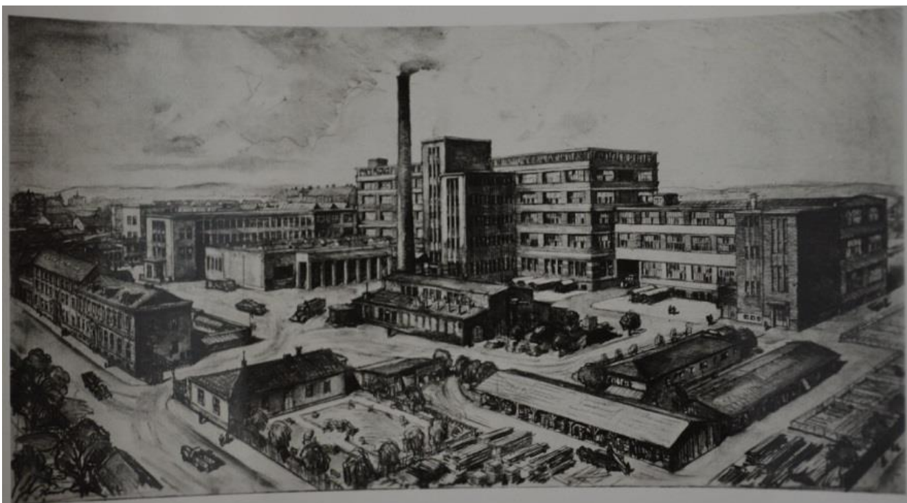
Obrázek 1 – Snímek areálu chrudimské továrny

Na následující fotografii 46 je možné vidět areál podniku. Přestože dnes v archivu není možné dohledat, kdy přesně záběr vznikl, nemůže to být déle než v roce 1925, kdy proběhla zmiňovaná výstavba pětipatrové budovy. Ta je viděla na snímku na pravé straně od továrního komína uprostřed. Na levé straně se pak nachází původní dvoupatrová budova. Mimo výstavby je možné na snímku vidět i vjezd do továrny v levém dolním rohu. Ten byl využíván téměř celé 20. století, dnes už jsou ale jeho brány uzavřeny. Silnice u vjezdu představovala už dříve důležitou spojnici, v dnešní době je součástí silničního městského okruhu.