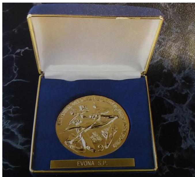
Obrázek 4 – Ocenění podniku Zlatá medaile

V roce 1992 se podniku dostalo ocenění Zlatá medaile. Poreferováno o tom bylo například v propagačním letáku Evony: „ Významného mezinárodního úspěchu dosáhla Evona Chrudim v roce 1992, když získala v VI. ročníku soutěže, pořádané španělskou organizací EDITORIAL OFICE a TRADE LEADERS CLUB a nakladatelstvím MERCADO MUNDIAL prestižní zlatou medaili za kvalitu v oboru textilu a konfekce. “ 107 Tu je možné vidět na následující fotografii.