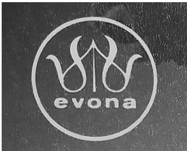
Obrázek 3 – Znak podniku Evona

Podnik měl svou vlastní ochrannou známku „Evona“: Název měl evokovat ženskost a souvisel i se znakem podniku. Ve znaku byl vyobrazen lístek, který symbolizoval solidnost a tradici pletářské výroby; svými rysy připomínal květ lilie pro vyjádření jemnosti produkovaného zboží a zároveň se podobal pletářskému očku. Tento znak je možné vidět na následující fotografii 98 .